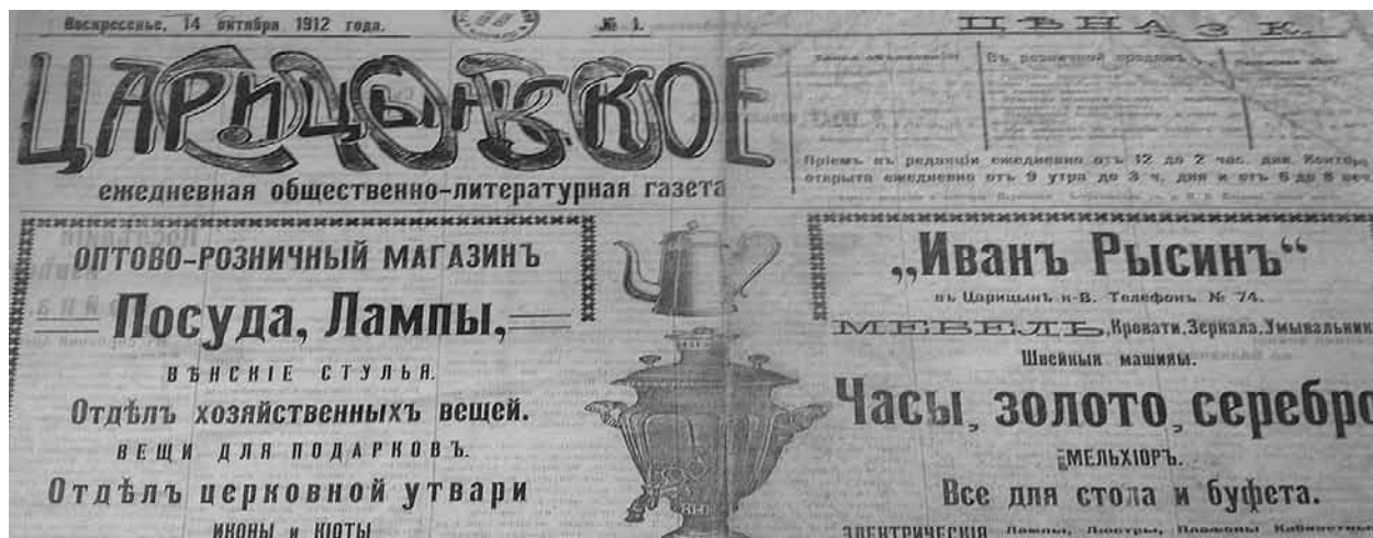
Приложение 1. Первая страница первого выпуска газеты

“Царицынское слово” выходила ежедневно и имела стандартный размер в 4 страницы. Цена отдельного номера газеты составляла 3 копейки, подписная цена на газету на год составляла 5 рублей, на полгода – 2 рубля 60 копеек, на один месяц – 50 копеек [2]. Для сравнения подписная цена на самую известную и популярную газету города в то время “Царицынский вестник” составляла на год 7 рублей, на полгода – 4 рубля, на месяц – 75 копеек [3]. Следовательно, исследуемая газета была рассчитана на малообеспеченные слои горожан.