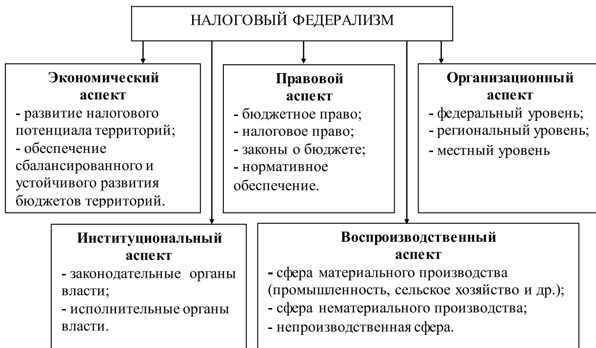
Рис. 1. Многоаспектное содержание налогового федерализма