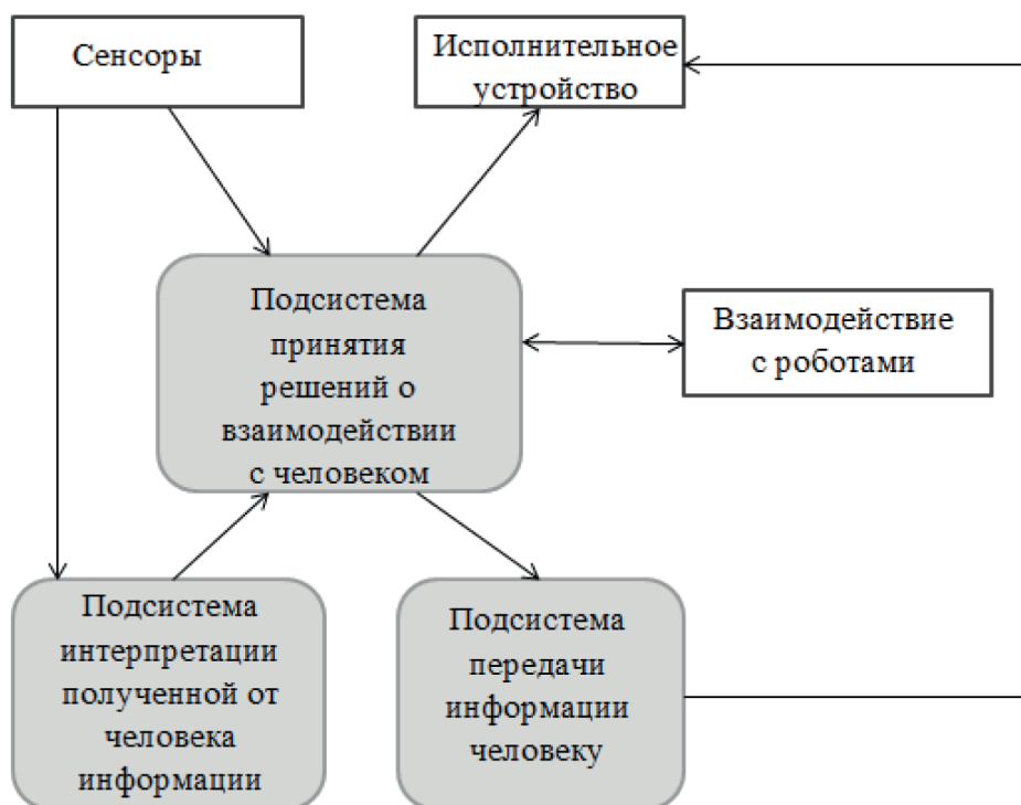
Рис.2. Схема программной системы, обеспечивающей возможность гетерогенного взаимодействия

с человеком. Схема программной системы представлена на Рис.2.