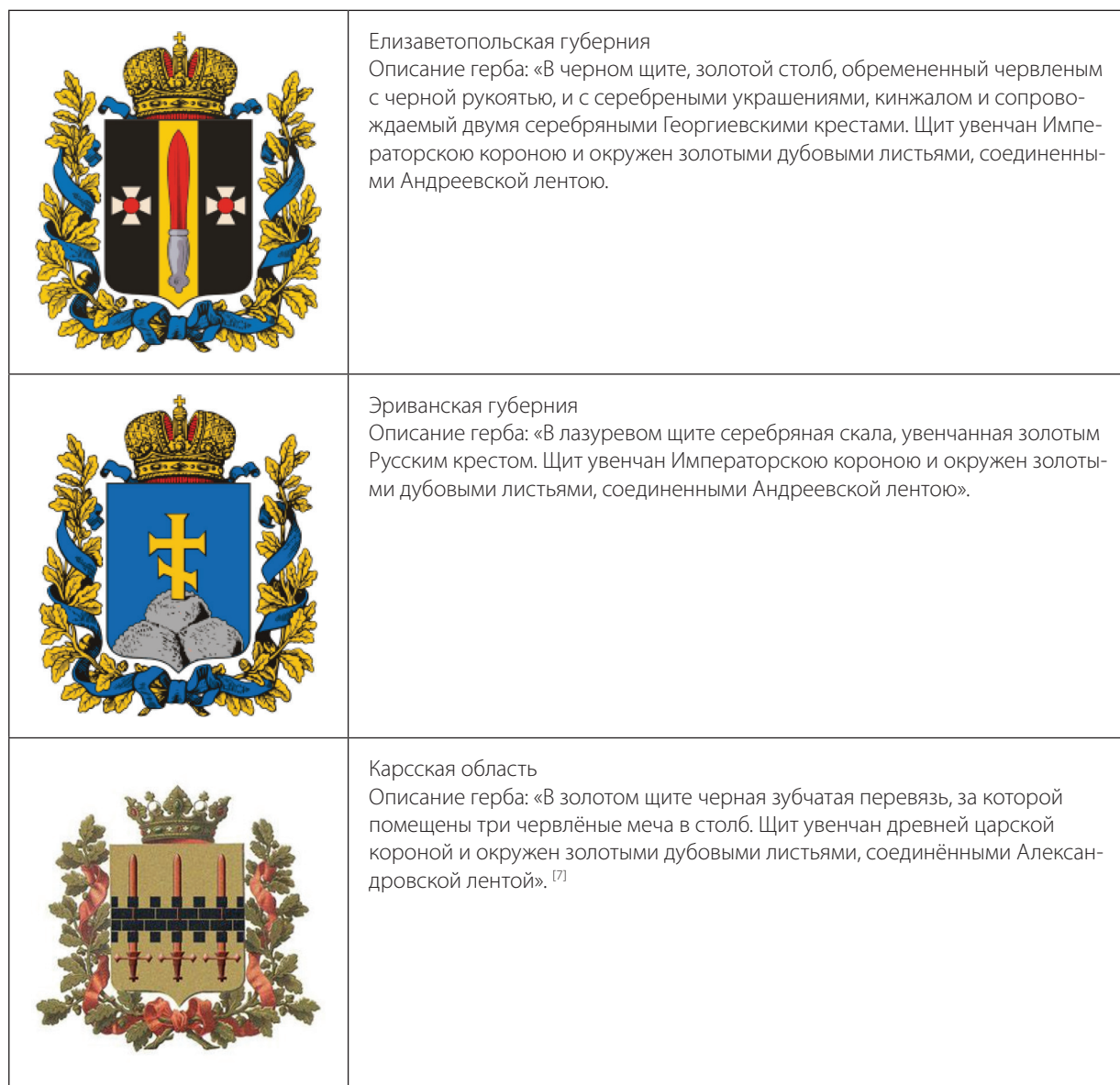
Таблица 1. Гербы закавказских регионов Российской империи 1917 год

Первые упоминания об Армении встречаются ещё до нашей эры. Данные земли во времена расцвета становились самостоятельными государствами, такими как Малая Армения, Софена, Араратское царство, Великая Армения. Одна из первых царских династий Великой Армении была династия Арташесидов . В благоприятные времена Армения разрасталась в размерах от Палестины до Каспия. Во времена воин делилась между империями и царствами, при этом попадая под протекторат Рима или Парфии. Армения была первая страна, принявшая христианство в качестве государственной