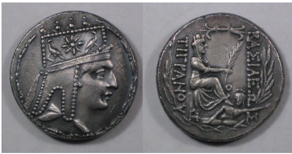
Рисунок 2. Тетрадрахма Тиграна II и его символы