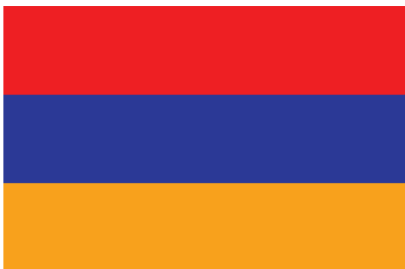
Рисунок 10. Флаг республики Армения

дый правитель имел собственные символы, обозначающие его царство. Поэтому, как было показано выше, смысловая точность указанных символов вызывает сомнение.