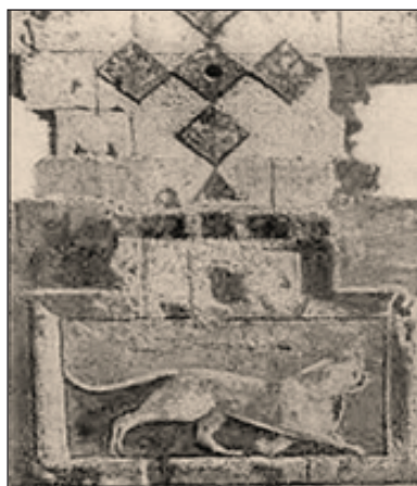
Рисунок 4. Фотографии символов города Ани и символ династии Багратидов