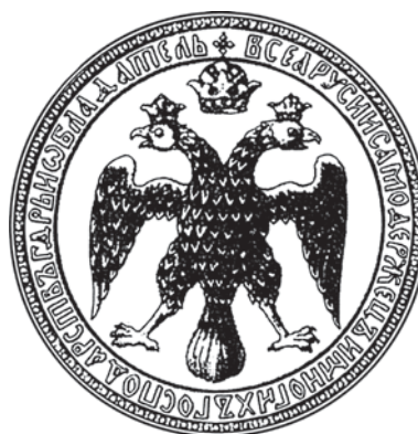
Рисунок 1. Печать Михаила Романова. Обратная сторона (1625 год)

Рассмотрим ряд геральдических символов первых Романовых.