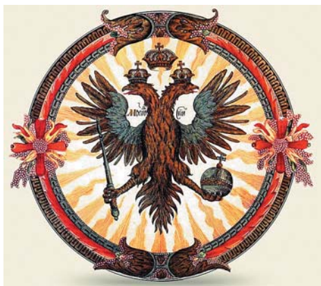
Рисунок 3. Герб из титулярника (1672 г.)

Рассмотрим отдельные элементы гербов первых Романовых. Центральным элементом на них выступает двуглавый орел.