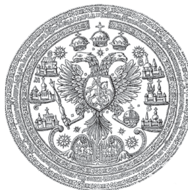
Рисунок 2. Государственная печать царя Алексея Михайловича (1667 г.).