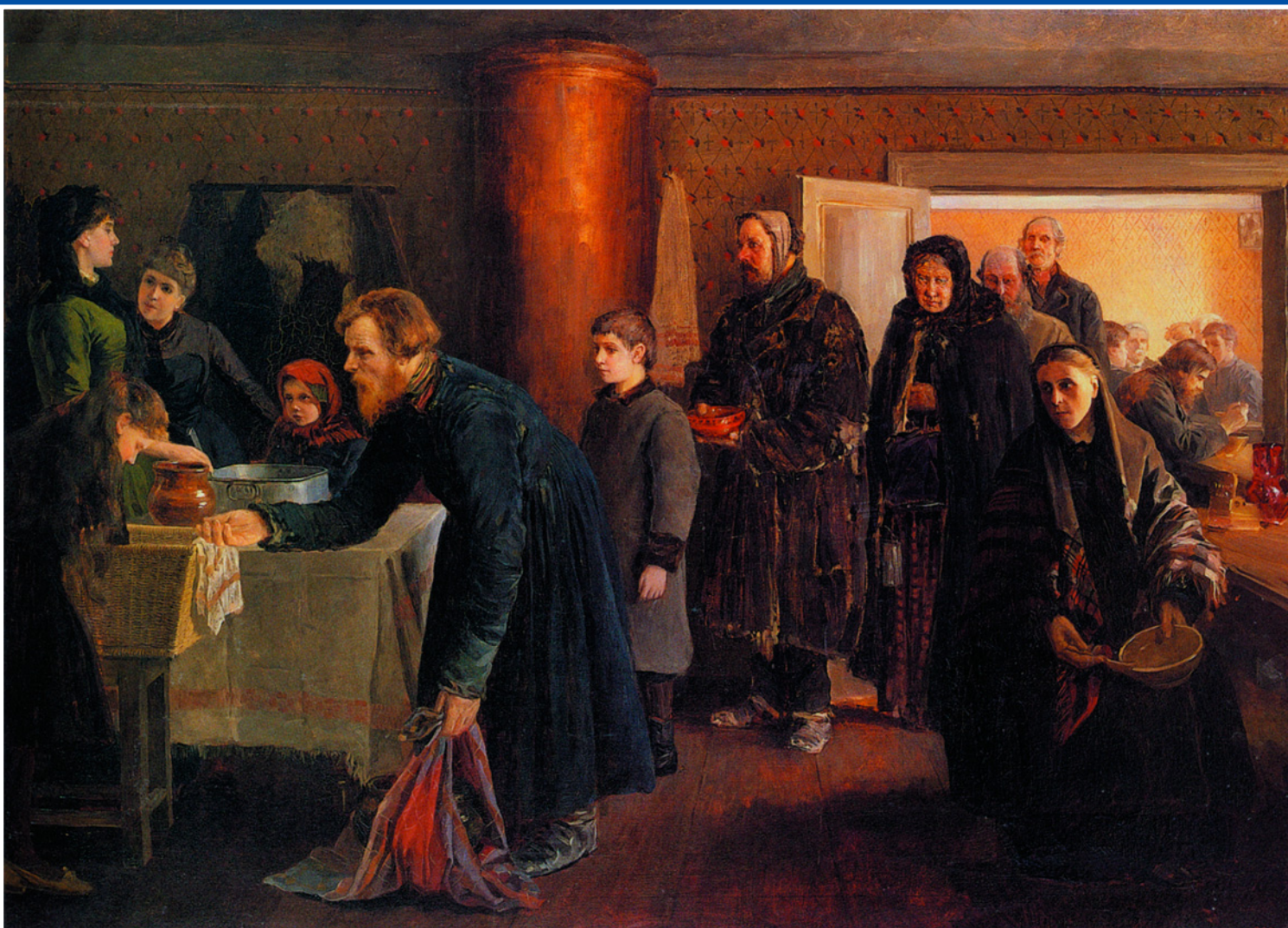
Даровая столовая. Худ. Василий Навозов. 1888 г.

Губернские и уездные земские комитеты в дореволюционной России возводили приюты, организовывали сбор пожертвований, в неурожайные годы организовывали бесплатные столовые и раздавали хлеб.