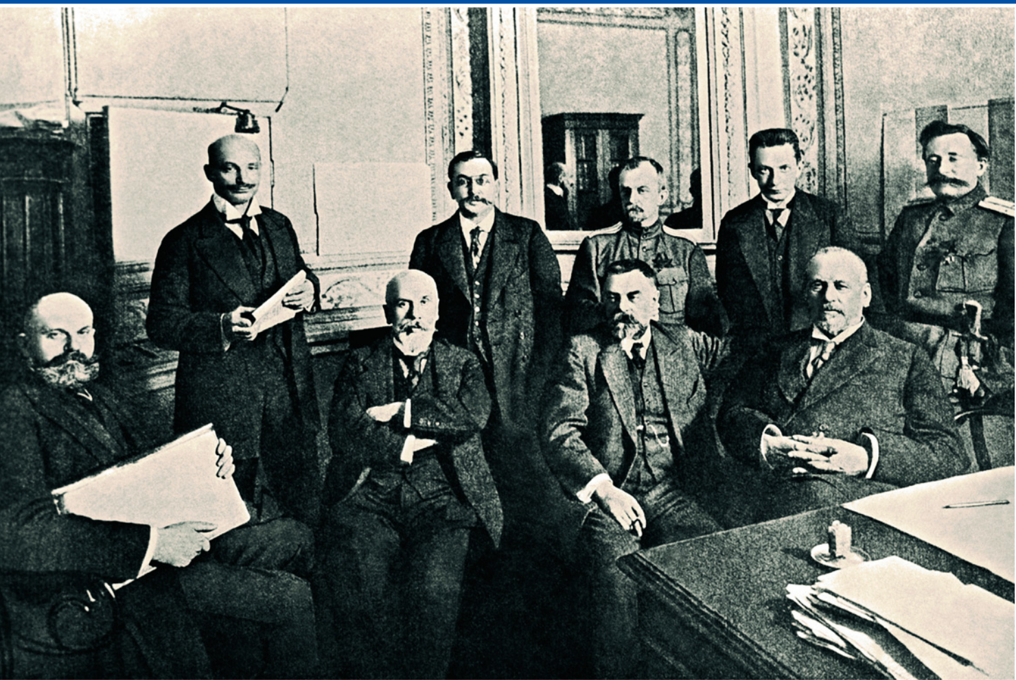
Временный комитет Государственной думы, сформированный 27 февраля (12 марта) 1917 года в Петрограде. Крайний слева в первом ряду – Георгий Евгеньевич Львов.

По словам очевидцев, он не любил даже само слово «политика». Это немало раздражало его коллег Милюкова, Гучкова, Керенского, политизированных до мозга костей. Он вообще резко отличался от деятелей, которые впоследствии станут его политическими соратниками.