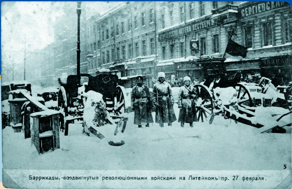
Баррикады, воздвигнутыя революционными войсками на Литейномъ пр. 27 февраля.

Баррикады на Литейном в дни Февральской революции 1917 года.