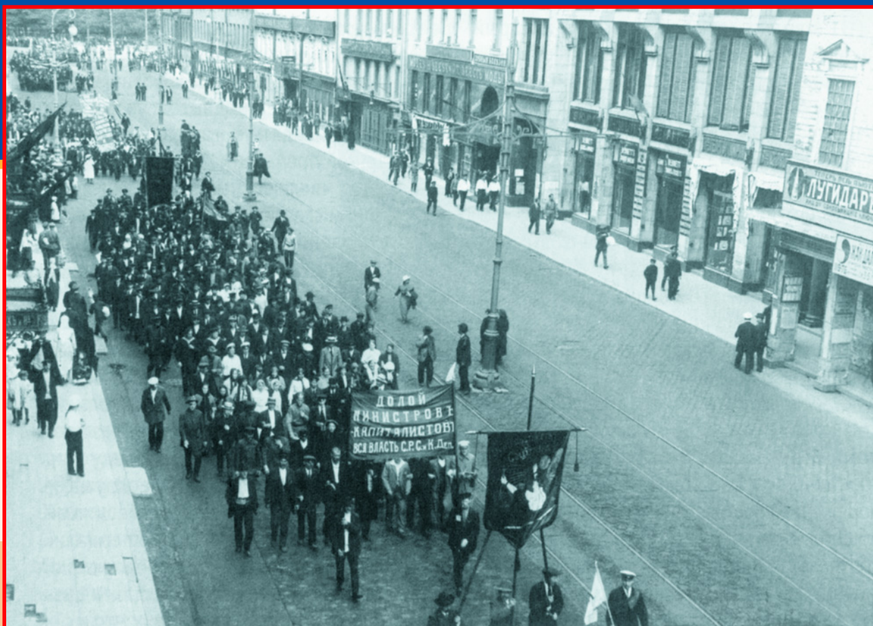
Хроника революции: антиправительственные выступления 3-5 (16-18) июля 1917 года, возглавляемые большевиками. Демонстранты выдвинули требования отставки Временного правительства, передачи власти Советам и переговоров с Германией о заключении мира.

бежал в Тюмень, где в феврале 1918 года был арестован и препровожден в Екатеринбург. В тюрьме Георгий Евгеньевич кашеварил и занимался наведением чистоты в камерах. Тут же ему пришлось, когда на смену русским мужичкам в шинелях тюремщиками стали «интернационалисты» из австрийских и немецких военнопленных. Он снова бежал, уже в Омск, связавшись с представителями белого движения, с их помощью уехал в октябре 1918 года в Америку, где встречался с президентом Вильсоном.