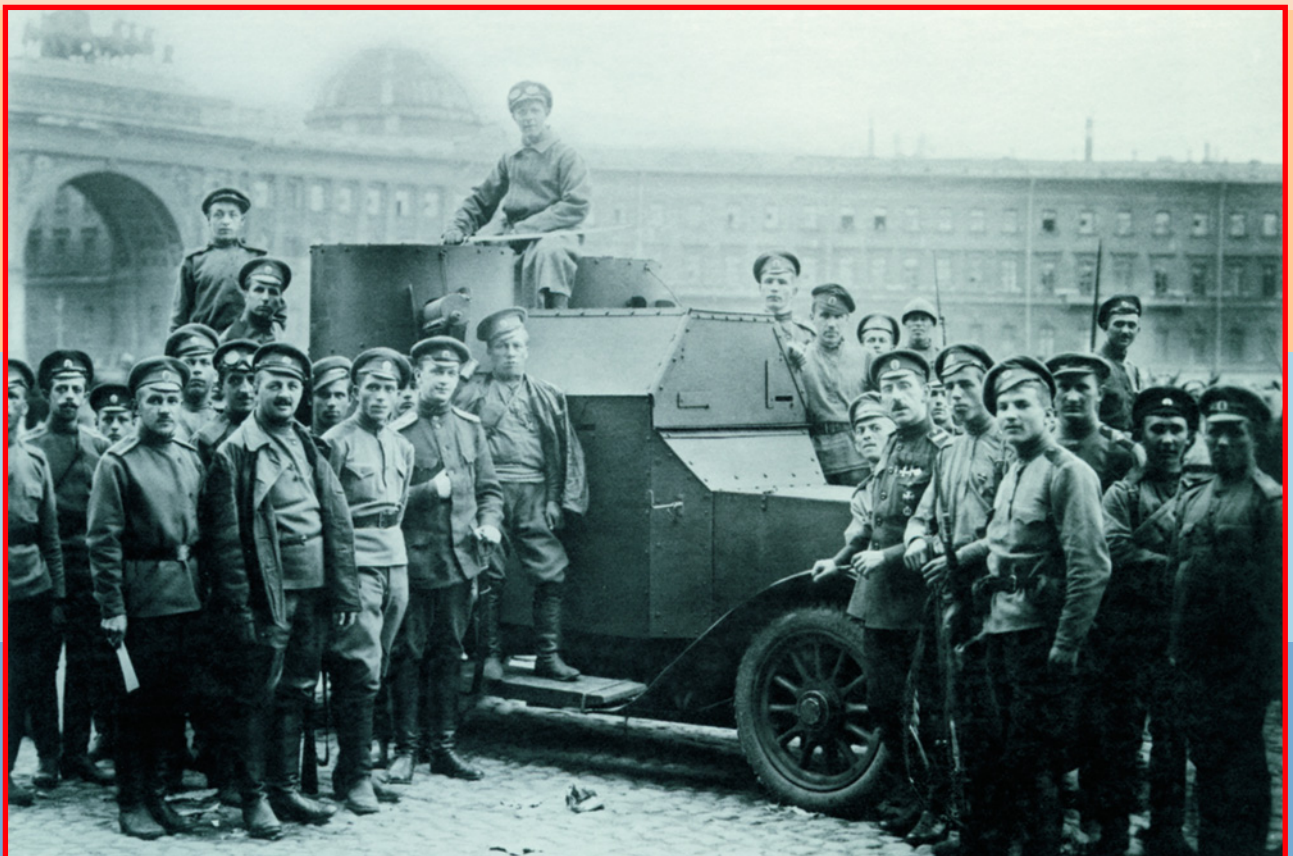
Внизу: Юнкера на Дворцовой площади Петрограда. Сзади видна арка Главного штаба. Фотография 1917 г.

Чужим он стал скоро и «своим». Всегда ровный, тихий, мало говорящий человек, князь Львов многих министров раздражал своей чрезмерной терпимостью, предпочитавших видеть в главе государства, каким по сути являлся Министр-председатель Временного Правительства, больше руководящей воли.