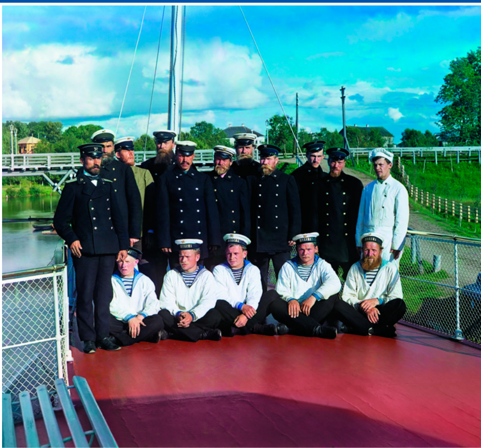
Дореволюционная Россия. Команда парохода «Шексна». 1909 г.

В эпоху пошатнувшихся устоев и разбушевавшейся стихии моральные установки князя Львова оказались плохим подспорьем для умирения бунтующих революционных масс. «Надо было стрелять в народ, сказал он, а я этого не мог» , – уже в изгнании напишет Георгий Евгеньевич.