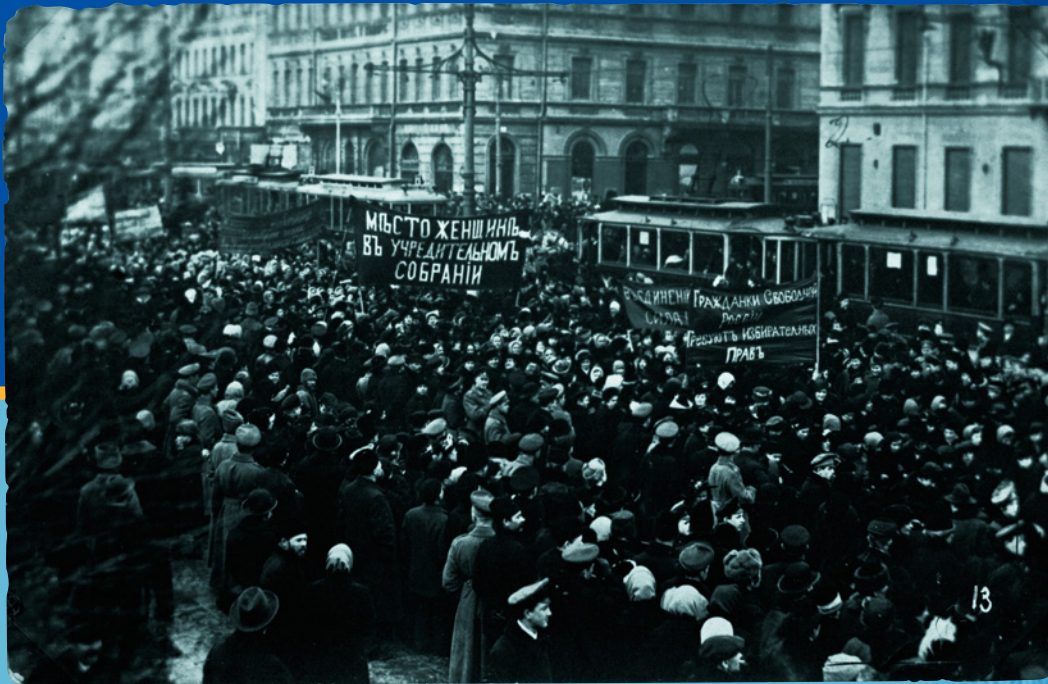
Хроника революции: митинг на Невском проспекте после февральской революции 1917 года.

Федоровичу Керенскому, занимавшему во Временном правительстве пост министра юстиции и одновременно бывшего одним из заместителей председателя Петроградского совета. Впрочем, ни ему, ни Белой гвардии, тоже оказалось не по силам провести уже тонущий корабль русской