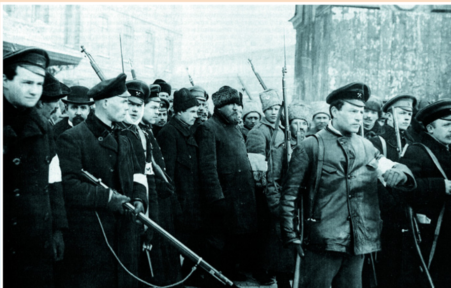
Хроника революции: арест и конвоирование переодетых Петроградских городовых. Февраль 1917 года.

К тому же, думские деятели, мечтавшие о свержении монархии, вовсе не хотели, чтобы на смену царю пришел какой-нибудь «Наполеон». Вот почему князь Львов виделся им самым подходящим кандидатом на пост главы после-революционного правительства.