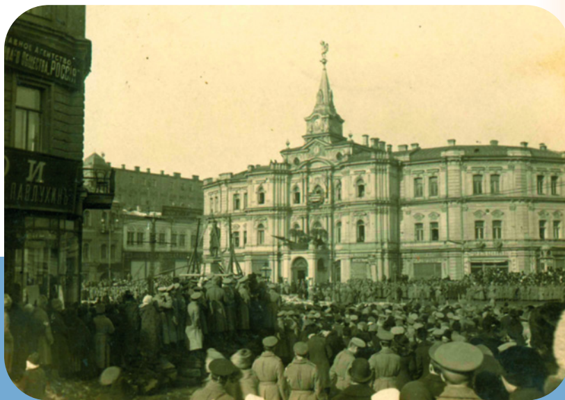
Хроника революции: свержение памятника Столыпину в Киеве во время Украинской манифестации 19 марта 1917 года.

утверждал Гучков, в неизбежный триумф демократии, в способность русского народа играть созидательную роль в делах государства. И не уставал и на людях, и в частных разговорах повторять слова: «Не теряйте присутствия духа, сохраняйте веру в свободу России!»