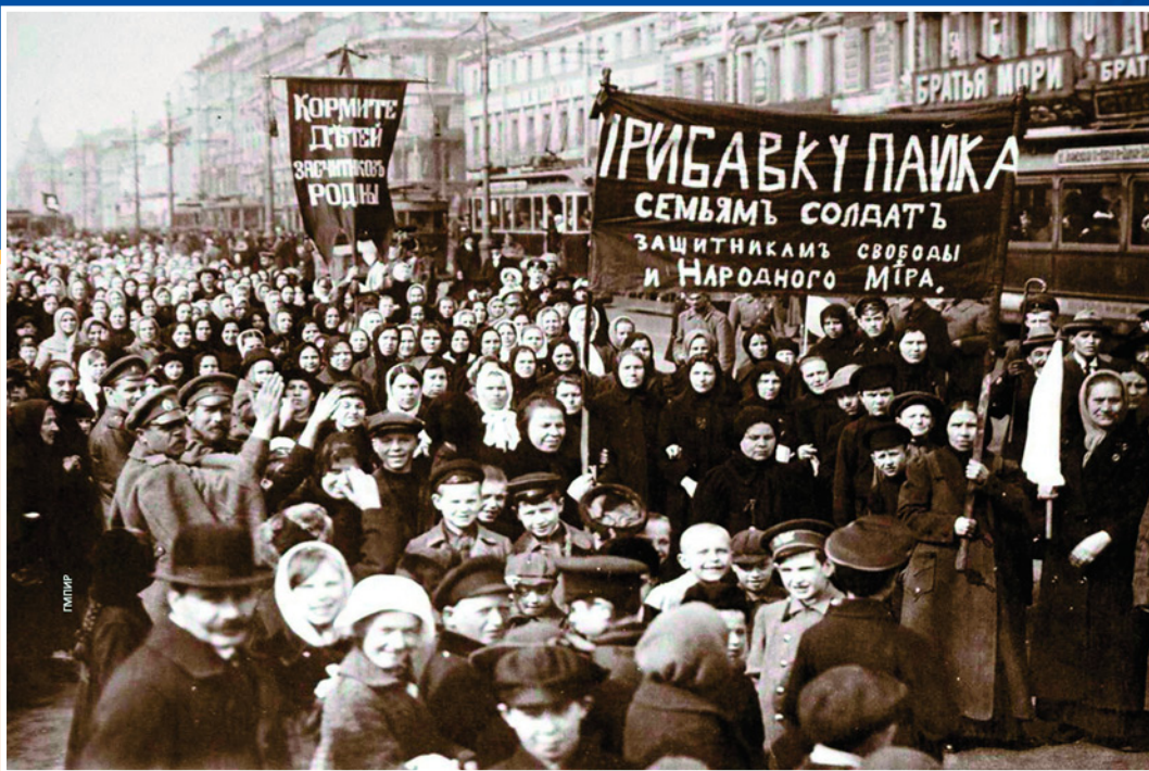
Демонстрация работниц Путиловского завода в первый день Февральской революции 1917 года.

Советы рабочих депутатов Львов считал «досадной помехой», а не «второй властью». Тем не менее, он выдвинул идею «коалиции с социалистами». Идея оказалась непродуктивной: новое, коалиционное правительство с министрами-социалистами лишь ослабило правительственный аппарат и не могло справиться с нараставшими крестьянскими волнениями, которыми был отмечен май.