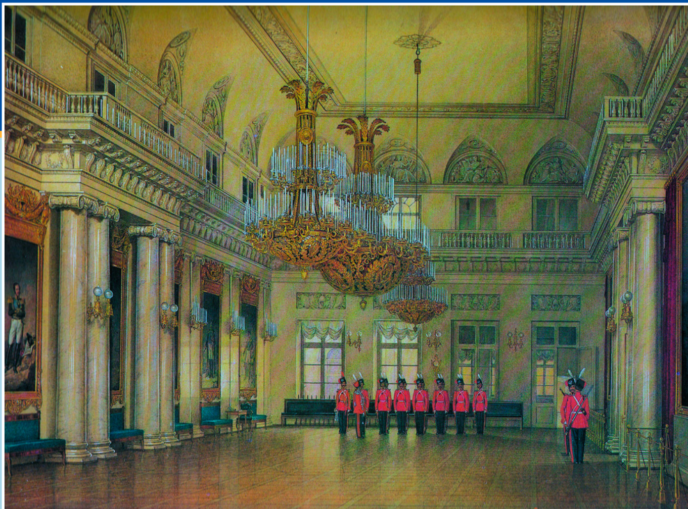
Фельдмаршалский зал Зимнего дворца. Худ. Эдуард Гай. 1866 г.

деревенской жизни Центральной России на рубеже XIX и XX веков.