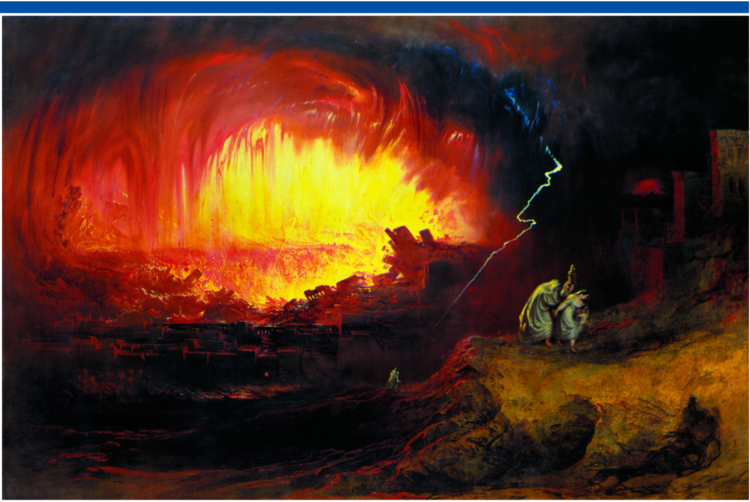
← Лот и его дочери. Худ. Альбрехт Дюрер. 1496-1499 гг. Национальная галерея искусства, Вашингтон, США.