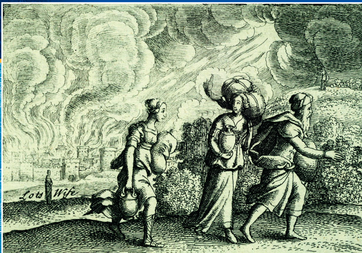
Жена Лота, превратившаяся в соляной столб на гравюре Вацлава Холлара «Бегство семьи Лота из Содома». XVII в. Библиотека Университета Торонто, Канада.

зоны, имело чрезвычайно неустойчивую геотектоническую структуру. Основными доказательствами некогда произошедшего здесь вулканического взрыва и мощного землетрясения являются обнаруженные в ходе раскопок пласты застывшей лавы и базальта. Как пишет немецкий археолог Вернер Келлер: «Во время крупного оседания, возникшее однажды в этом районе, здесь произошло ужасное землетрясение,