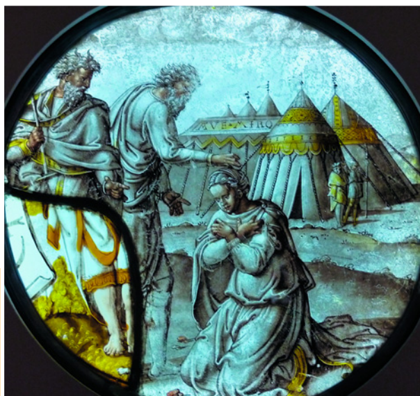
Наказание Мириам проказой. Витраж в музее Шнютген. Нидерландский мастер. 1530 г. Кельн, Германия.

преследователей. «И взяла Мириам пророчица, сестра Ааронова, в руку свою тимпан, и вышли за нею все женщины с тимпанами и ликованием» (Книга Исхода, 15:20). А библейская история о том, как Мириам пела и танцевала на берегу моря, тысячелетия спустя послужит вдохновению многих художников, став сюжетом живописных полотен.