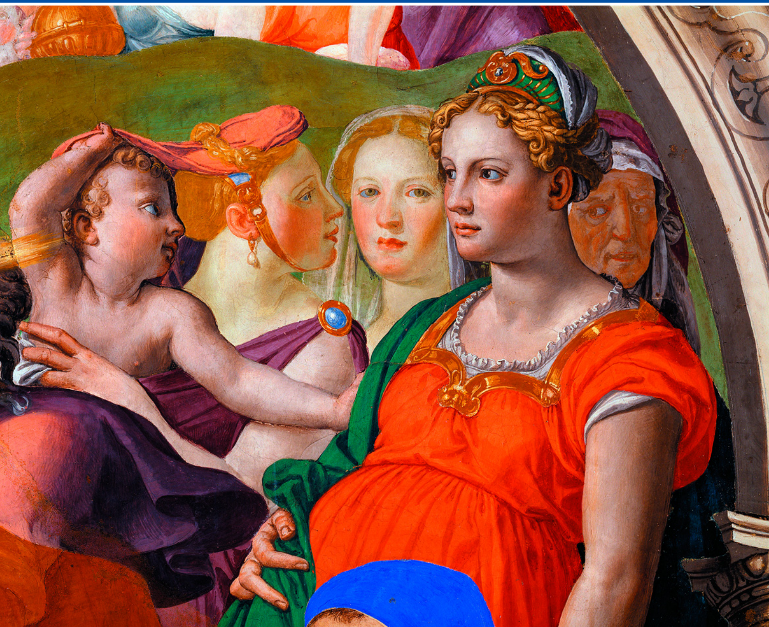
Иллюстрации на развороте: Эпизоды перехода через Красное море. Фрагменты фрески Аньоло Бронзино. 1540 – 1545 гг. Палаццо Веккьо, Флоренция.

израильского народа, отличавшуюся даже своей внешностью – жена Моисея была значительно смуглее еврейских женщин. «И упрекали Мириам и Аарон Моисея за жену Ефиоплянку, которую он взял, – ибо он взял [за себя] Ефиоплянку, – и сказали: одному ли Моисею говорил Господь? не говорил ли Он и нам?» (Числа, 12:1) Причем, как считают библеисты, на основе анализа этой главы можно полагать, что имя Аарона было включено позднее, и только Мириам хватило смелости высказать то, что она думает самому Моисею, с которым никогда никто