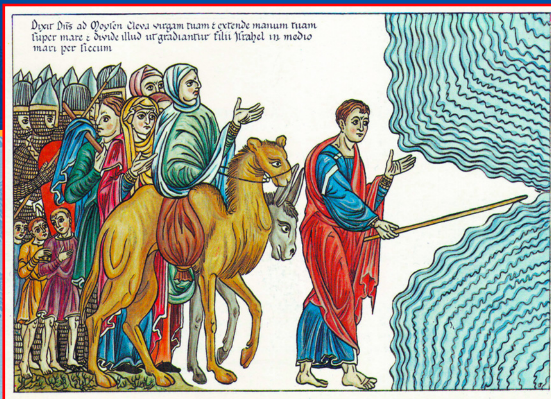
Моисей ведет народ Израиля через Красное море. 1180 г. Миниатюра из иллюстрированной энциклопедии Геррады Ландсбергской «Hortus deliciarum».

В 1870 году оригинальная рукопись, хранившаяся в Страсбургской библиотеке, сгорела в ходе франко-прусской войны. Миниатюра копирована в 1818 году Кристианом Морцем Энгельгардтом.