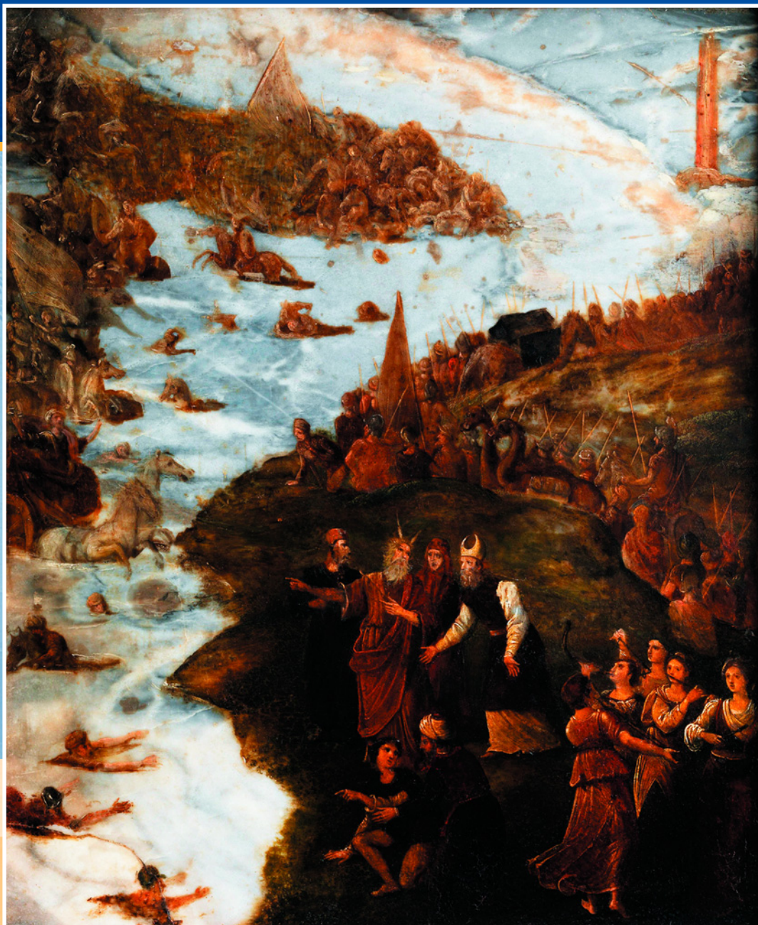
Танец Мириам. Худ. Лоренцо Коста. XVI в. Лондонская Национальная галерея.

в Скинию Завета, и указывал, как распланировать лагерь. Воды его поднимались, проливались на землю и разделялись на отдельные потоки, самый большой из которых окружал весь лагерь. Еще двенадцать ручьев образовывались между коленами Израиля, очерчивая участки земли каждого рода и указывая их границы, предупреждая тем самым территориальные споры. Из-за воды, как это бывает в пустыне, разногласия появиться тоже не могли – ее было так много, что переправиться из одного лагеря в другой можно было только на лодке.