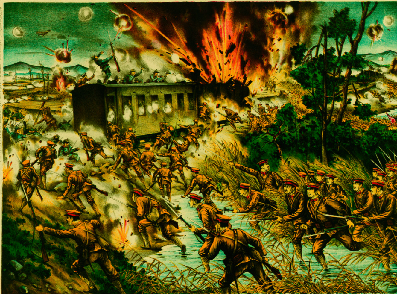
THE ILLUSTRATION OF THE SIBERIAN WAR. № 6 The Brilliant Exploit of The Nishino Infantry Company Destroyed Rail Road, Going Around The Bank of The Ensoyong

Летом 1918 года японская армия оказала поддержку Белой армии. С помощью 5-ой японской дивизии и отряда под командованием Григория Семенова было взято под контроль и основано белое правительство в Забайкалье. Японская литография. 1920 г.