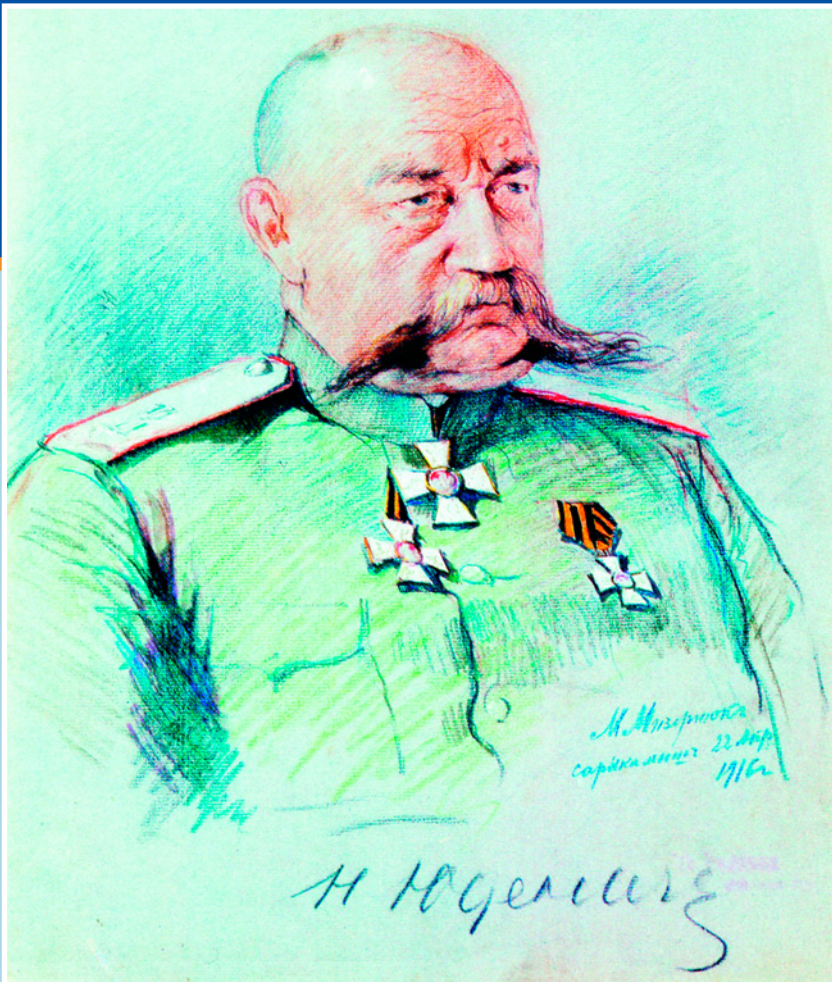
Генерал Н. Н. Юденич, с 5 июня 1919 года главнокомандующий всеми русскими сухопутными, морскими вооруженными силами Добровольческой армии на Северо-Западном фронте. Худ. Михаил Мизернюк, 1916 г.