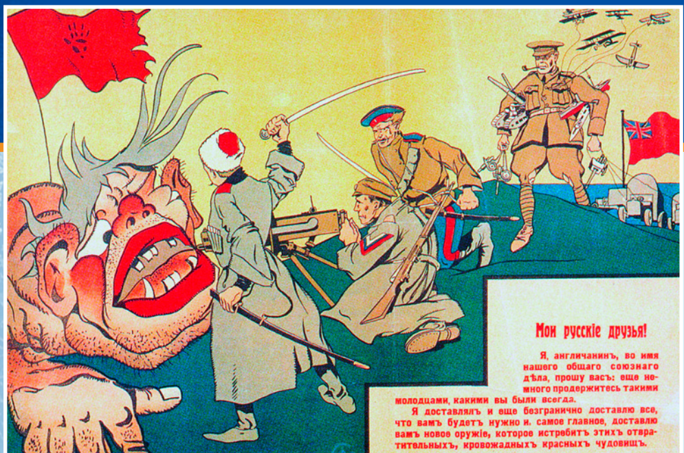
Плакат времен Гражданской войны: «Мои русские друзья! Я, англичанин, во имя нашего общего союзного дела, прошу вас: еще немного продержитесь такими молодцами, какими были всегда. Я доставлял и еще безгранично доставлю все, что вам будет нужно и, самое главное, доставлю вам новое оружие, которое истребит этих отвратительных, кровожадных красных чудовищ». Между 1918 и 1920 гг.