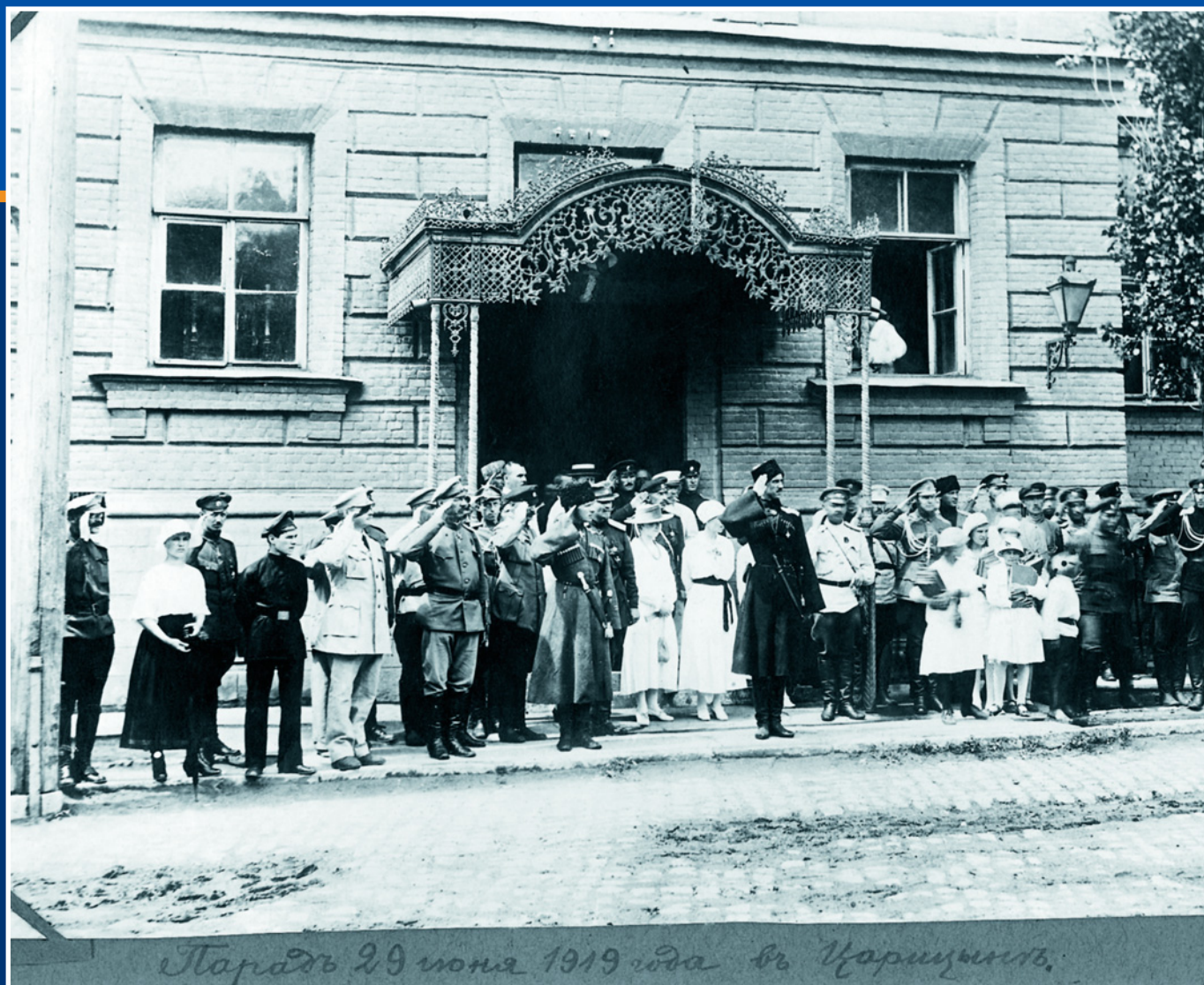
Парад 29 июня 1919 года в Царицын.

Один из главных руководителей Белого движения в годы Гражданской войны, барон П.Н. Врангель принимает парад белых частей в Царицыне 29 июня 1919 года.