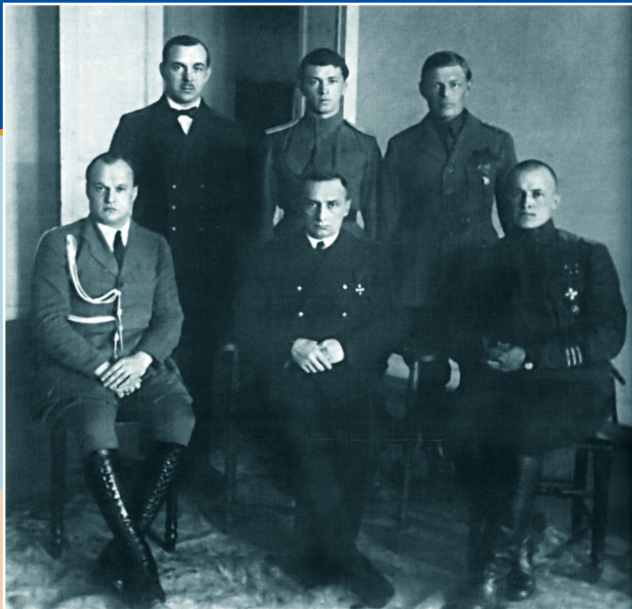
Военный министр Временного Всероссийского правительства, вице-адмирал А.В. Колчак со своим ближайшим окружением. Фотография 1918 г.

С фактической отменой в действующей армии единоначалия нарастала анархия, стали устраиваться самосуды над офицерами, наблюдалось массовое дезертирство. Партия большевиков, однако, ставила задачу полного уничтожения царской армии.