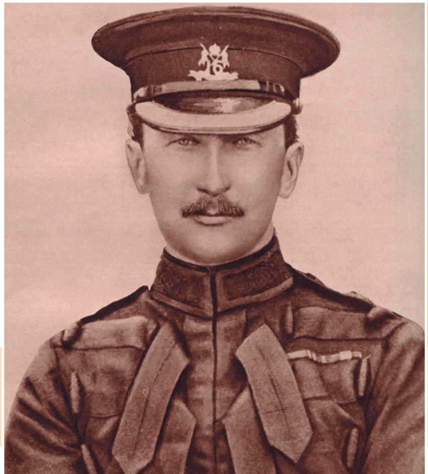
Английский генерал, глава британской военной миссии в Финляндии Хьюберт Гофф, через которого осуществлялась связь с Северо-Западной армией Юденича. Фотография 1919 г.