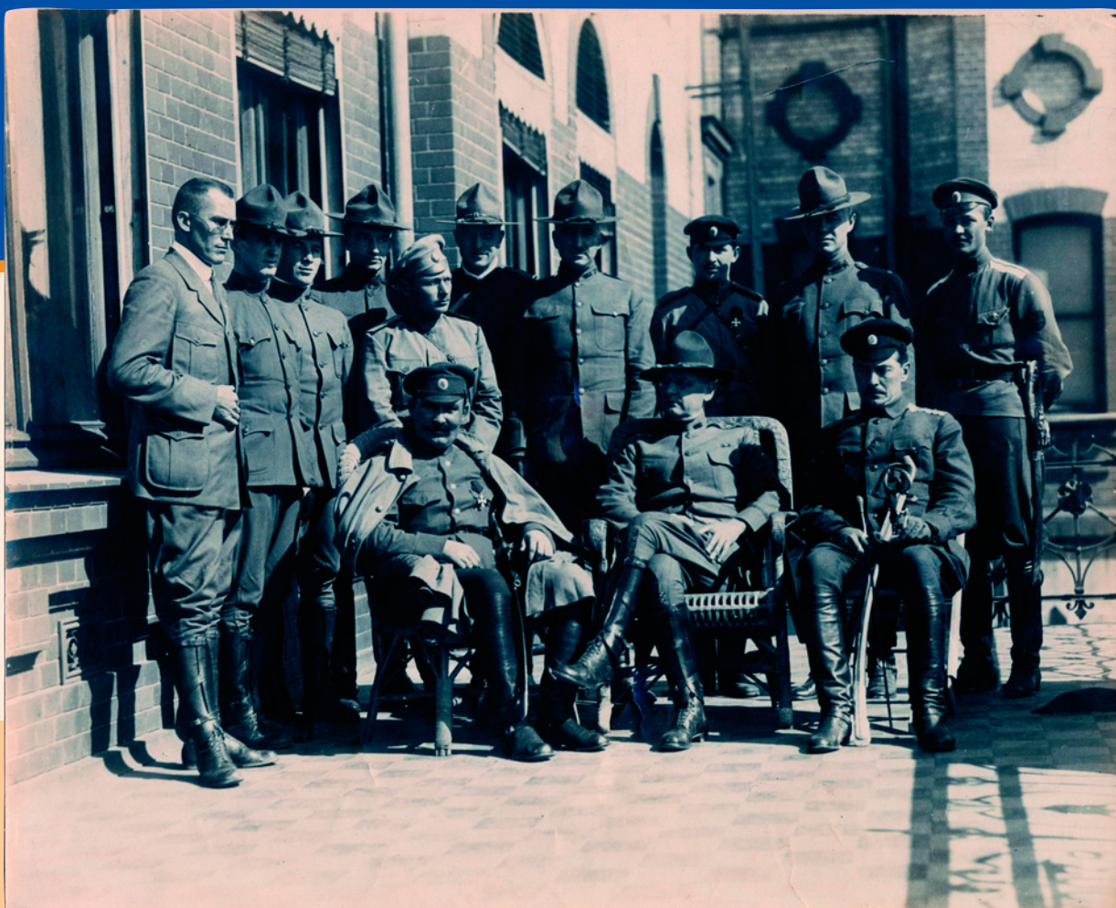
Атаман Г.М. Семенов во Владивостоке с офицерами британской и американской армий. Фотография 1918-1919 гг.

принципа единства страны. 23 декабря 1918 года на заседании британского кабинета, на которое были приглашены также премьер-министры доминионов, он потребовал от премьера Ллойда Джорджа ответа на центральный вопрос: какова наша политика? Оставить русских вариться в собственном соку или попытаться свергнуть власть большевиков?