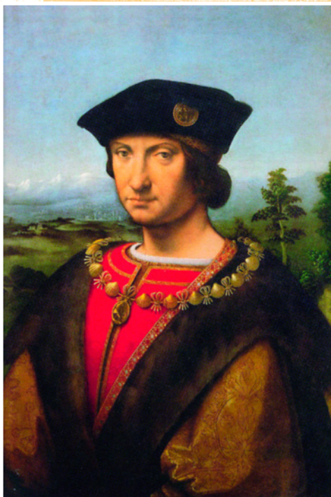
Портрет Карла II Амбуазского. Худ. Андреа Соларио (?). Около 1507 г. Лувр, Париж.

На рисунке можно увидеть левую часть северного крыла, разобранного в середине XVIII века. Ранее в северо-западном углу (на рисунке – в центре) возвышалась мощная башня, увенчанная люкарной и пинаклями, характерными для стиля пламенеющей готики. Судя по изяществу архитектурных элементов, в северном крыле находились проходные галереи, соединяющие основные жилые помещения, располагавшиеся в западной и восточной части. Вероятно, эти галереи служили местом для прогулок и любования живописными видами, открывавшимися отсюда на Луару.