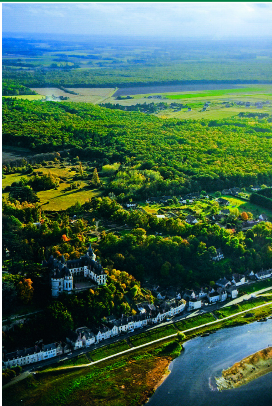
Замок Шомон с высоты птичьего полета.

рый основал здесь аббатство и еще больше укрепил свое владение. Его сын Жоффруа, не имевший потомства, завещал поместье своей внучатой племяннице Дениз де Фужер. В 1054 году она вышла замуж за Сульписа I Амбуазского, в результате чего замок почти на пять столетий перешел во владение могущественного Амбуазского дома.