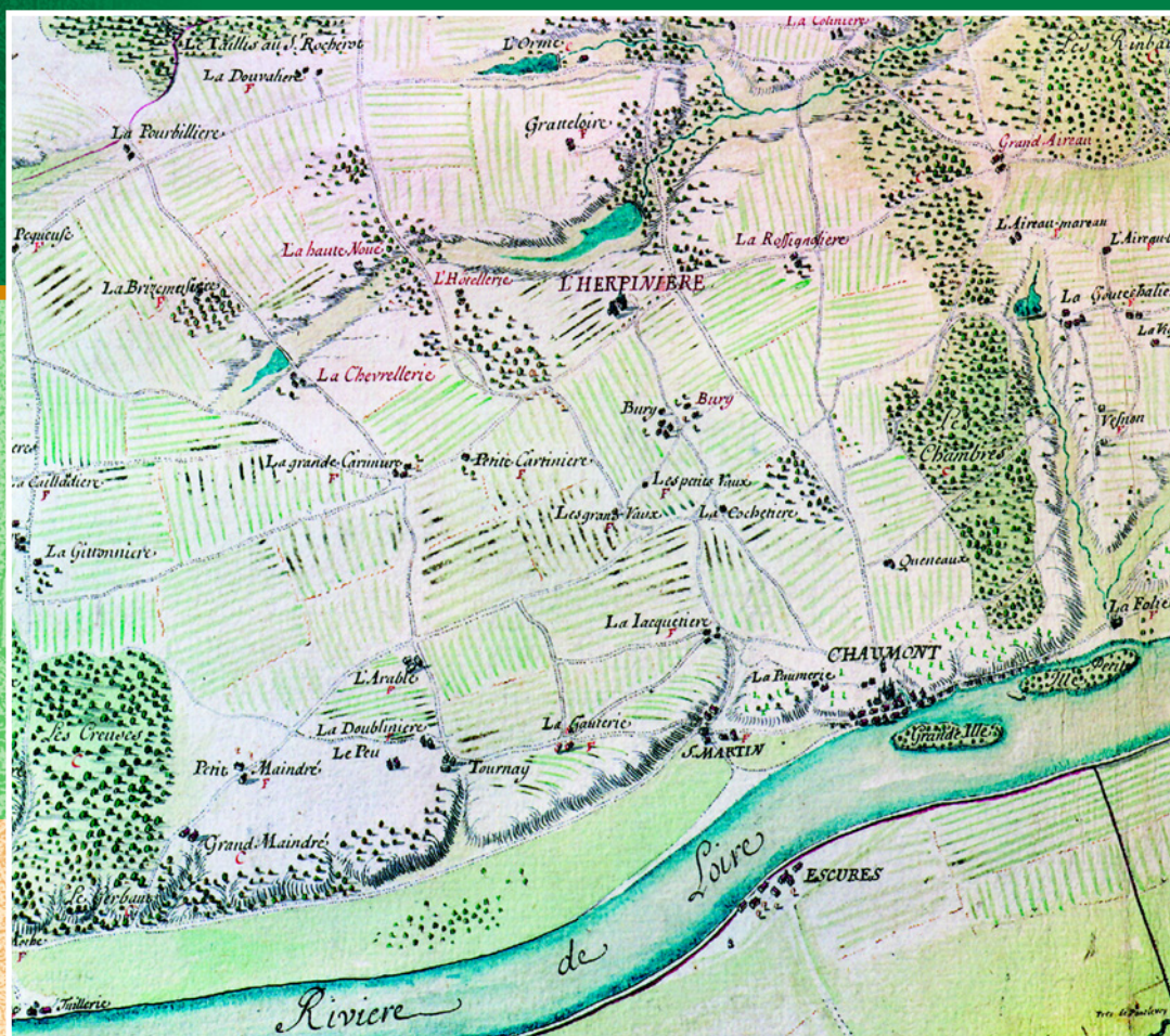
«План владения Шомон-на-Луаре монсеньора де Бовилье на 1702 год, созданный Пети, землемером Блуа». Фрагмент. Национальный архив Франции.

корпусами с четырех сторон, но в XVIII веке обращенное к Луаре северное крыло было разрушено и на его месте сооружена терраса, откуда открылся широкий вид на Луару и ее окрестности.