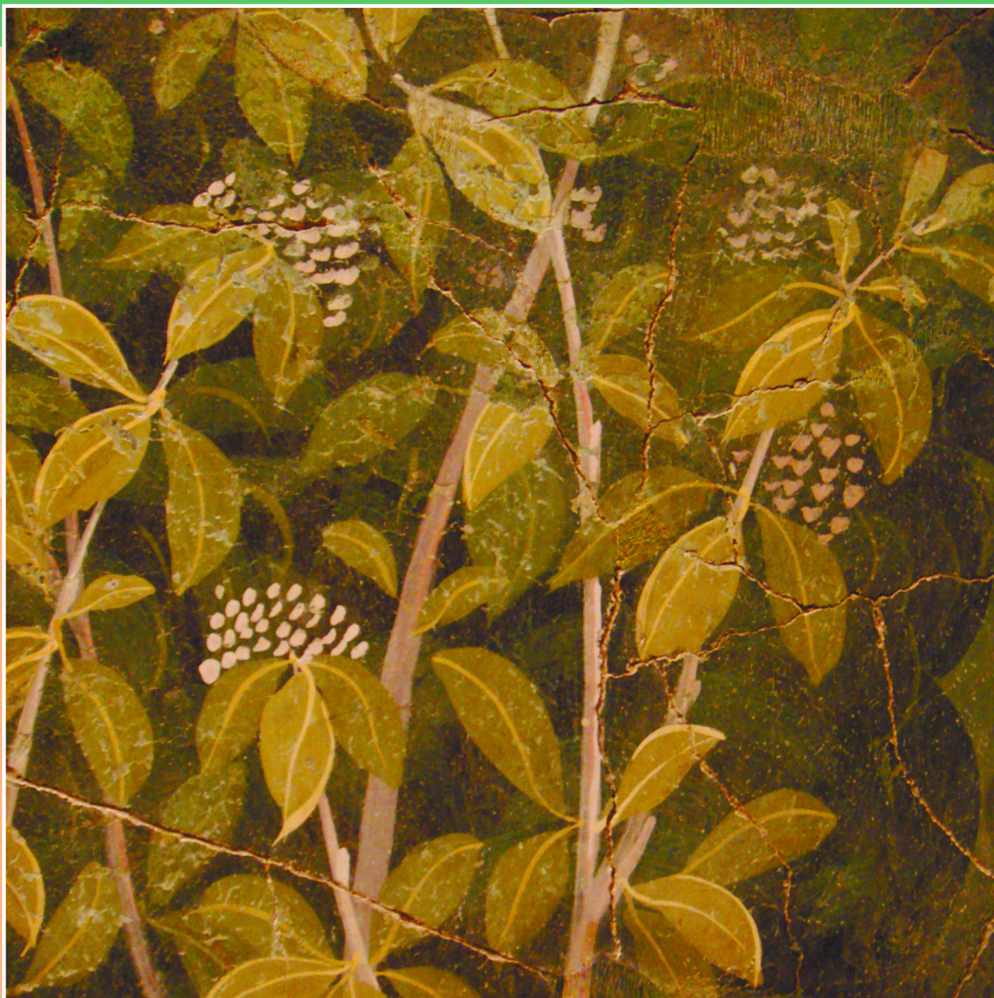
На фреске из «Дома золотого браслета» в Помпеях изображен предположительно сильфий. I в. Национальный археологический музей Неаполя. Италия.