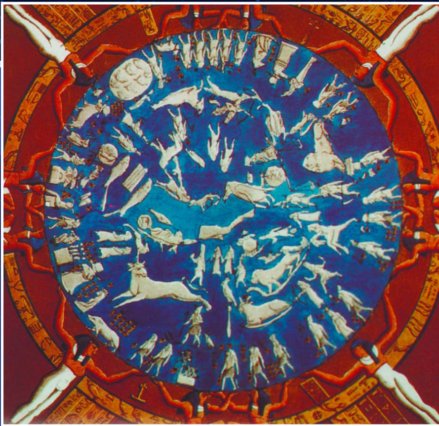
Зодиак древних египтян. IV-I в. до н. э. Из святилища Осириса, Дендера, Египет.

Звездное небо. ➔ Художник Джероламо Варезе.