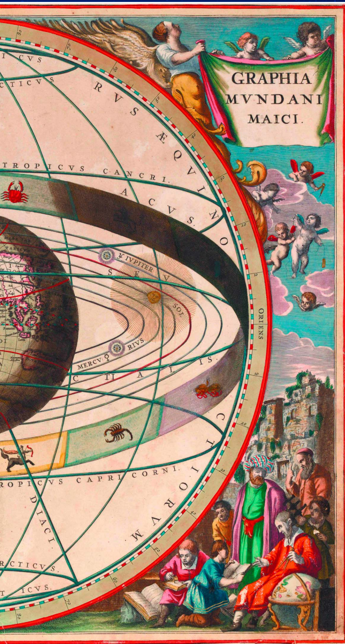
Схема Солнечной системы по Птолемею с кругом зодиакальных созвездий. Гравирована и издана Иоаннесом Ван Луном по рисунку известного астронома Андреаса Целлариуса. 1660 г. Амстердам.