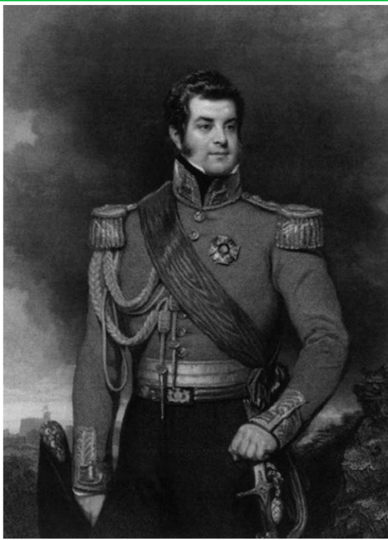
Портрет Георга Огастуса Фредерика Фицкларенса, 1-го графа Манстера. Гравюра Ричарда Остина Артетта по оригиналу Томаса Филлипса. Королевское собрание.

левы Шарлотты, а также своих тетушек, некоторые из которых ее просто обожали. После «Деликатного следствия» 1806 года, когда Каролина была фактически обвинена в прелюбодеянии, ее контакты с дочерью были еще больше сокращены. Шарлотта всегда понимала, что с самого рождения была пешкой в злобной шахматной партии своих родителей. Последний шанс на примирение они упустили еще в декабре 1798 года, когда Георг пригласил Каролину провести зиму в Карлтон-Хаусе, а она не приняла это предложение. Шарлотта всегда оставалась преданной своей матери, а отношения с отцом ухудшались по мере взросления: принцесса бунтовала и требовала большей свободы. Говорили, что однажды она сказала кому-то из друзей, что «мать не стала бы такой плохой, если бы мой отец не был во много раз хуже» .