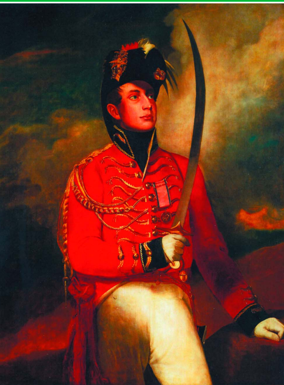
Портрет Уильяма, принца Оранского (будущего короля Уильяма II). Худ. Джон Синглтон Копли. Около 1812-1815 гг. Королевское собрание.

делали некоторые аристократки. Скорее это свидетельствует о том, что принцесса стала символом оппозиции. Ее политический выбор вдруг стал очень важен для остальной части страны, поэтому ее отец старался как можно больше ограничить ее свободу, выводя из зоны общественного внимания. Достигнув брачного возраста молодая женщина жила словно заключенная, лишь изредка покидая территорию Виндзорского дворца.