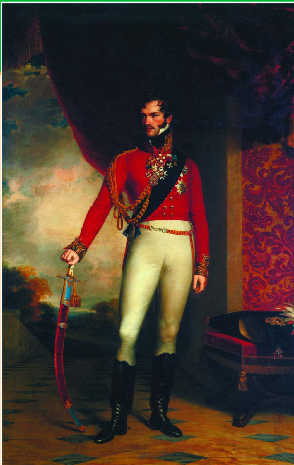
Портрет принца Леопольда. Худ. Джордж Доу. Около 1817 г. Королевское собрание, Бельгия.

упала в обморок. Очнувшись, она заявила: «Потеряв мою любимую дочь, Англия – эта великая страна – потеряла все». Даже отвергнутый когда-то принц Оранский не смог сдержать слез, а его молодая жена приказала всему двору носить траур по безвременной ушедшей английской принцессе.