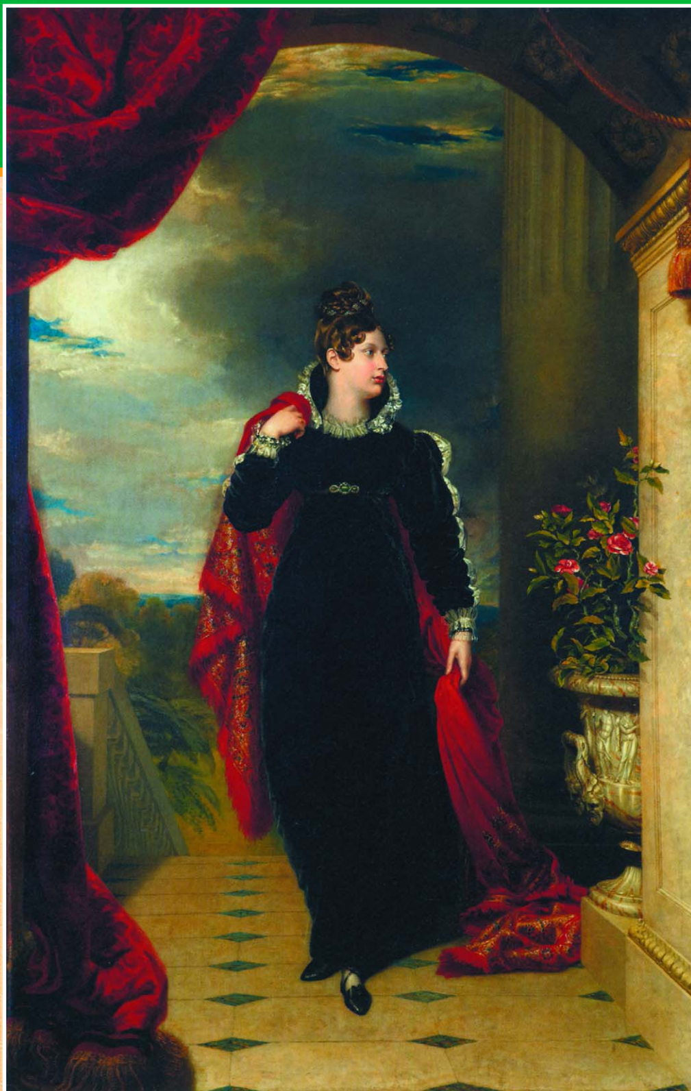
Портрет Шарлотты Августы, принцессы Уэльской. Худ. Джордж Доу. 1817 г. Королевское собрание, Бельгия.

и бездомные ходили с черными траурными повязками. В течение двух недель не работали магазины, Королевская биржа, суды и доки. Даже игорные заведения и публичные дома закрылись в знак почтения на время похорон. Как писал Генри Брум: «Действительно, создавалось такое впечатление, будто каждая семья в Великобритании потеряла любимое дитя» . Горе было насто-