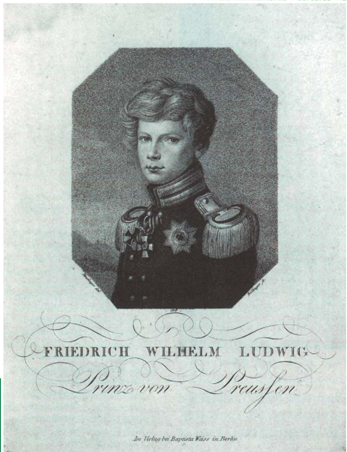
Портрет Фридриха Вильгельма Людвига, принца Прусского. Гравюра Фридриха Вильгельма Боллингера по оригиналу Иоганна Гойсингера. 1816 г. Берлинский городской музей.

Известно, что принцесса часто проводила время в обществе бабушки и дедушки, особенно бабушки – чопорной и сухой коро-