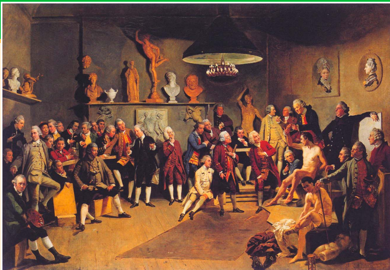
Члены Академии художеств. Худ. Иоганн Цоффани. Около 1770-1772 гг. Королевское собрание.

Осенью 1782 года по заказу королевы Шарлотты Гейнсборо пишет в Букингемском дворце серию из овальных портретов всех членов королевской семьи. Эти 15 небольших полотен демонстрируют удивительную способность Гейнсборо передать впечатление « мимолетности », « уловить выражение лица в движении ». Особенностью творческого почерка художника была необыкновенная живописная свобода и мягкая, доверительная интонация в подаче образов. Все эти качества в полной мере демонстрируют очаровательные портреты Георга III, королевы Шарлотты и их тринадцать детей. Отсутствуют портреты двух королевских отпрысков – второй сын, Фредерик, герцог Йоркский, был в это время в Ганновере, а младшая дочь, принцесса Амелия к тому времени еще не родилась. Портрет принца Альфреда (1780-1782 гг.) – посмертный, художник писал его по памяти. Самый