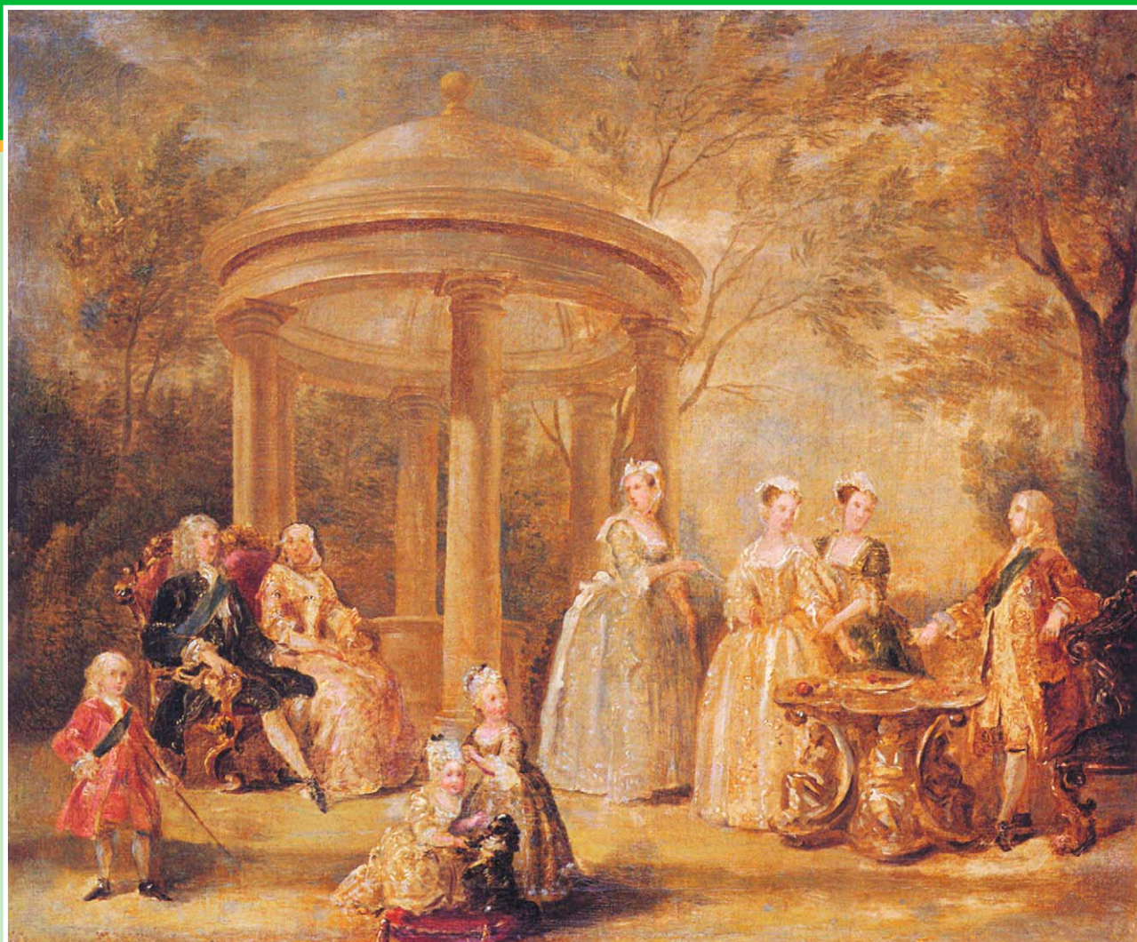
Георг II и его семья. Худ. Уильям Хогарт. Около 1731-1732 гг. Королевское собрание.

же час обедали пажы и фрейлины, в один и тот же час, пересмеиваясь, садились за чайный стол. Вечером у короля бывал трик-трак или концерт; а пажы до смерти зевали в передней вале; или король с семейством прогуливался пешком по Виндзорским холмам, всякий раз держа за руку свою любимицу принцессу Амелию; вокруг собирались дружелюбные толпы, и итонские мальчишки просовывали из-под локтей гуляющих свои румяные рожицы; а по окончании концерта король никогда не упускал случая снять с головы свою огромную треуголку и обратиться к оркестрантам со словами: «Благодарю вас, джентльмены!». Собственно, именно такими и запечатлели Георга III и его семью