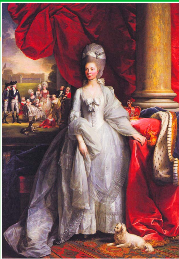
Портрет королевы Шарлотты. Худ. Бенджамин Уэст. 1779 г. Королевское собрание.

Три самые младшие дочери Георга III. Худ. Джон Синглтон Копли. 1785 г. ➔ Королевское собрание.