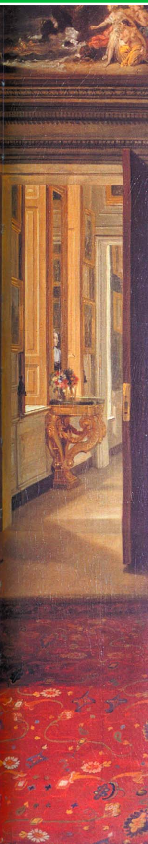
Портрет королевы Шарлотты и двух ее старших сыновей. Худ. Иоганн Цоффани. Около 1765 г. Королевское собрание.

Как писал остроумный Теккерей: «Дом короля Георга был типичным домом английского джентльмена. Там рано ложились и вставали, обращались друг с другом приветливо, занимались благотворительностью, жили скромно и упрямодично и так, должно быть, скучно, что просто страшно подумать. Не удивительно, что все принцессы сбежали из этого уныло-добродетельного домашнего лона. Там вставали, ездили кататься, садились обедать в строго установленные часы. И так – день за днем, всегда одно и то же. В один и тот же час каждый вечер король целовал нежные щеки своих дочерей; принцессы целовали ручку маменьке; и мадам Тильке подавала королю стаканчик на сон грядущий. В один и тот