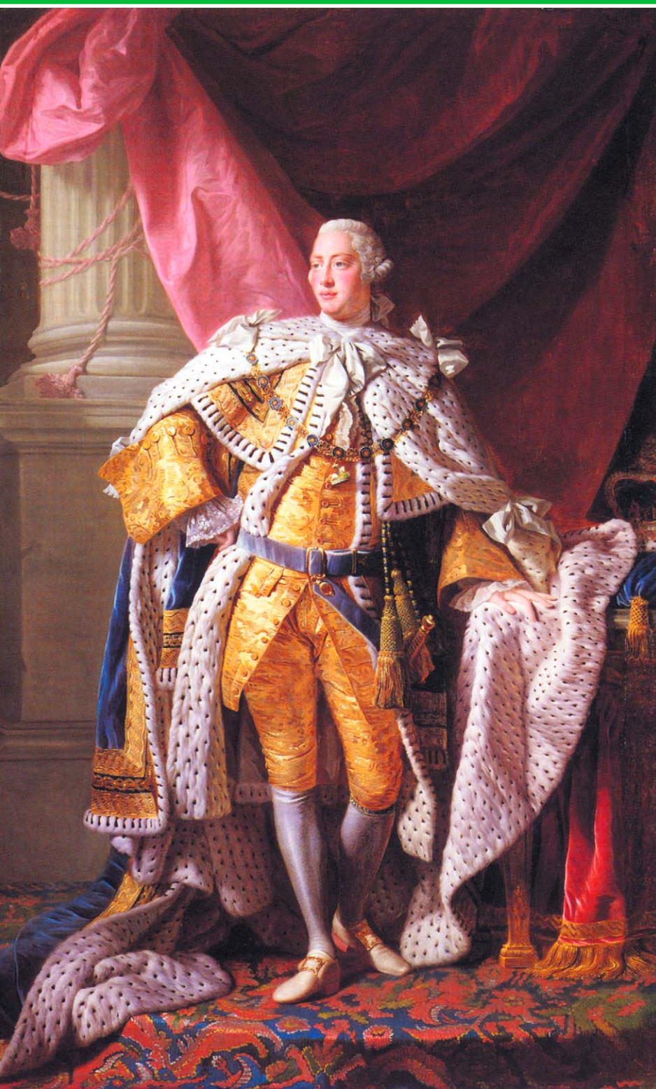
Портрет Георга III. Худ. Алан Рамзи. Около 1761-1762 гг. Королевское собрание.