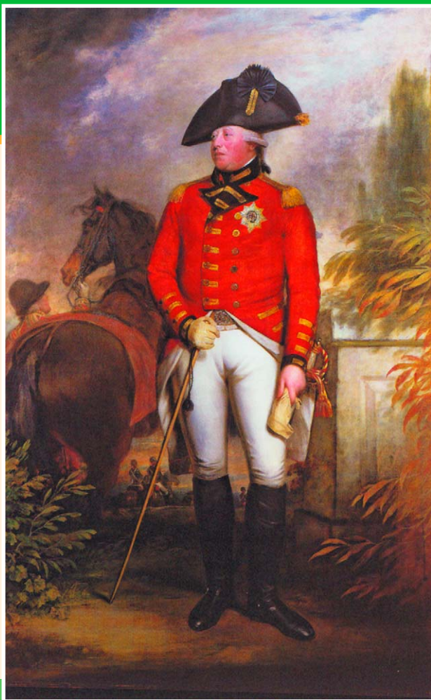
Портрет Георга III. Худ. Уильям Бичи. 1796 г. Королевское собрание.

попросила любимого парикмахера Сонарди красиво уложить волосы. Прекрасно понимая, что волосы — одно из ее главных достоинств, она умело этим пользовалась. Интересно, что впоследствии многие аристократки, позировавшие Лоуренсу, просили сделать им прически «в стиле Сонарди», т.е. как у королевы на портрете.