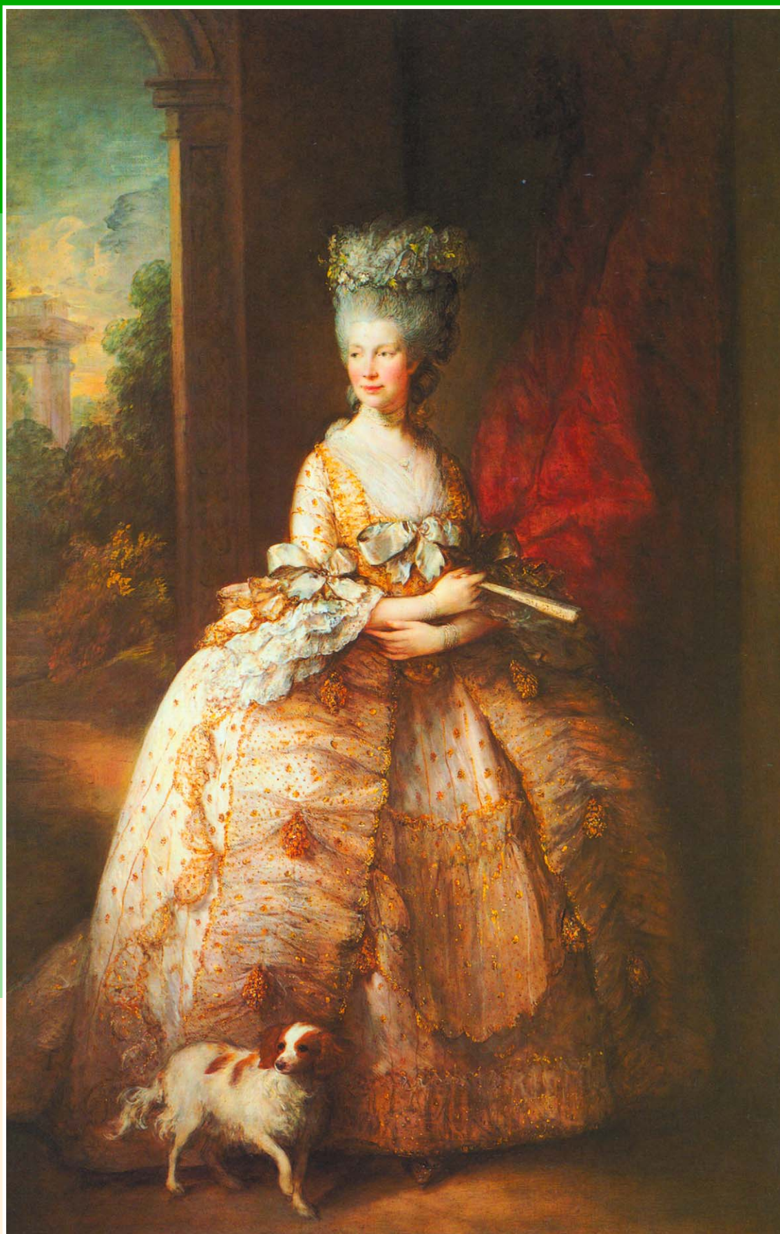
Портрет королевы Шарлотты. Худ. Томас Гейнсборо. 1781 г. Королевское собрание.