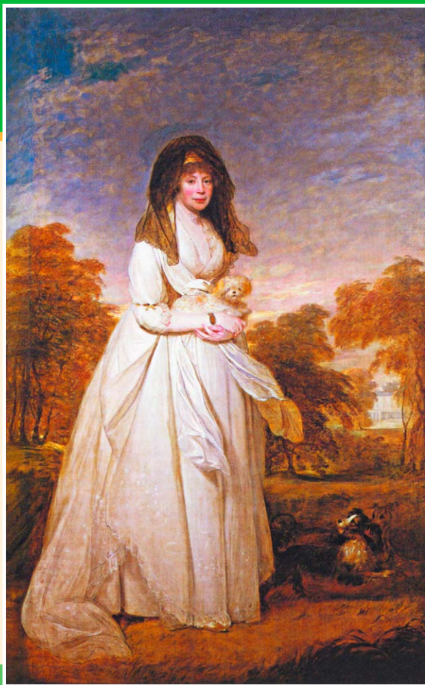
Портрет королевы Шарлотты. Худ. Уильям Бичи. 1796 г. Королевское собрание.