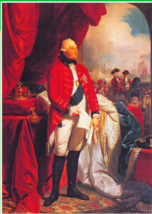
Портрет Георга III. Худ. Бенджамин Уэст. 1779 г. Королевское собрание.