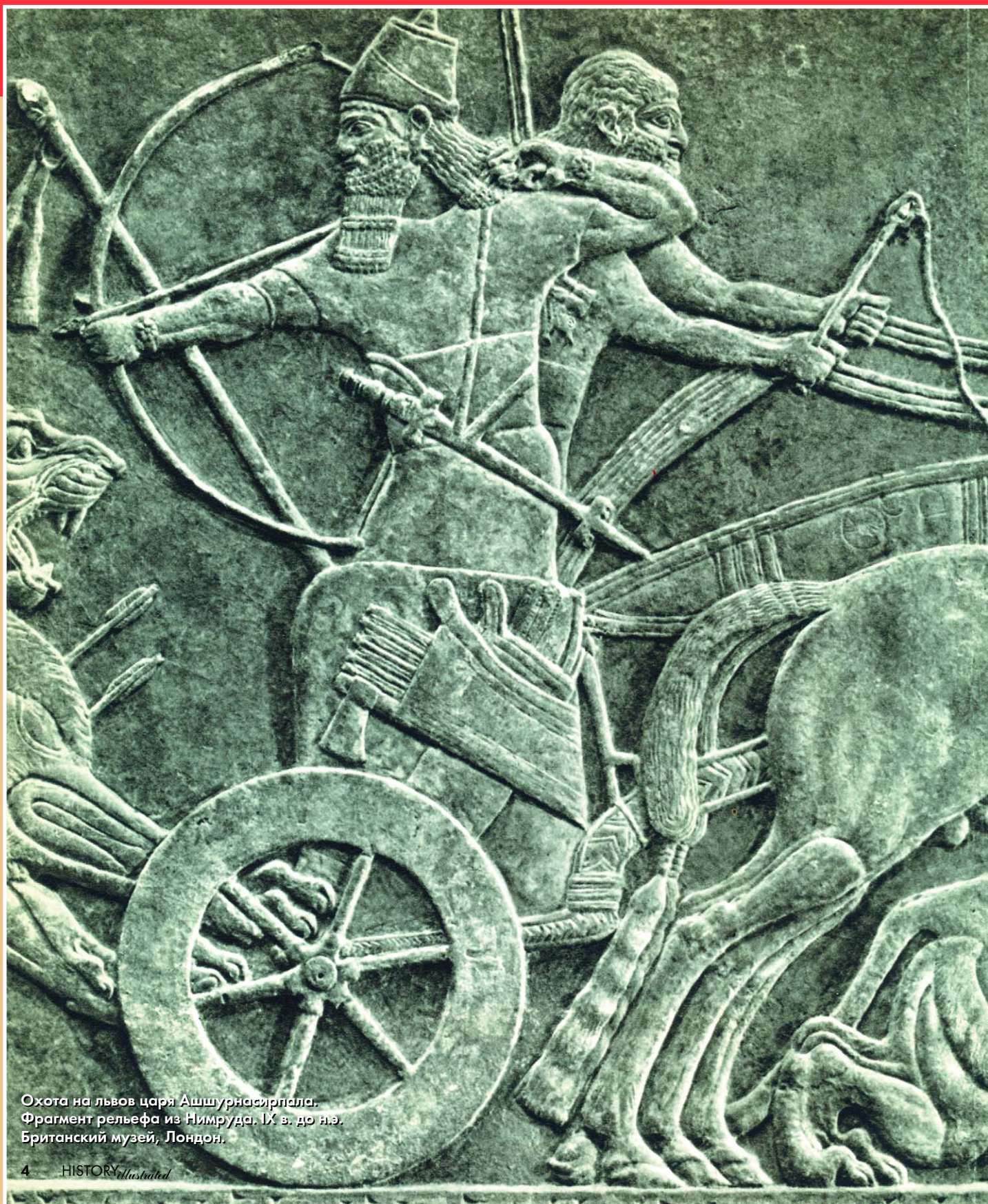
Охота на львов царя Ашурнасирапала. Фрагмент рельефа из Нимруда. IX в. до н.э. Британский музей, Лондон.