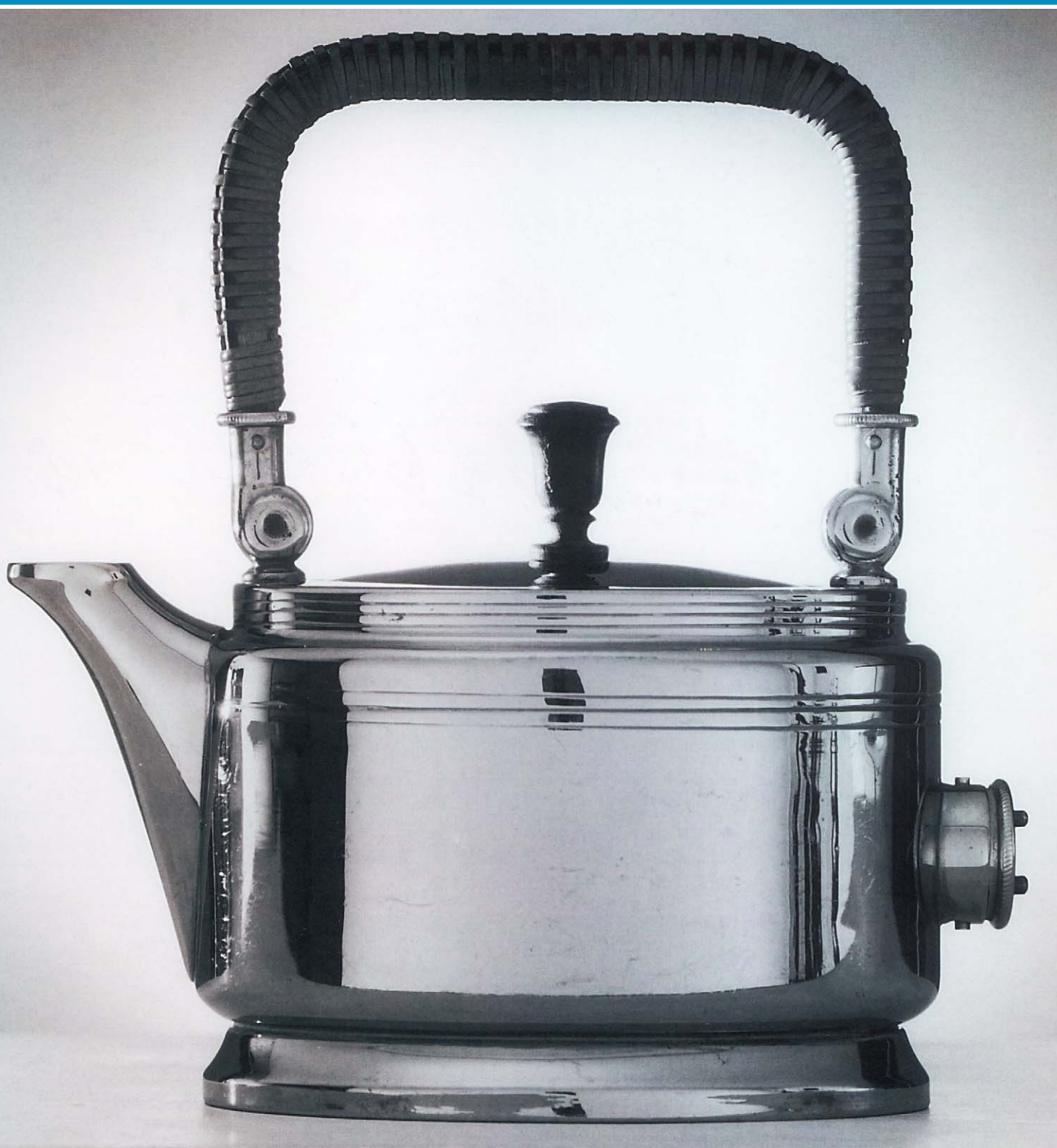
Электрический чайник Петера Беренса. Модель 1910 г.