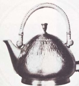
Kupfer streifenartig gehämmert runde Form