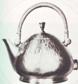
Messing vernickelt, streifenartig gehämmert runde Form