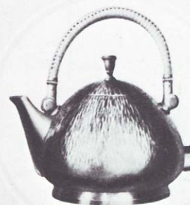
Messing streifenartig gehämmert runde Form