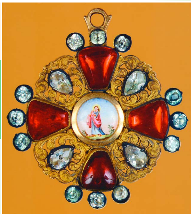
Знак ордена Св. Анны 1-й степени. Россия. Первая четверть XIX в. Золото, серебро, эмаль, стразы, стекло; штамповка, гравировка, горячая эмаль, роспись по эмали, монтаж. 6,5x6,5 см. Государственный Исторический музей, Москва.

Кавалерский орден Св. Анны учредил 14 февраля 1735 года герцог Карл-Фридрих Шлезвиг-Голштинский в память своей супруги Анны Петровны, дочери Петра Великого. Для орденского девиза была заимствована надпись от первоначальных букв ее имени – А.П.Р.Ф. (т.е. Анна, Императора Петра Дочь), что расшифровывается как Amantibus Justitiam, Pietatem, Fidem («Любящим Правду, Благочестие, Верность»). В России орден был введен их сыном – великим князем Петром Федоровичем (будущим императором Петром III), а затем перешел по наследству к его сыну – Павлу Петровичу. 5 апреля 1797 года Павел I причислил орден Св. Анны к российским государственным орденам и разделил его на три степени. В Отечественную войну 1812 года орденом Св. Анны 1-й степени было награждено 225 человек.