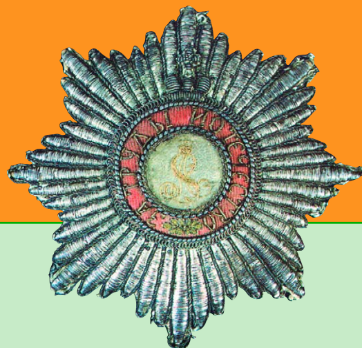
Звезда ордена Св. Александра Невского. Россия. 1780-е гг. Серебряная фольга, серебряная канитель, лайка. Частное собрание.