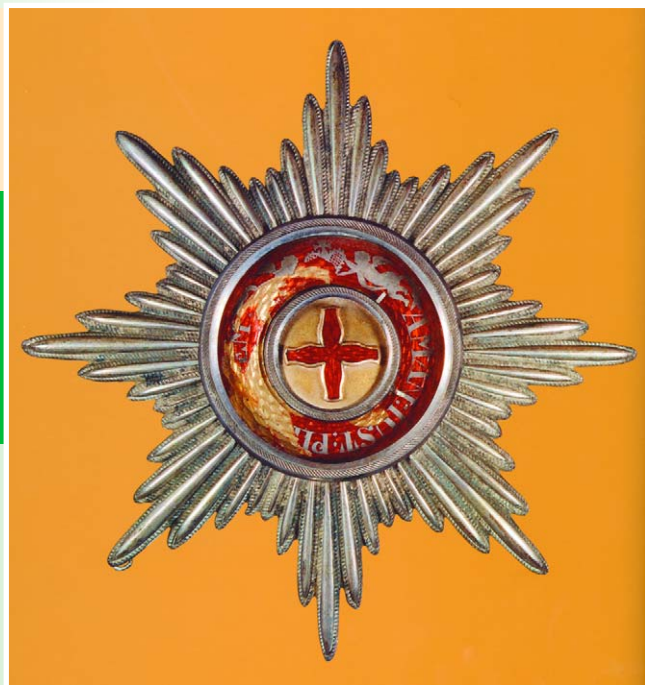
Звезда ордена Св. Анны 1-й степени. Россия. Начало XIX в. Золото, серебро, эмаль; чеканка, горячая эмаль, роспись по эмали, монтаж. 8,3x8,3 см. Государственный Исторический музей, Москва.

ной речью, в которой он призывал их «пожертвовать всем, что имеет, даже самим собою, для спасения государства, для сохранения славы и независимости народа». Отдельные слова Ришелье адресовал к гражда-