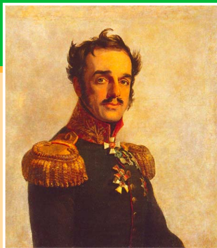
Портрет И.О. Витта. Худ. Дж. Доу. 1825 г. Государственный Эрмитаж, Санкт-Петербург.

Иван Осипович Витт (1781-1840 гг.), граф, генерал-майор. Сын Софьи Глявоне (в первом браке Витт, во втором – Потоцкой), известной шпионки и авантюристки греческого происхождения, и польско-украинского помещика Иосифа де Витта. Участвовал в кампании 1805 г., недолго служил во французской армии, сражавшейся против Австрии в 1809 г. В 1812 г. сформировал на Украине четыре казачьих регулярных полка, которыми и командовал в составе 3-й Западной армии. В 1813 г. сражался при Калише (награжден орденом Св. Георгия III степени), под Люценом, Бауценом, Кацбахом (награжден орденом Св. Анны I степени), Лейтцигом. В 1814 г. сражался при Лаоне и Краоне, во время движения союзных войск к Парижу был отряжен с отрядом (6 полков) для усмирения «бунтующих французских крестьян» и защиты коммуникаций с Фландрией. Был в сражении под стенами Парижа. В 1818 г. – начальник военных поселений на юге России. Принимал участие в Русско-турецкой войне 1828-1829 гг. и подавлении Польского восстания в 1830-1831 гг.