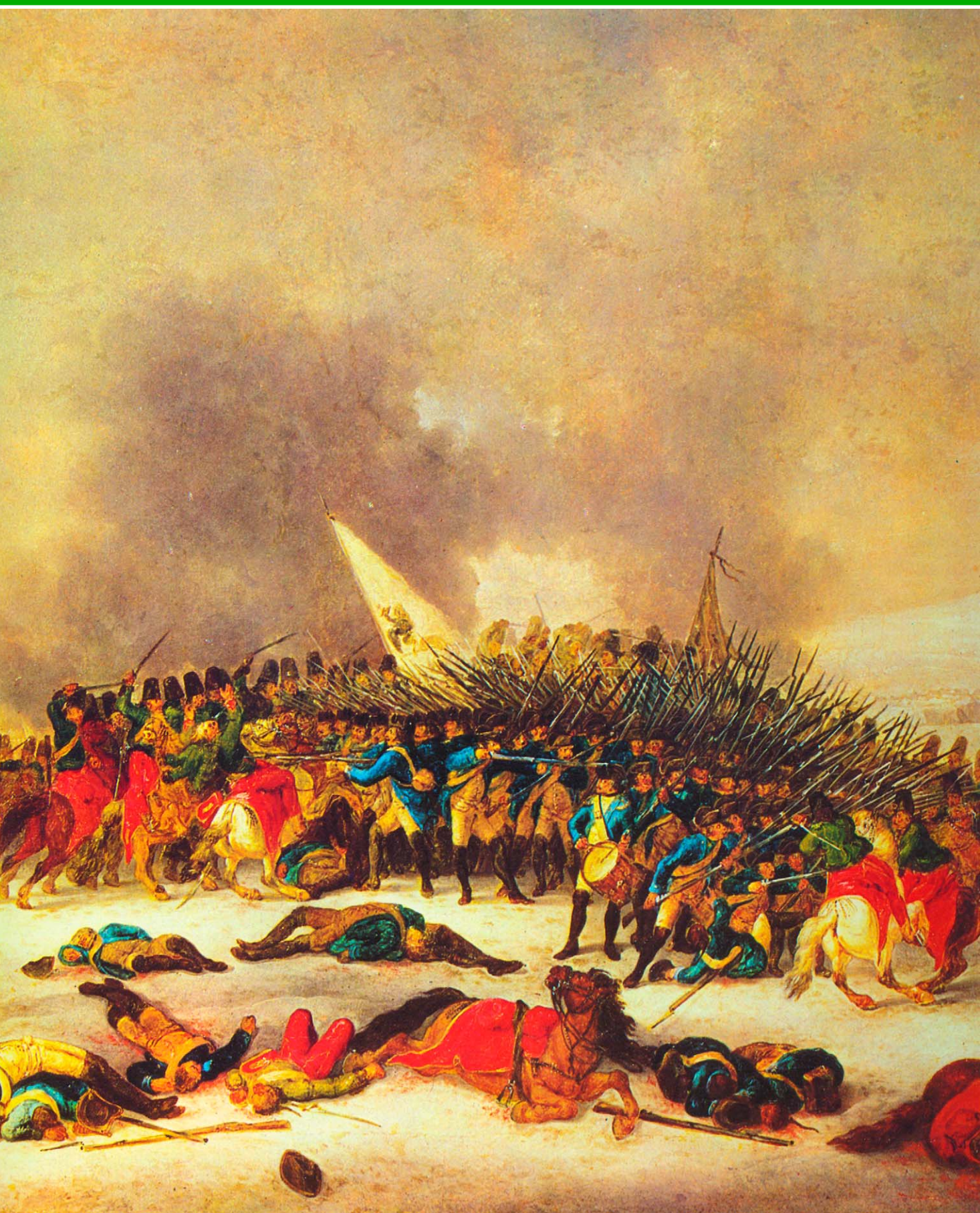
Битва под Лейпцигом. Фрагмент. Худ. Фридрих Хох.