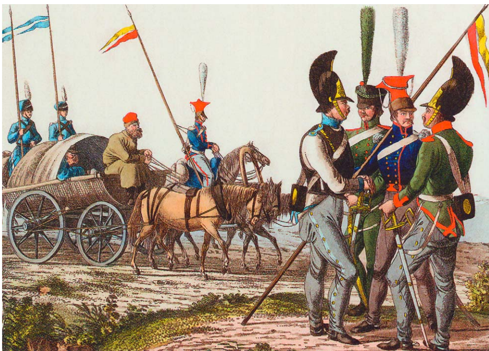
Русская кавалерия. Худ. Ф. Адам. 1813 г. Музей-панорама «Бородинская битва», Москва.

На патриотические призывы властей охотно откликнулись представители разных национальностей: греки, армяне, караимы, татары. При этом самые большие взносы были сделаны греческой диаспорой Одессы, собравшей в общей сложности 100 тыс. рублей. Приведем полностью информацию о сборе пожертвований среди населения Одессы, содержащуюся в сочинении «жителя Одессы», известного дореволюционного историка Аполлона Скальковского, «Первое тридцатилетие истории города Одессы 1793-1823»: