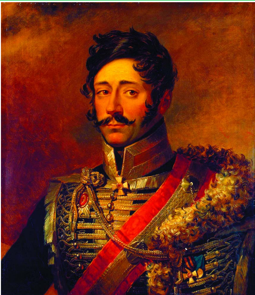
Портрет А.П. Мелиссино. Худ. Дж. Доу. 1825 г. Государственный Эрмитаж, Санкт-Петербург.

Алексей Петрович Мелиссино (1759-1813 гг.), генерал-майор. Из греков, осевших в России в начале XVIII в. Дед Мелиссино был медиком при Петре I, отец служил в русской армии. Участник Русско-турецкой войны 1787-1791 гг. и штурма Измаила (1790 г.) С 1797 по 1800 гг. в отставке. Затем служил в Елисаветградском гусарском полку, был шефом Мариупольского гусарского полка. С 1802 по 1807 гг. — снова в отставке. В 1807 г. назначен шефом Лубенского гусарского полка. В 1812 г. командовал кавалерийской бригадой в армии Торماسова. Полк Мелиссино сражался в составе различных авангардов и арьергардов, участвовал в заграничных походах. Мелиссино сражался в боях под Варшавой, Вальгеймом, Герсдорфом, Носсеном, Бишофсвердом, Бауценем, Рейхенбахом, Яуером. Во время сражения за Дрезден (1813 г.) вместе со своими гусарами атаковал каре французской гвардейской пехоты, но был убит тремя пулями.