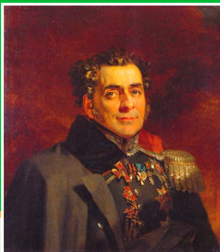
Портрет Д.Д. Куруты. Худ. Дж. Доу. 1825 г. Государственный Эрмитаж, Санкт-Петербург.

Дмитрий Дмитриевич Курута (1769-1833 гг.), генерал-майор. Грек, на русской службе с 1787 г. участник кампаний 1805 и 1806-1807 гг. В 1812 г. обер-квартирмейстер гвардейского корпуса. Участник заграничных походов 1813-1814 гг. Граф Российской империи (с 1826 г.). Принимал участие в подавлении Польского восстания 1830-1831 гг.