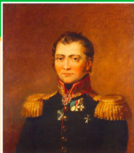
Портрет С.Х. Ставраков. Худ. Дж. Доу. 1827 г. Государственный Эрмитаж, Санкт-Петербург.

Семен Христофорович Ставраков (1763/64-1819 гг.), генерал-майор. Из греков, осевших в России. В 1794 г. в штабе Суворова, сначала ординарцем, затем адъютантом. Участник Итальянского и Швейцарского походов Суворова (1799 г.), кампаний 1805 и 1806-1807 гг. Русско-шведской войны 1808-1809 гг. В 1811 г. участвовал в сражении под Рущуком. В 1812 г. сражался при Бородине, Тарутине, Малоярославце, исполнял обязанности коменданта Главной квартиры. Участвовал в заграничных походах 1813-1814 гг. В 1816-1819 гг. инспектор военных госпиталей.