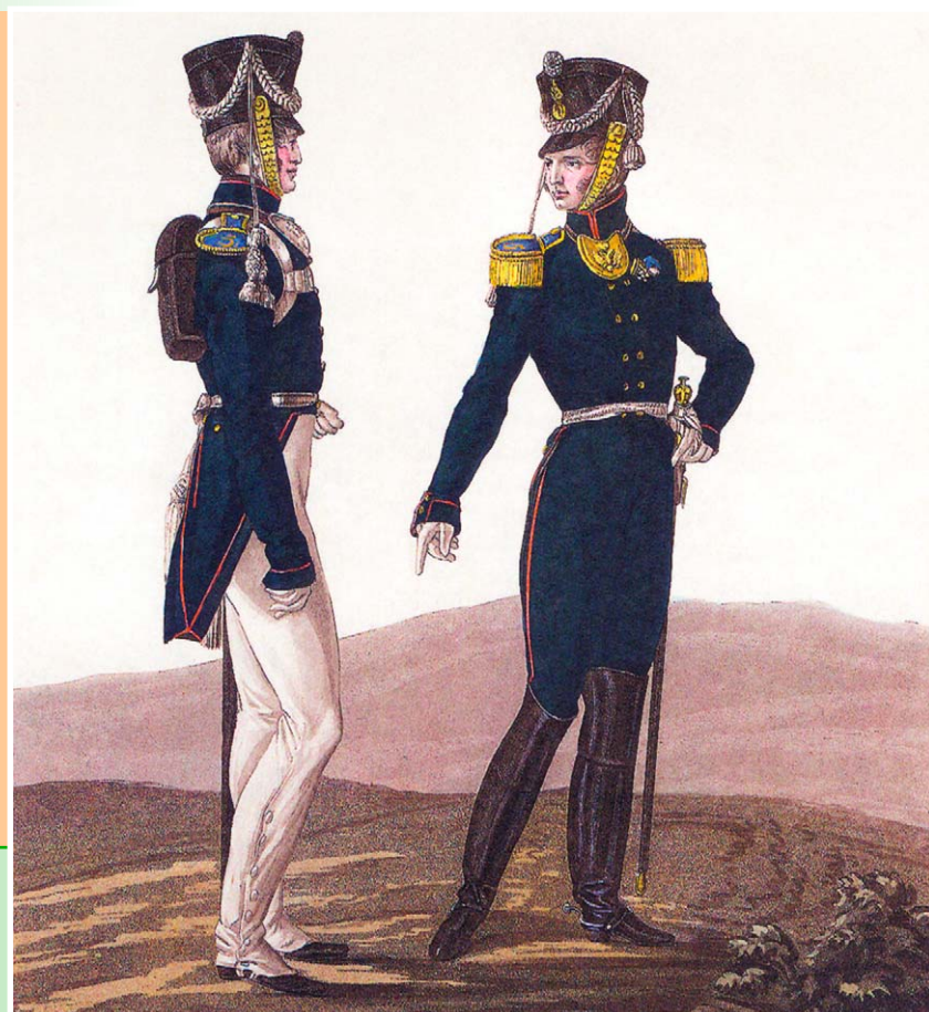
Штаб-офицер и обер-офицер егерских полков. Худ. Л.И. Киль. 1816 г. Цветная литография. Музей-панорама «Бородинская битва», Москва.

На дипломатическом «фронте» интересы России в ту пору успешно отстаивал будущий первый президент независимой Греции граф Иоаннис (Иоанн) Каподистрия. В начале мая 1812 г. он получил повеление немедленно отправиться в Бухарест в распоряжение главнокомандующего Молдавской (позднее Дунайской) армией адмирала П.В. Чичагова. По прибытии возглавил дипломатическую канцелярию адмирала. Вместе с армией Каподистрия проделал путь от Дуная до Березины, а в 1813 г. состоял при главнокомандующем 3-й Западной армии М. Б. Барклае де Толли, затем в Главной императорской квартире, заведовал канцелярией. В ноябре 1813 г. под видом путешественника Каподистрия был отправлен в Швейцарию с тайным поручением добиться ее содействия или нейтралитета в предстоящей кампании. Отправляя Иоанна Каподистрию в Швейцарию, где он пробыл около полугода в качестве посланника России, Александр I так охарактеризовал его: «Каподистрия человек весьма достойный по своей честности, мягкости обращения, по своим познаниям и либеральным взглядам. Он родом из Корфу, следовательно, республиканец, и выбор мой остановился на нем именно потому, что мне известны принци-