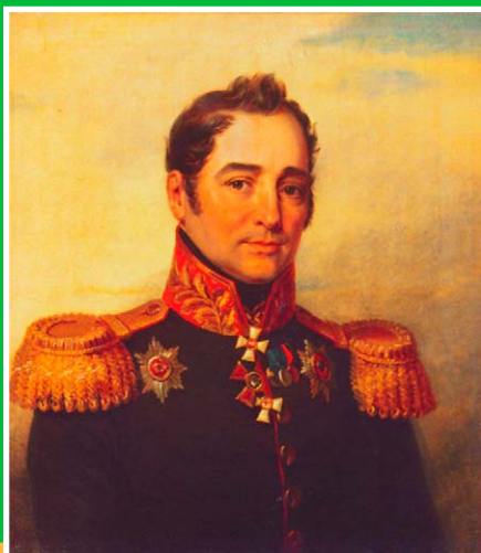
Портрет Е.И. Властова. Худ. Дж. Доу. 1828 г. Государственный Эрмитаж, Санкт-Петербург.

Егор Иванович Властов (1769/70-1837 гг.), генерал-лейтенант. Родился в Константинополе, но рано остался сиротой и был подобран на улице моряками русской архипелагской экспедиции. Образование и воспитание получил в Греческой гимназии (Корпус чужестранных единоверцев) в Санкт-Петербурге. Военную карьеру начал в Эстляндском егерском полку. Принимал участие в войне со шведами и поляками (1792-1794 гг.) Участник кампаний 1805 и 1806-1807, 1808 гг. С 1806 г. командовал 24-м егерским полком, вместе с которым храбро сражался под Прейсиш-Эйлау и Гейльсбергом. В 1812 г. сражался в корпусе ПХ. Витгенштейна, отличился при взятии Полоцка и во время переправы французской армии через Березину. Участник заграничных походов 1813-1814 гг., во время которых командовал егерскими и пехотными полками. Чин генерал-лейтенанта получил за взятие Парижа (1814). С 1822 г. в отставке.