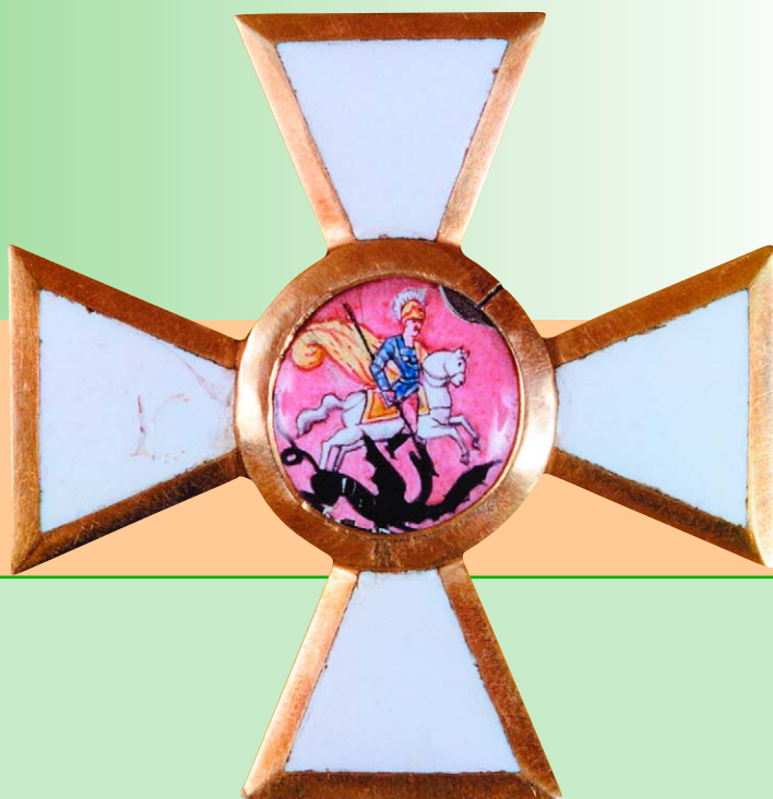
Знак ордена св. Георгия 3-й степени. Россия. Начало XIX в. Золото, эмаль; штамповка, горячая эмаль, роспись по эмали, монтаж. 4,2x4,2 см. Государственный Исторический музей, Москва.

ный «греческий проект», суть которого сводилась к созданию греческой империи на развалинах европейской Турции под скипетром русской короны, привели не только к череде русско-турецких войн, но и переселению на юг России греков, поддерживавших действия русского флота во время Архипелагских экспедиций 3 . Мирный договор с Турцией от 1773 года предусматривал свободную эмиграцию греков в Россию, в том числе и за казенный счет. Особо оговаривалось сохранение полученных чинов и возможность неограниченного продвижения по службе, чем воспользовались представители многих греческих фамилий. Для этих целей императрица Екатерина II в 1775 году при Артиллерийском и Инженерном кадетском корпусе в Санкт-Петербурге учредила Корпус чужестранных