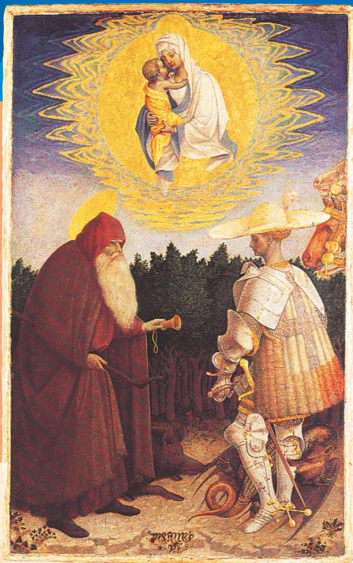
Мадонна с младенцем, Св. Антонием-аббатом и Св. Георгием. Худ. Антонио Пизанелло. Около 1435-1441 гг. Национальная галерея, Лондон.