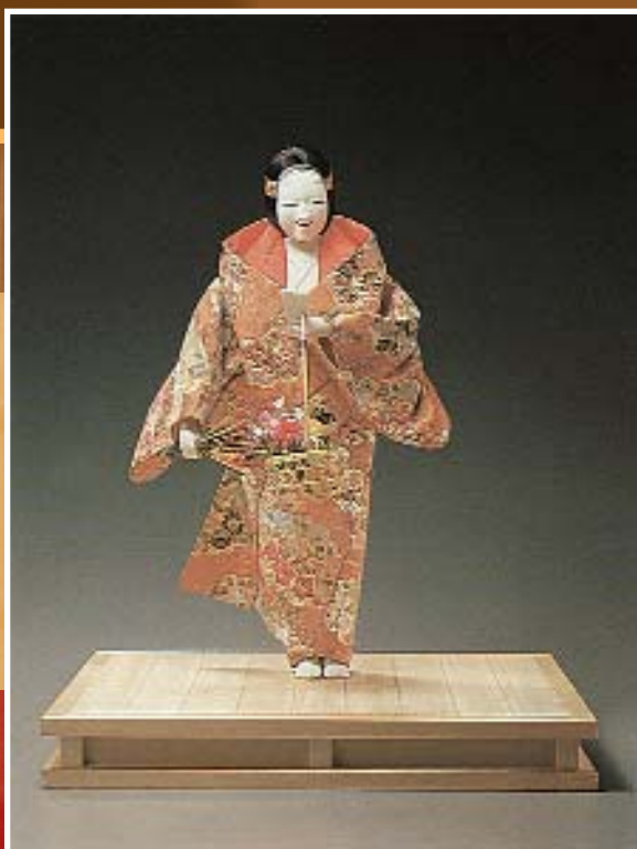
Ханагатами («Корзина с цветами»). Кукла, изображающая персонажа театра Но. Япония, вторая половина XX в.