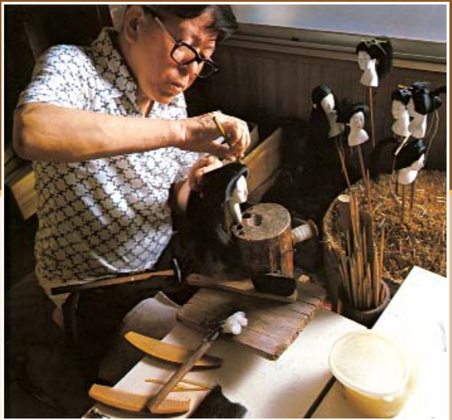
Киотский мастер за изготовлением париков для кукол исё.

Камо-нингё похожи на скульптуры, но все же являются именно куклами, поскольку из-за современной технологии их создания из отдельных частей они также являются прямыми наследниками традиции мокутё-нингё (кукла, вырезанная из дерева), сложившейся в эпоху Эдо.