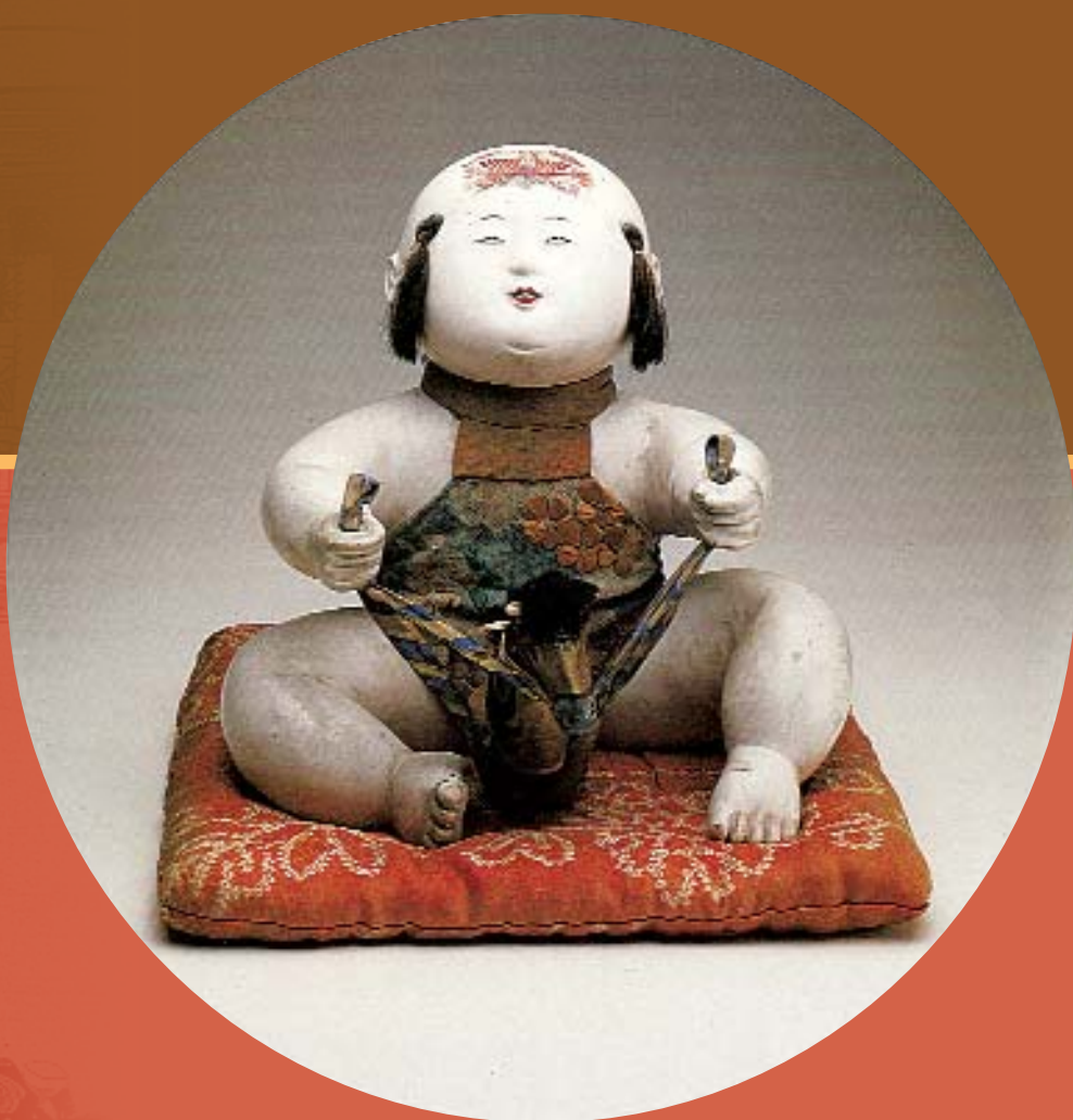
Кукла госё. Тип – мальчик, играющий в лошадки. Япония, начало XIX в. Высота 20 см.

Долгое время одними из главных сувениров, привозимых из Киото, были госё-нингё – фигурки маленьких пухлых младенцев, ныне служащие талисманом перед долгим путешествием, а первоначально, как и большинство древних кукол, использовавшиеся в качестве талисманов и вотивных фигурок, связанных с беременностью и ро-