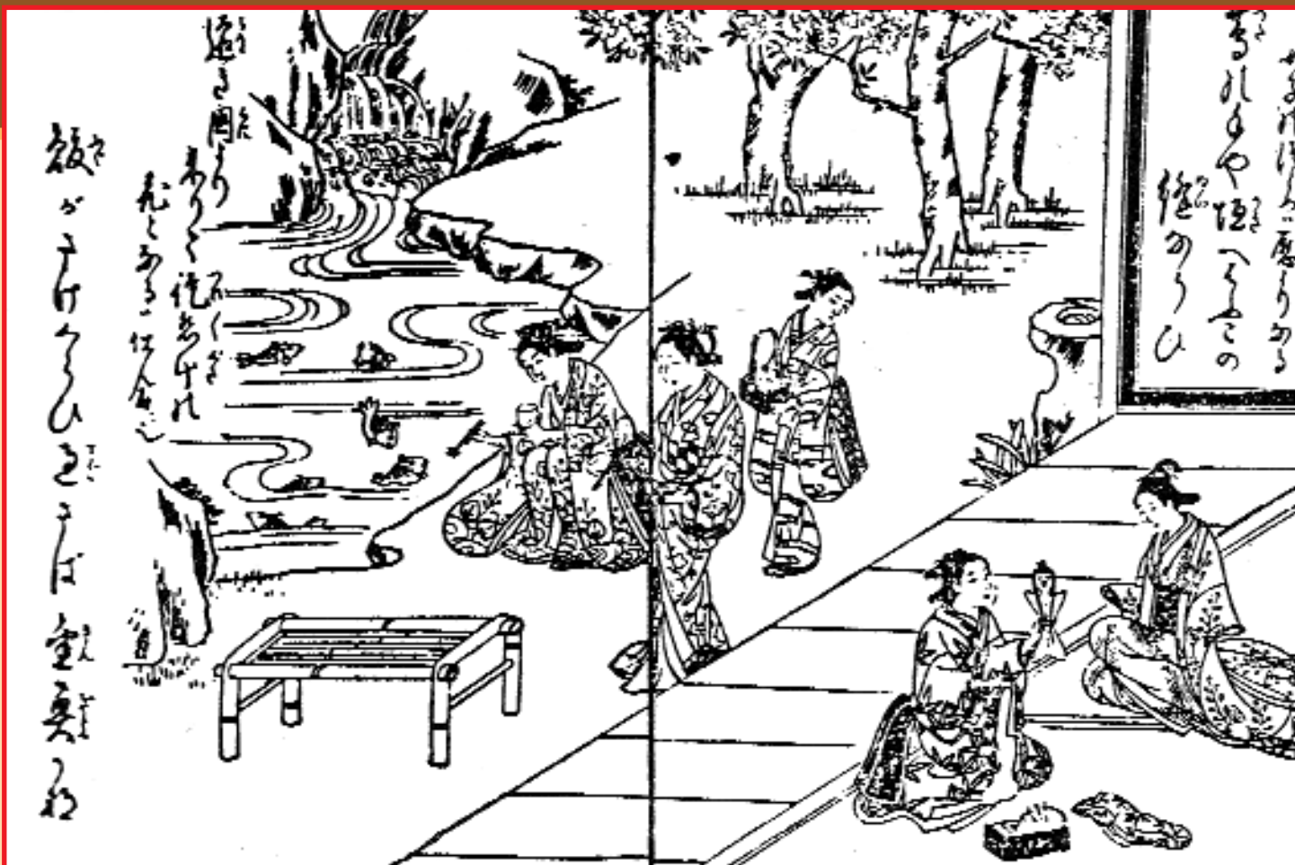
Девушки за различными занятиями. Японская гравюра по рисунку Хасэгава Мицунобу. Конец эпохи Эдо.

Две сидящие справа девушки заняты изготовлением куклы хоко.