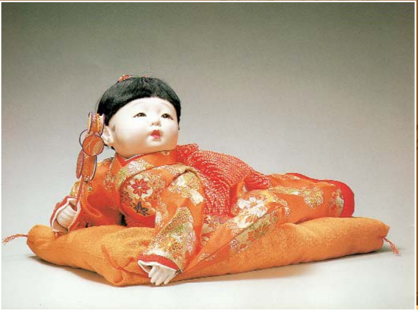
← Кукла итимацу, изображающая маленького мальчика. Япония, конец XIX в. Высота 71 см.