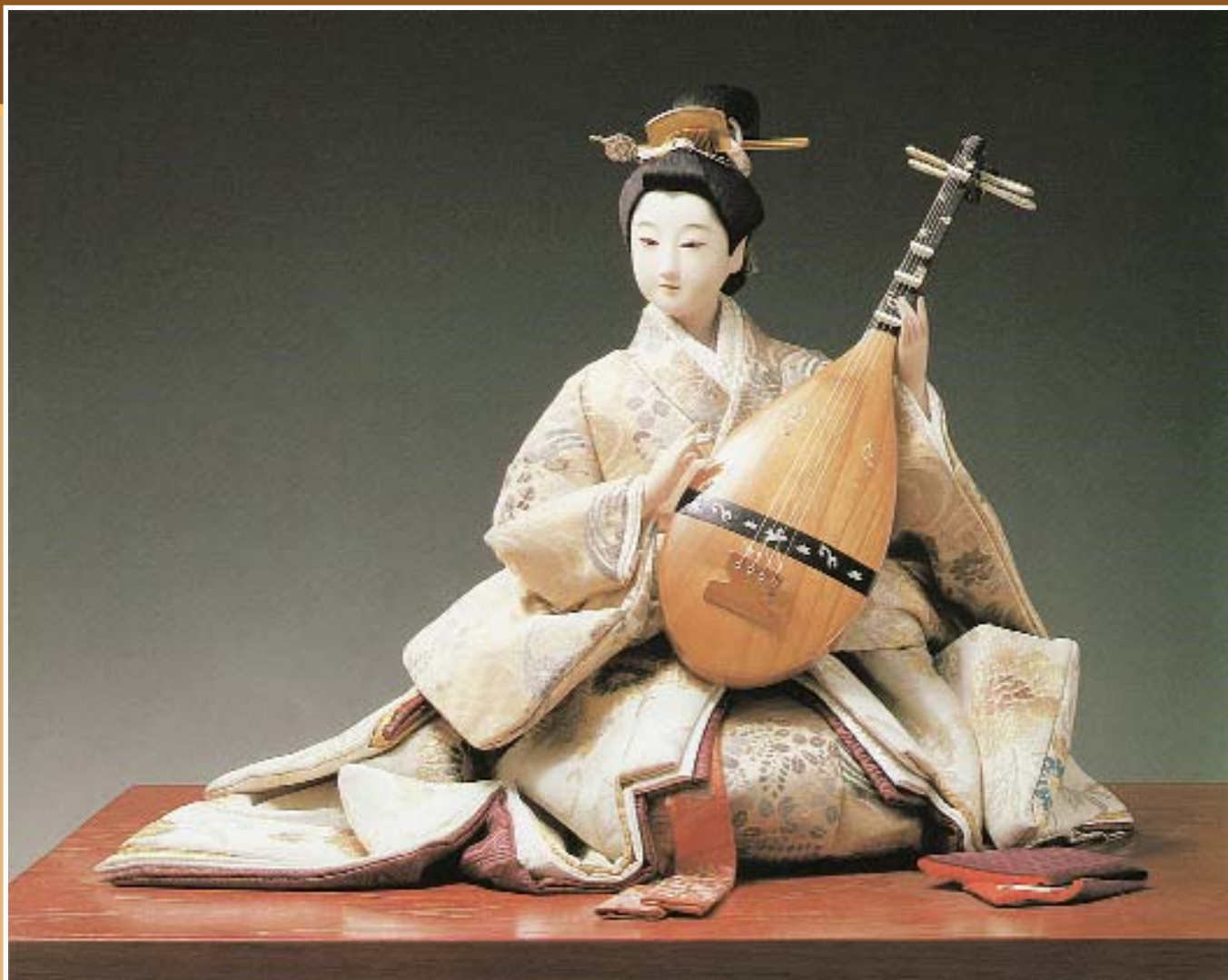
Ин («Ритм»). Кукла типа дзидай-фудзоку. Япония, вторая половина XX в.

Кукла изображает красавицу-принцессу, перебирающую струны лютни бива.