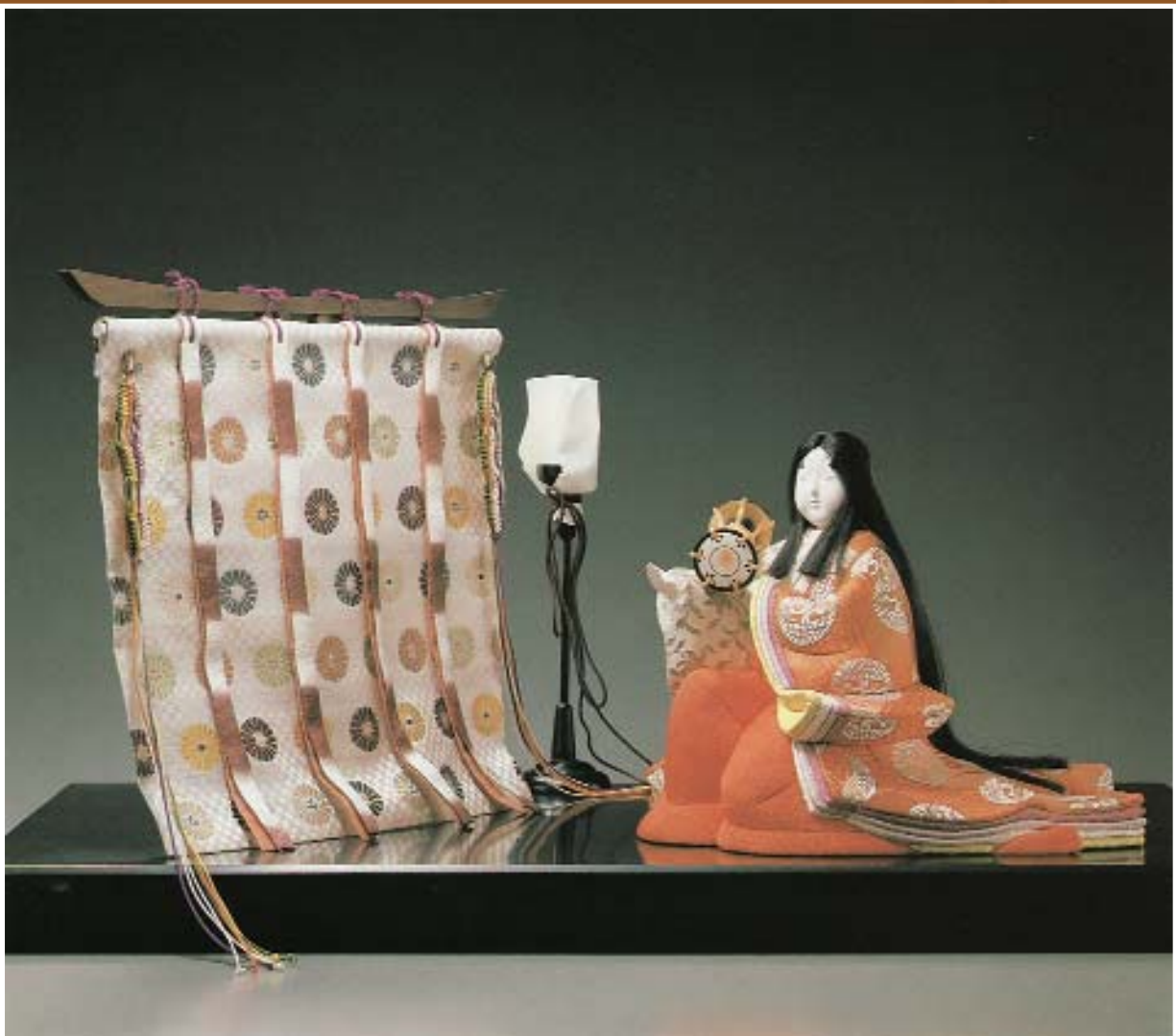
Хару но ёй («Весенний вечер»). Кукла камо. Япония, вторая половина XX в.

Кукла изображает принцессу, которая тихим весенним вечером забавляется игрой на ручном барабане.