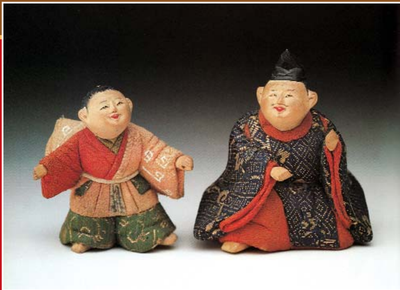
Две куклы камо. Слева – танцующий мальчик, справа – музыкант (инструмент утрачен). Возможно, они были частью квинтета из набора кукол хина. Япония, XVIII в.