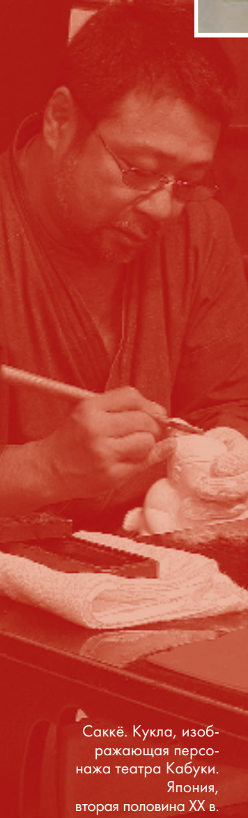
Саккё. Кукла, изображающая персонажа театра Кабуки. Япония, вторая половина XX в.

пичным, и только высокохудожественные образцы были полностью деревянными. Лицо и руки покрывали пастой гофун из порошка перламутра или белилами, затем полировали и раскрашивали кистью. Волосы были выложены тонкими шелковыми нитями. Чтобы одеть куклу в кимоно, шелк или парчу кроили на части и склеивали таким образом, чтобы ткань ложилась естественно, свободными складками.