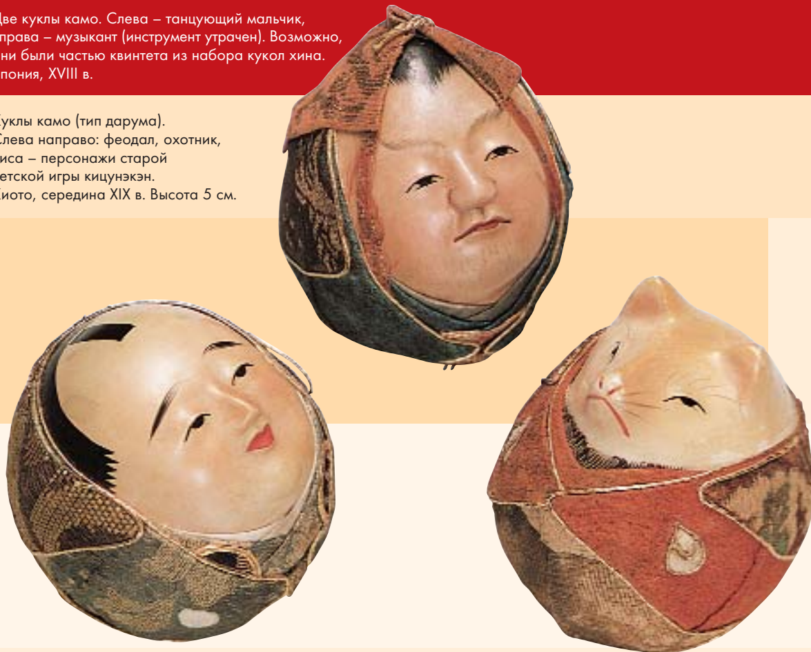
Куклы камо (тип дарума). Слева направо: феодал, охотник, лиса – персонажи старой детской игры кичунэкэн. Киото, середина XIX в. Высота 5 см.