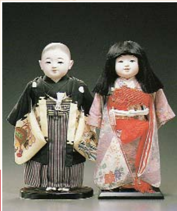
Парные куклы типа итимацу. Япония, вторая половина XX в.

стала следующим шагом в развитии японского кукольного производства. Самые старые куклы итимацу часто называют мицу-орэ шингё (куклы «тройного сочленения»), так как они имели подвижные ноги, сгибающиеся на шарнирах в лодыжках, коленях и бедрах. Головы кукол часто были набиты опилками, части тела изготавливались из дерева или папье-маше. Некоторые куклы сгибались в области талии или имели мягкий живот, при нажатии на который издавали звуки, напоминающие плач. Таким образом, куклы итимацу по своим конструктивным особенностям напоминали современные им европейские образцы.