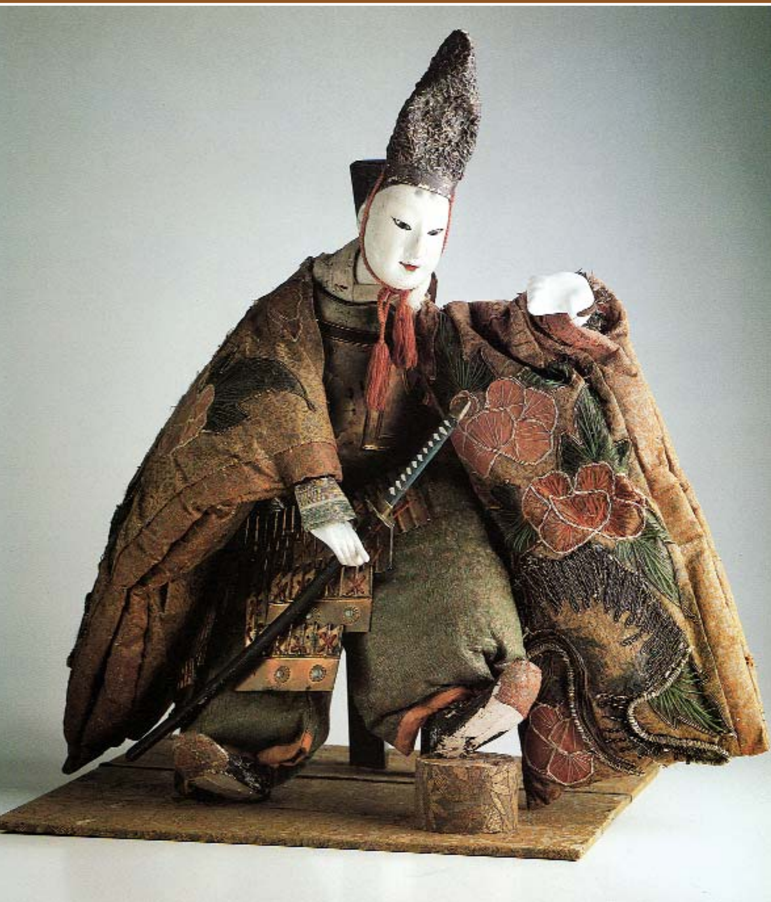
Кукла такеда, возможно, изображающая знаменитого полководца Такэда Сингэна. Япония, около 1800 г. Высота 51 см.

Выбор персонажа для куклы Такэда необычен, к тому же кукла необычно большая по размеру. Голова и руки вытолнены из дерева, а тело – из соломы.