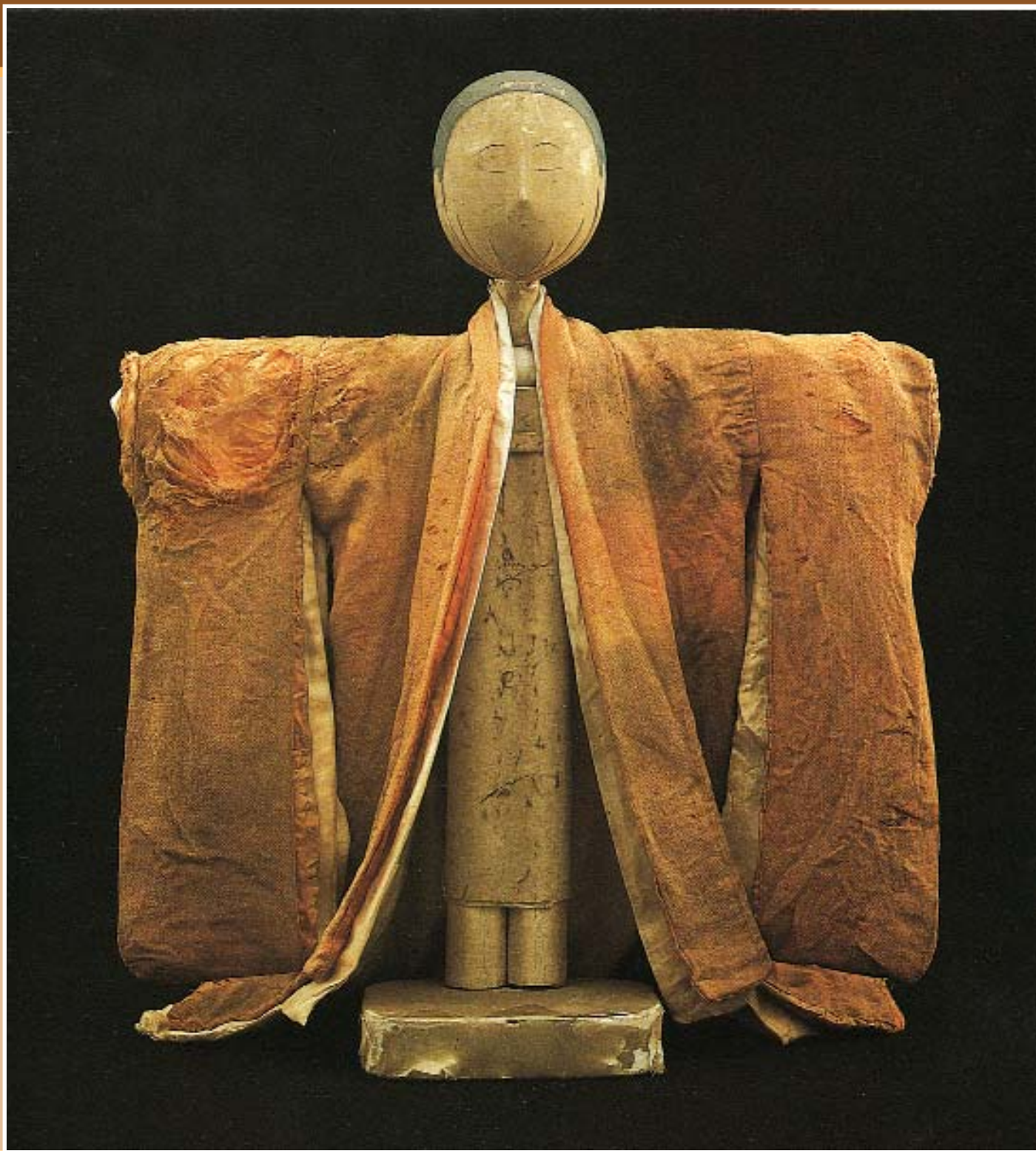
Кукла амагацу. Япония, XVII в. Бамбук, шелк. Высота 60 см.

Эта большая кукла амагацу из бамбука имеет типичную конструкцию в форме буквы «Т». Голова куклы обтянута тонким шелком, глаза, брови и рот обозначены схематично тонкими линиями. Из того же шелка сделаны кимоно, нижнее из которых – традиционно белое. Свидетельством votивного назначения фигурки является молитва – изящные иероглифы на основе куклы.