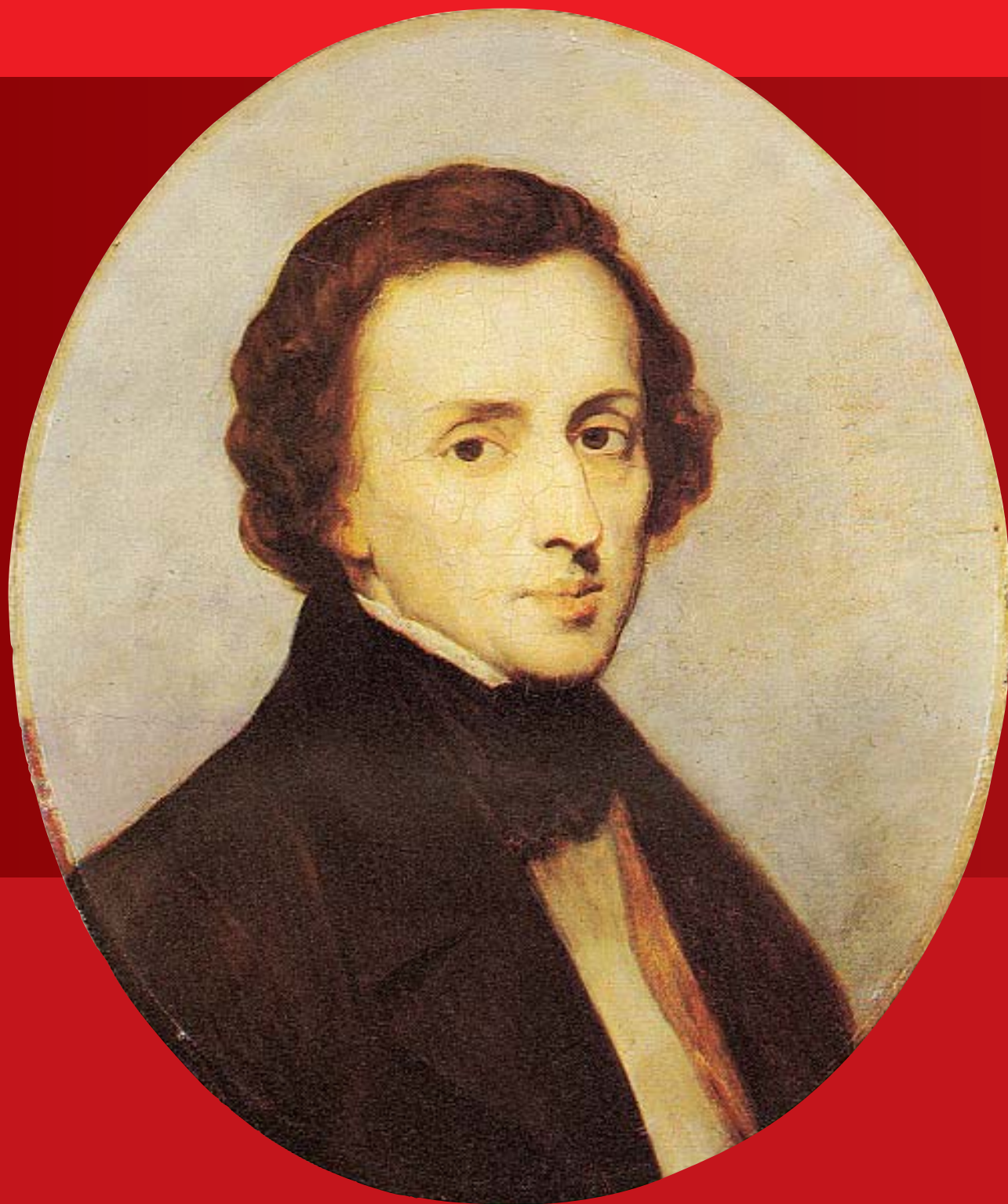
Портрет Фредерика Шопена. Худ. Анри Шеффер. 1847 г.