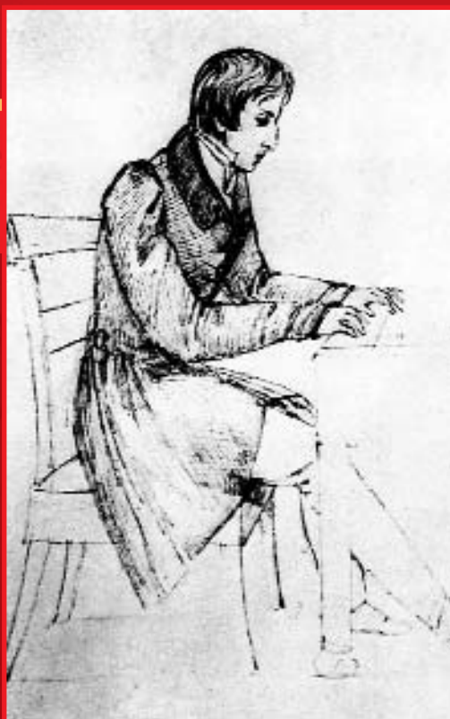
Шопен за пианино. Рисунок Элизы Радзивилл. 1826 г.

Этюд для фортепиано А-минор, опус 25, ➔ 1832-1834 гг. Автограф Ф. Шопена.