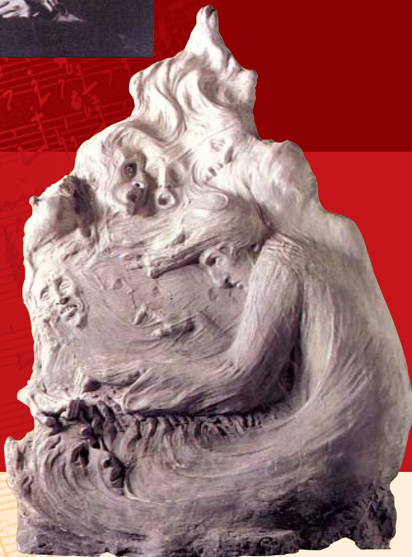
Похоронный марш Шопена. Горельеф. Скульптор Болеслав Бьегась (Бьегальский). 1902 г. Мрамор. Национальный музей, Варшава.

«Мы сомневаемся, что очередной диагноз, который мы добавим к и без того огромному списку [заболеваний композитора] поможет нам понять мир искусства Фредерика Шопена, – говорят исследователи. – Но мы считаем, что знание о том, что у него было это заболевание, поможет отделить романтическую легенду от реальности и пролить новый свет на понимание этого человека и его жизни».