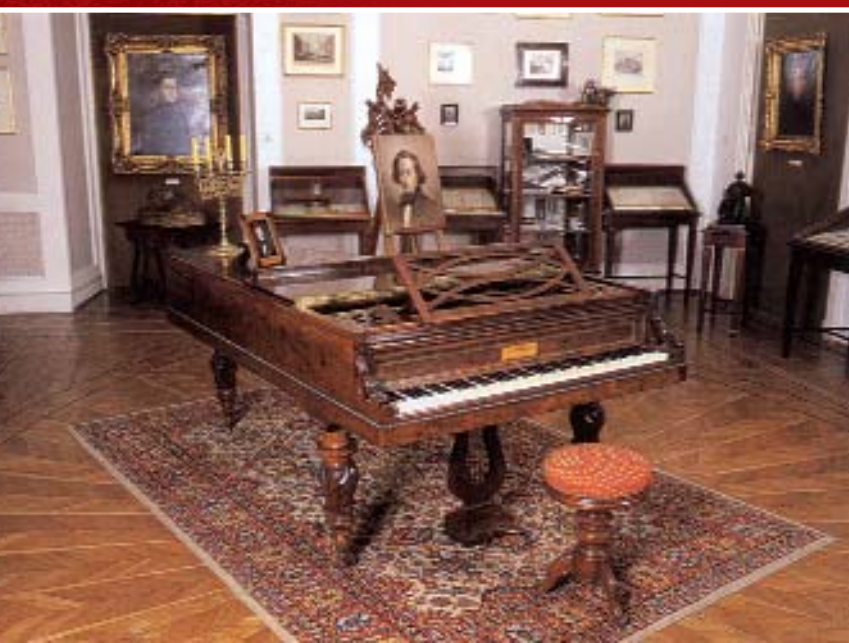
Последний рояль Шопена фирмы «Плейель». Музей Шопена, дворец Осторожских, Варшава.

Правда, врачи признают, что композитор принимал еще и основанные на опиуме смеси, которые помогали ему снимать физические боли. Но они отвергают предполо-