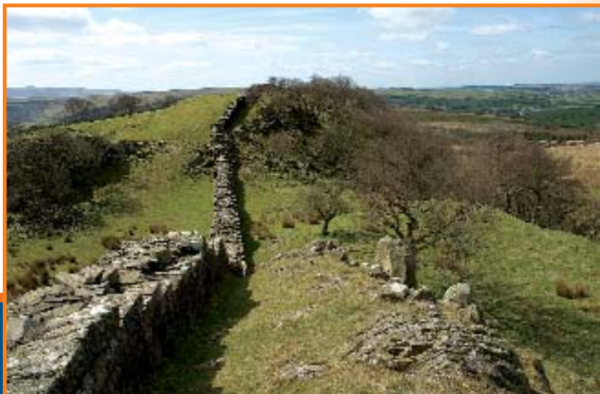
Стена Адриана в районе Уолтаунского утеса. Современный вид.

«Нельзя забывать, что Стена Адриана – не изолированный памятник, а целый исторический комплекс. Люди жили здесь еще до прихода римлян, а после строительства оборонительной линии приспособились к новым условиям. И все это видно на аэрофотоснимках», – подвел итог Маклеод.