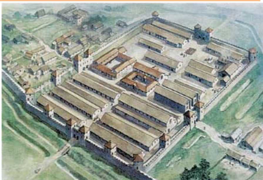
Римский форт Банна (современный Бердсуолд). Реконструкция.

Одна ферма оказалась между стеной и большим земляным укреплением, построенным римлянами. На других снимках видны крупные поселения, расположенные неподалеку от крепостей вдоль стены в таких районах, как Честерс и Хаусстидс. Именно там могло жить гражданское население, которое обслуживало римских легионеров и их командиров.