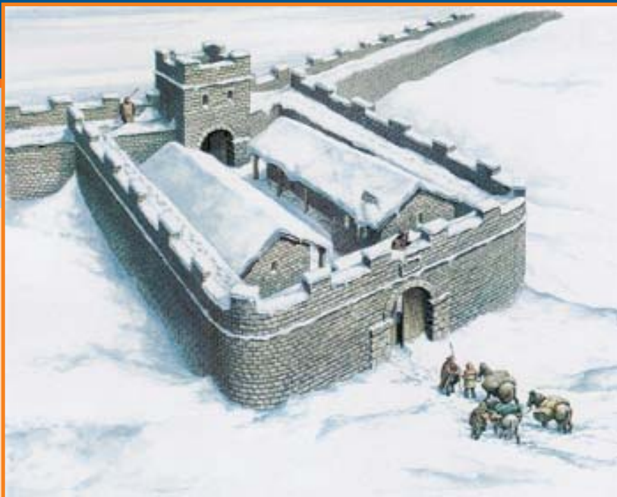
Реконструкция фрагмента стены Адриана в районе Уиншинлдского утёса, самой высокой точки стены.

Стена Адриана → в районе Уолтаунского утёса, графство Нортамберленд. Рисунок-реконструкция Алана Соррелла.