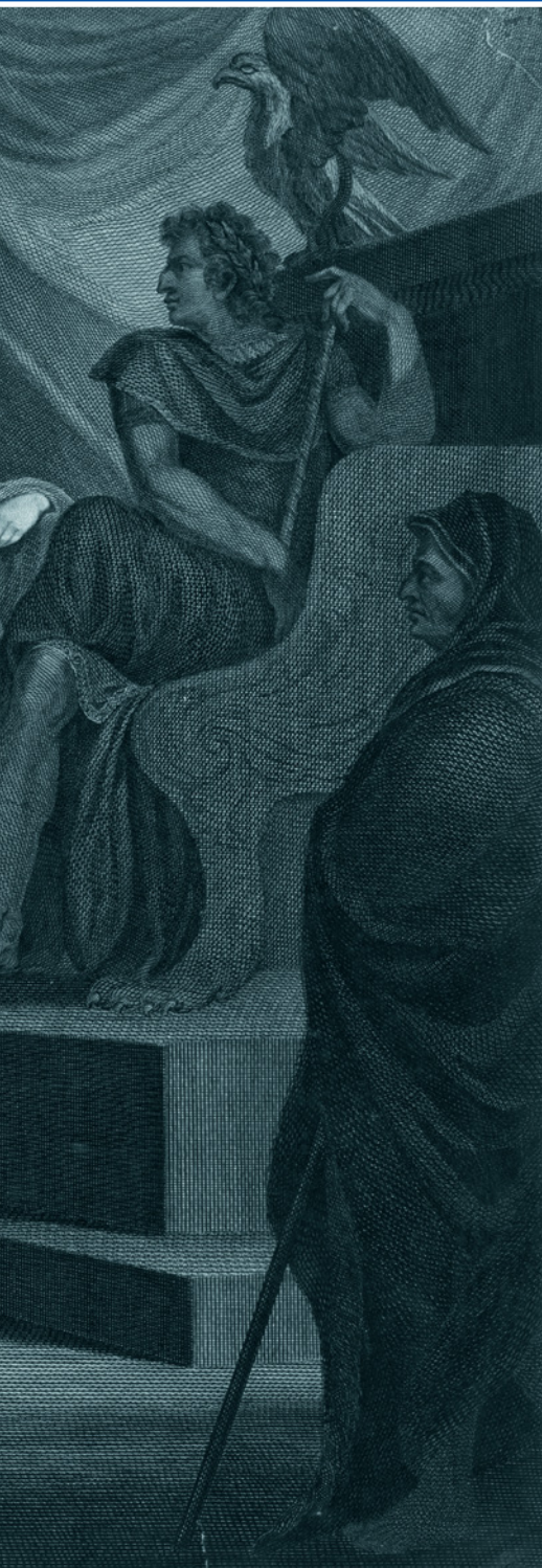
Вождь британских повстанцев Каратак перед судом Клавдия в Риме. Гравюра Эндрю Биррелла по картине Генри Фюзели. 1792 г. Библиотека Конгресса, Вашингтон, США.

Боудикка в центре группы, изображающей кельтского жреца, галла и бритта в античное время. Реконструкция Альберта Кречмера «Галльские и британские костюмы» 1882 г.