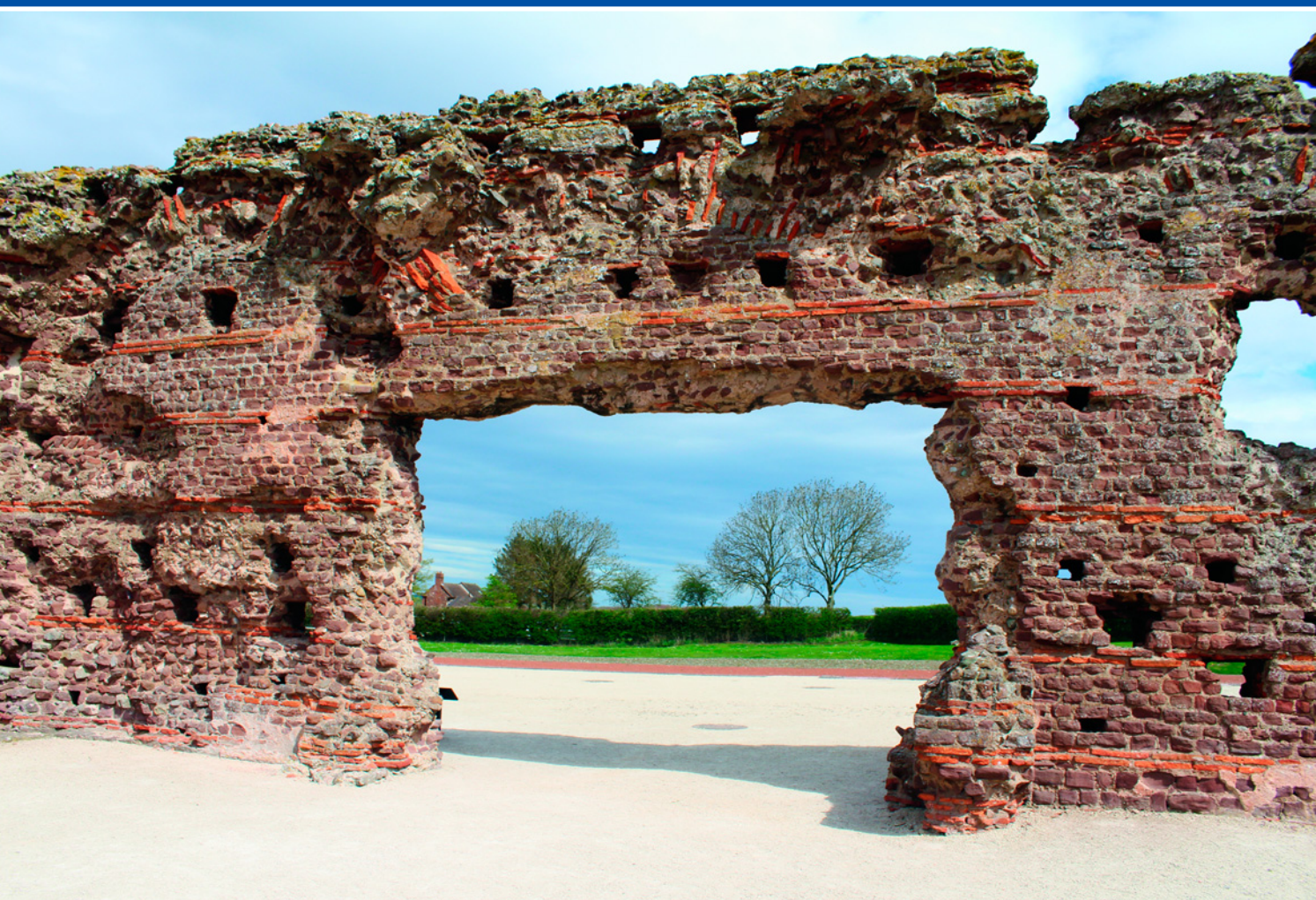
Остатки римской стены в Уэльсе, Британия.

кельтов называющуюся «торквес»), а также плащ, заколотый брошью.