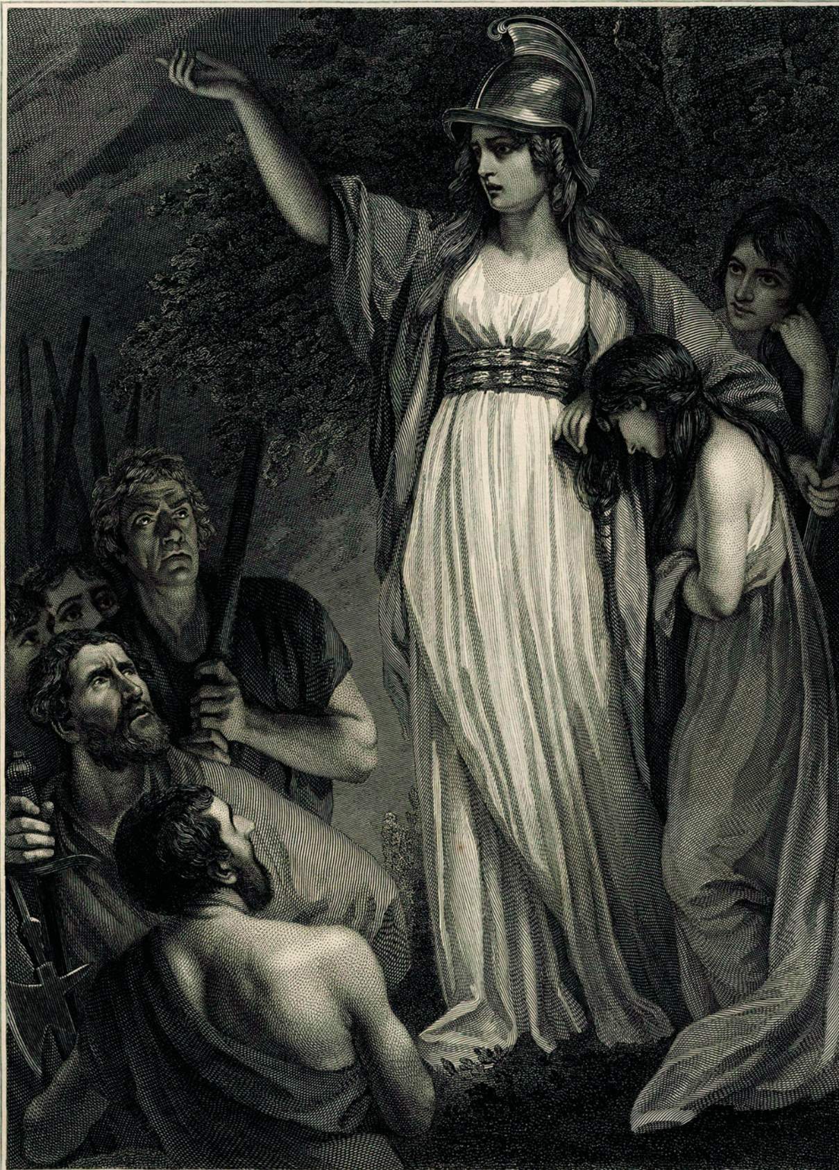
BOADICEA HARANGUING THE BRITONS.