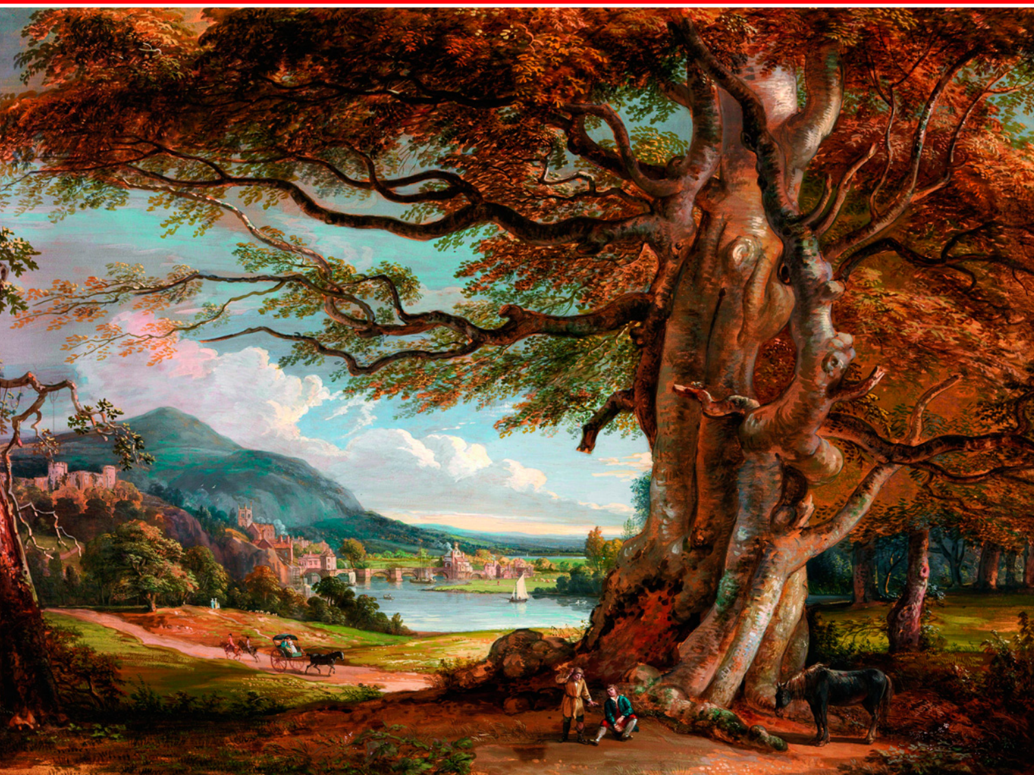
Шропширский пейзаж. Худ. Пол Сэндби. Около 1801 г. Йельский центр британского искусства, Нью-Хейвен, США.

На ипподроме. Худ. Джеймс Поллард. 1834-1835 гг. ➔ Йельский центр британского искусства, Нью-Хейвен, США.