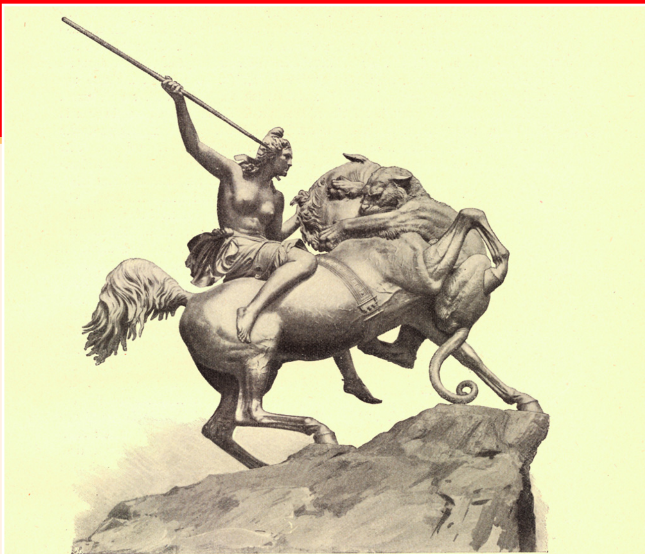
Амазонка сражается с тигром. Бронзовая скульптура. Музей древностей, Берлин, Германия.

с врагом», и становятся сильнее и смелее джигитов. «Девичий остров» недоступен для мужчин: тщетны их попытки проникнуть туда, они с позором изгоняются.