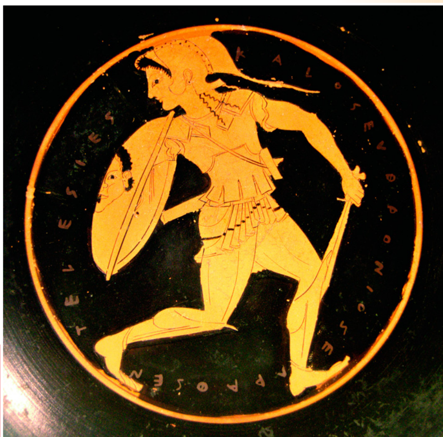
Амазонка. Тондо краснофигурного килика. Около 510 г. до н.э. Государственное античное собрание, Мюнхен, Германия.

недели, в надежде иметь от героя дочь, которая унаследовала бы его необычайную доблесть. В случае же, если родится сын, Фалестрис обещала отослать его к отцу.