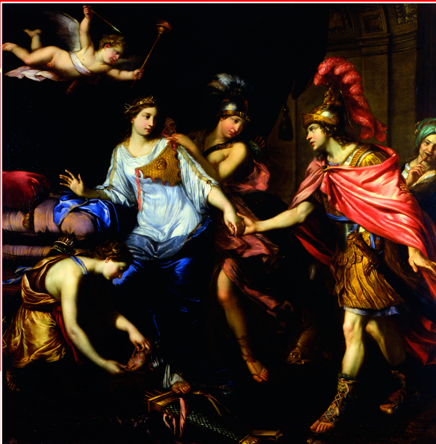
Александр Македонский и королева амазонок. Атрибутировано, как работа Пьера Миньяра. 1660 г. Музей Кальве, Авиньон, Франция.

лом Тиргатао спас широкий кожаный пояс, в гневе она приказала казнить Митродора и подчинила себе всю Синдику – азиатскую часть Боспора. Сатир I умер от горя, а его