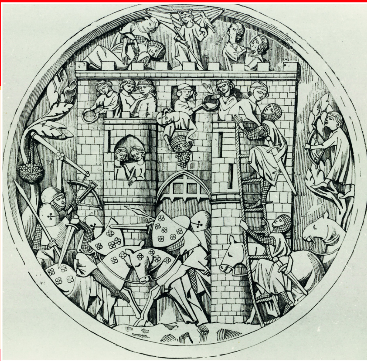
Штурм Замка Дев. Прорисовка резьбы на пластинке слоновой кости VIII в.

устроительницу разумных земледельческих порядков. Гораздо более архаичные черты сохраняла почитаемая в Малой Азии и в Крыму Кибела, владычица гор и лесов. Она появлялась на колеснице, запряженной львами. Богиня в окружении животных – львов, леопардов, оленей, коней, или, как они обычно называются, «прибогов» – всадников – образ общеиндоевропейский и достаточно распространенный. У древних индоиранцев, например, сложился миф о двух сыновьях – прибогах Кибелы, один из которых (одесну) воплощал солярно-огненное начало, день, земной мир и жречество, другой (ошу) – водное, грозное