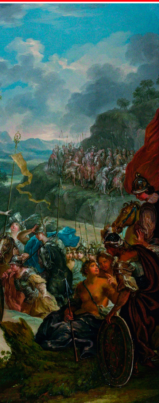
Амазонка Фалестрис в лагере Александра Македонского. Худ. Иоганн Георг Платцер. XVIII в. Частная коллекция.

Древнеримский историк и ритор I в. Квинт Курций рассказал об амазонке Фалестрис, которая посетила Александра Македонского, когда тот был на берегах Каспия, на границе Гиркании. Она пробыла с ним две недели, в надежде иметь от героя дочь, которая унаследовала бы его необычайную доблесть. В случае же, если родится сын, Фалестрис обещала отослать его к отцу.