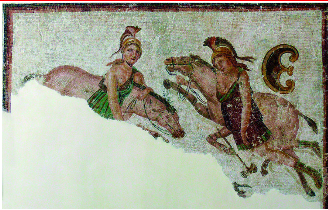
Две амазонки на лошади. Фрагмент мозаики начало III в. Археологический музей, Сусс. Тунис.

и увезли много пленниц на кораблях. В открытом море те взбунтовались и перебили своих стражей. Но, не умея управлять кораблями, вынуждены были предаться на волю волн, и их прибило к скифским берегам Азовского моря. Скифы, увидев амазонок, не