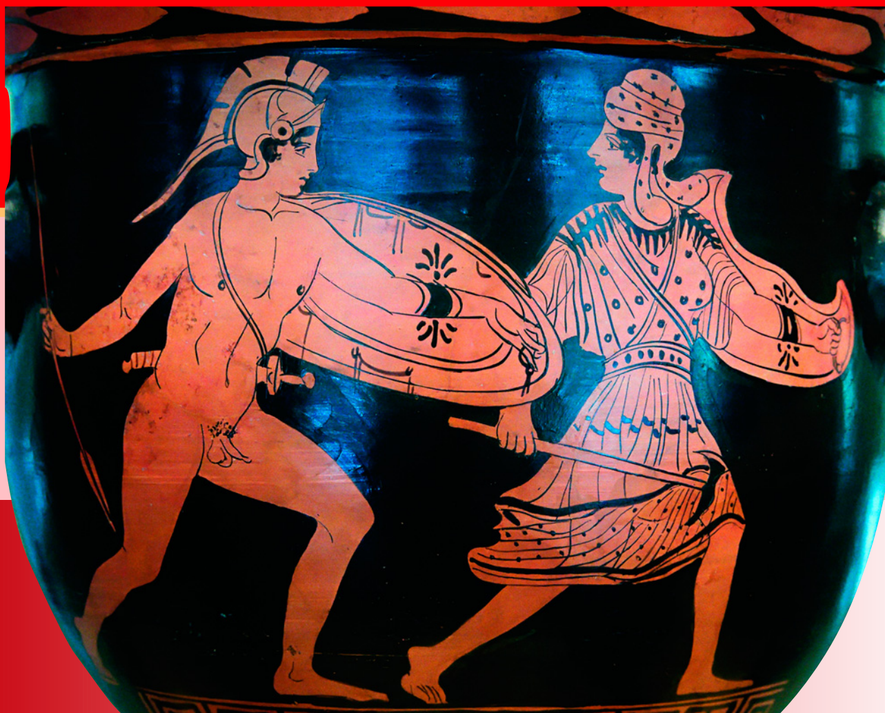
Битва Ахилла и амазонки Пентезилеи. Роспись краснофигурного кратера.