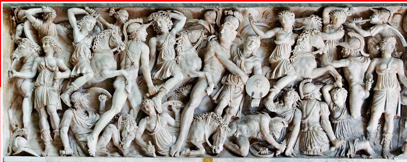
Сцена из троянской войны: борьба греков с амазонками. В центре изображены Ахилл и умирающая Пентезилея. Панель мраморного саркофага, римская работа, III в. Ватиканские музеи, Рим, Италия.

– островерхий скифский башлык с «наушниками». Судя по этим изображениям, а также по находкам в женских погребениях, встречающихся на всей территории причерноморско-приазовской Скифии, в вооружение древних амазонок входили лук, колчан для стрел и боевая секира с характерным – в форме полумесяца – закруглением острия. Такая же форма отличала и их щиты.