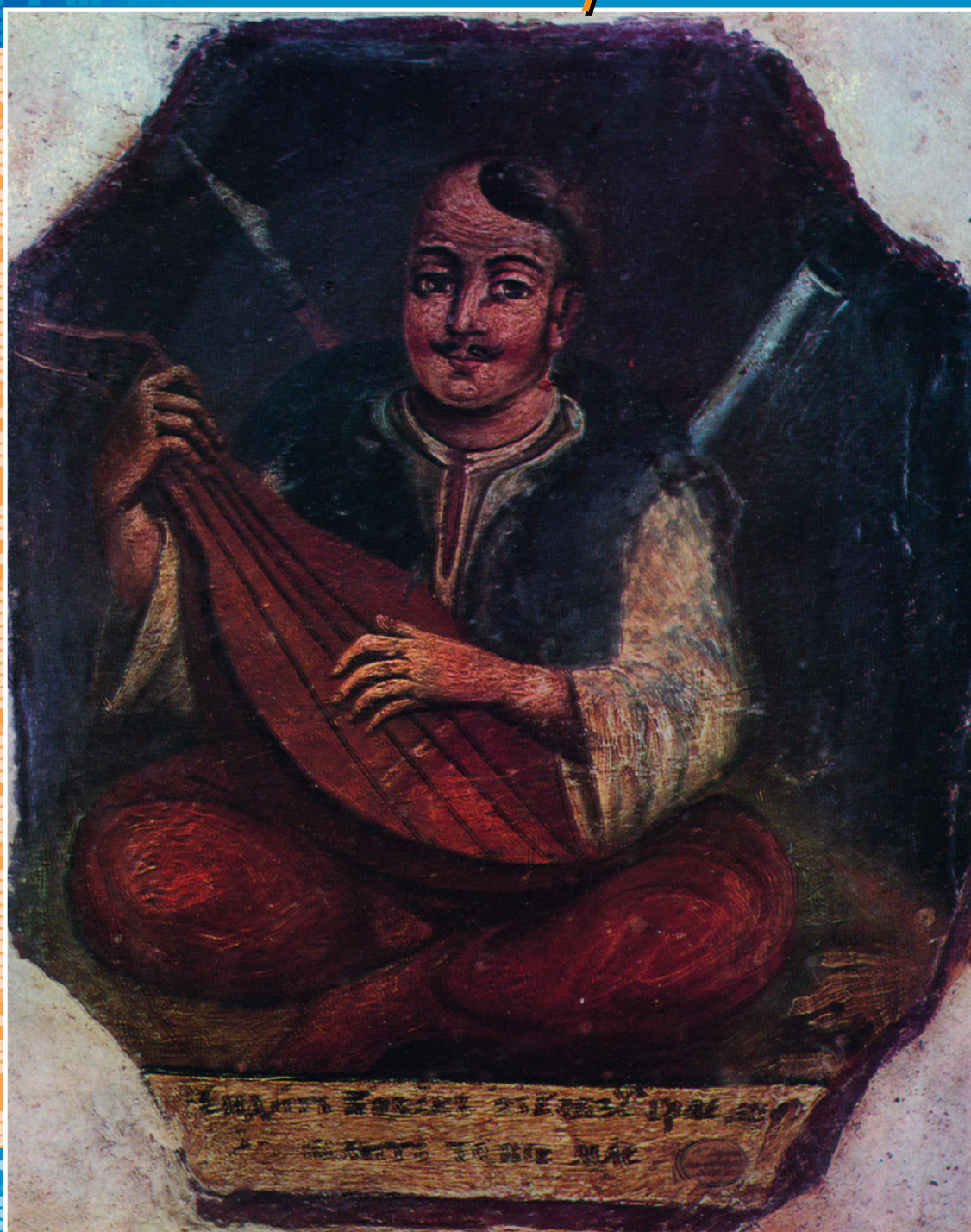
Казак-бандурист. Народная украинская картина. Начало XVIII в.