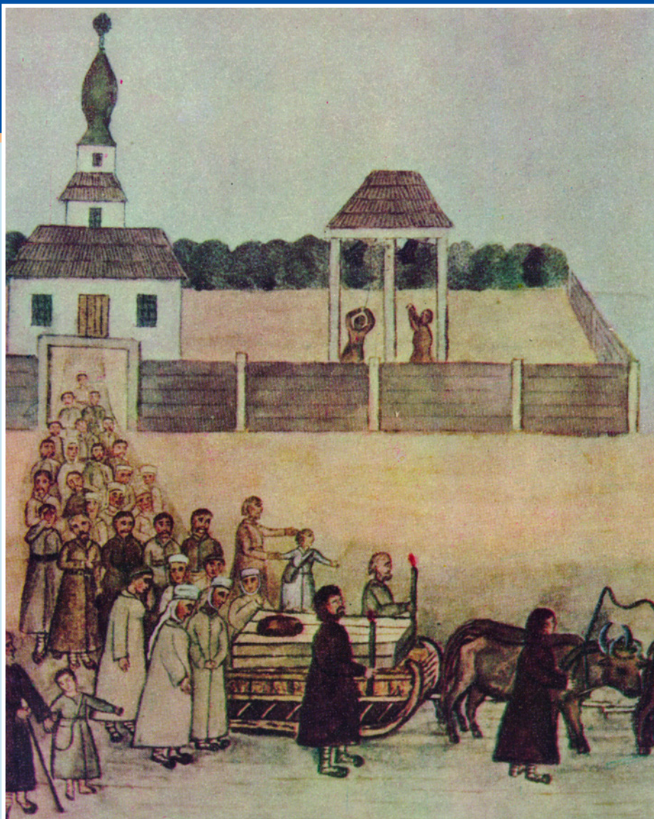
Похороны в селе. Народная украинская картина. Около 1848 г.

новому стилю) 1794 года в селе Ивановка под Харьковом закончилось жизненное странствие Григория Сковороды.