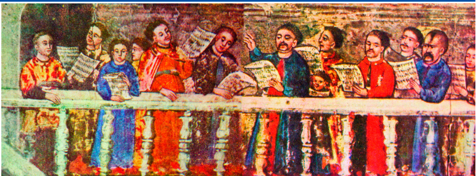
Певчие на хорах. Фрагмент иконы. 1686 г.