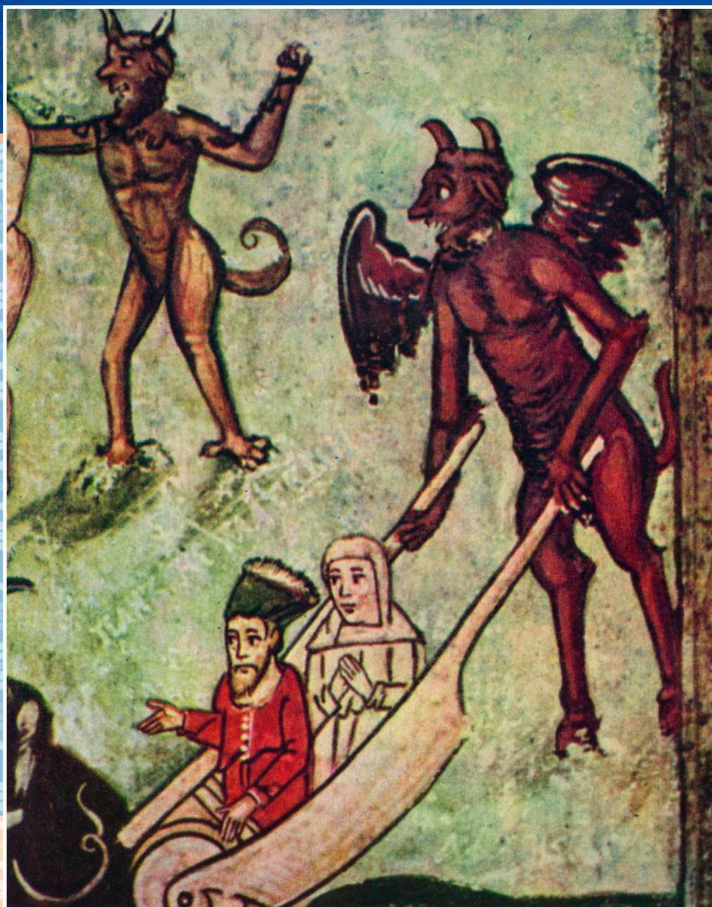
Черты везут немилостивого пана. Фрагмент народной иконы «Страшный суд». XVII в.

го занимается он в это время и переводами древних авторов.