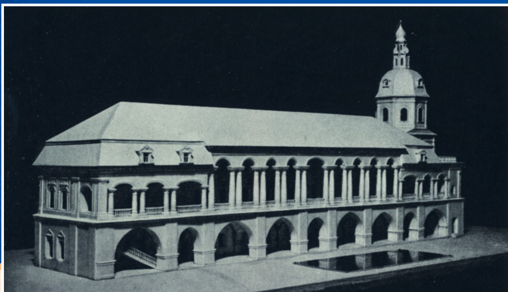
Киево-Могилянская академия, какой она была в годы учебы будущего философа. Макет.