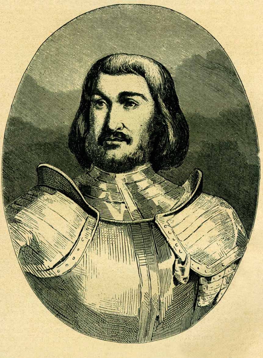
Жиль де Рэ.