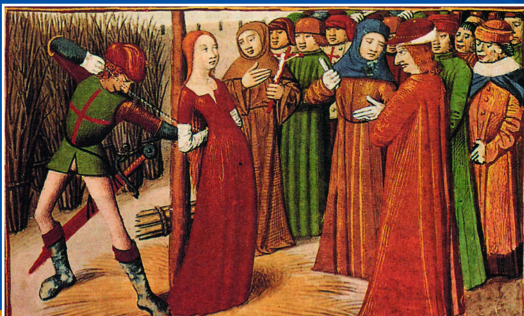
← Отряд Жанны д'Арк в бою. Худ. Адольф Ласински. 1852 г. Частное собрание.