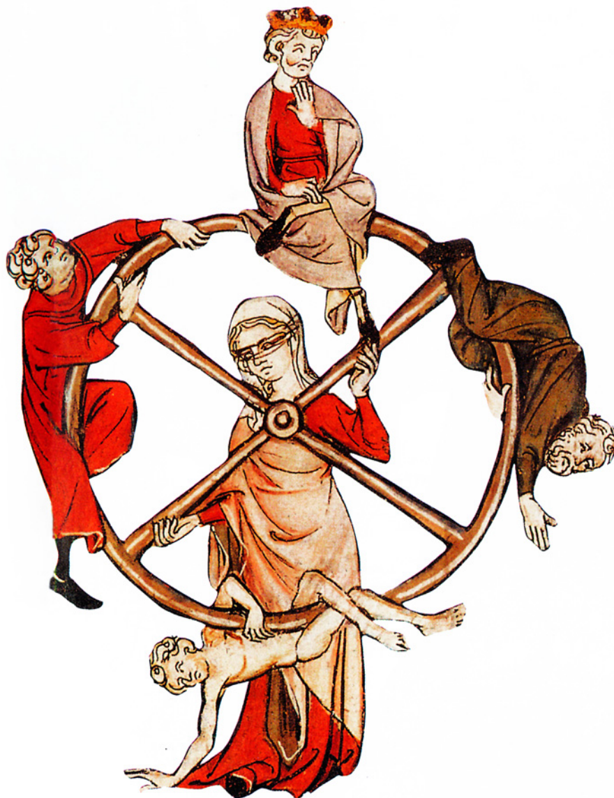
Колесо Фортуны – один из самых распространенных в средневековье символов человеческой жизни. Иллюстрация к стихам английского поэта Джона Лидгейта. XV в. Библиотека Манчестерского университета, США.

в вероотступничестве и связи с дьяволом. Тот, будто бы, в обмен на помощь требовал человеческих жертвоприношений, которыми и стали умерщвленные дети бедняков. В качестве главного свидетеля выступали колдун Прелати и его помощница некая Мэффрэ. В начале процесса де Рэ вел себя высокомерно, но был подвергнут пыткам, пал духом, «раскаялся и в преступлениях сознался» .