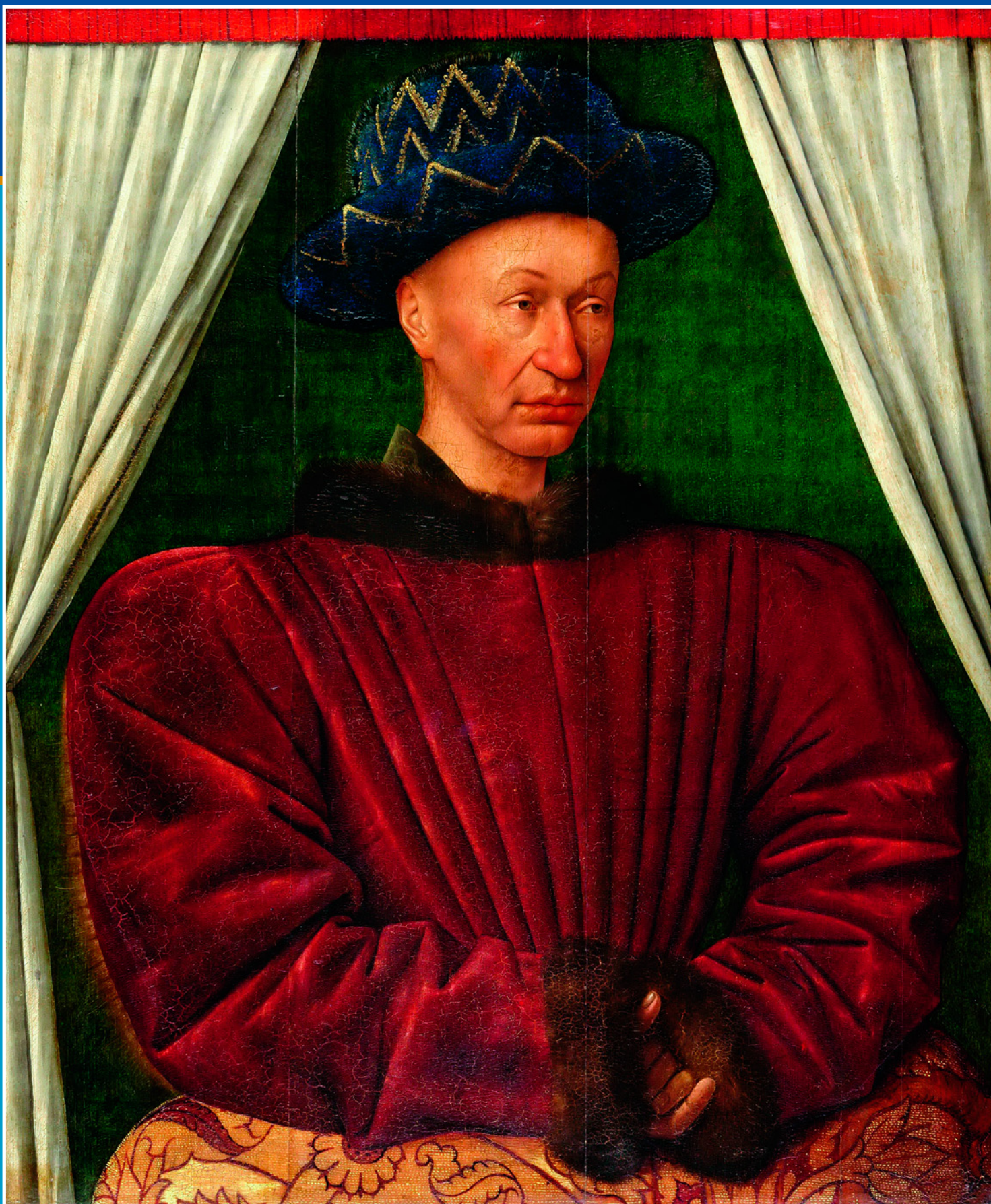
Портрет Карла VII. Худ. Жан Фуке. 1445-1450 гг. Музей Лувр, Париж, Франция.