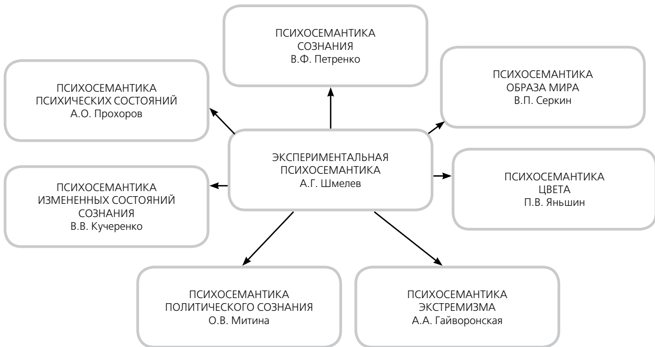
Рис. 1. Направления психосемантических исследований