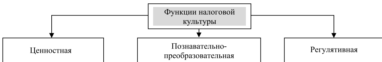
Рис. 1. Функции налоговой культуры общества