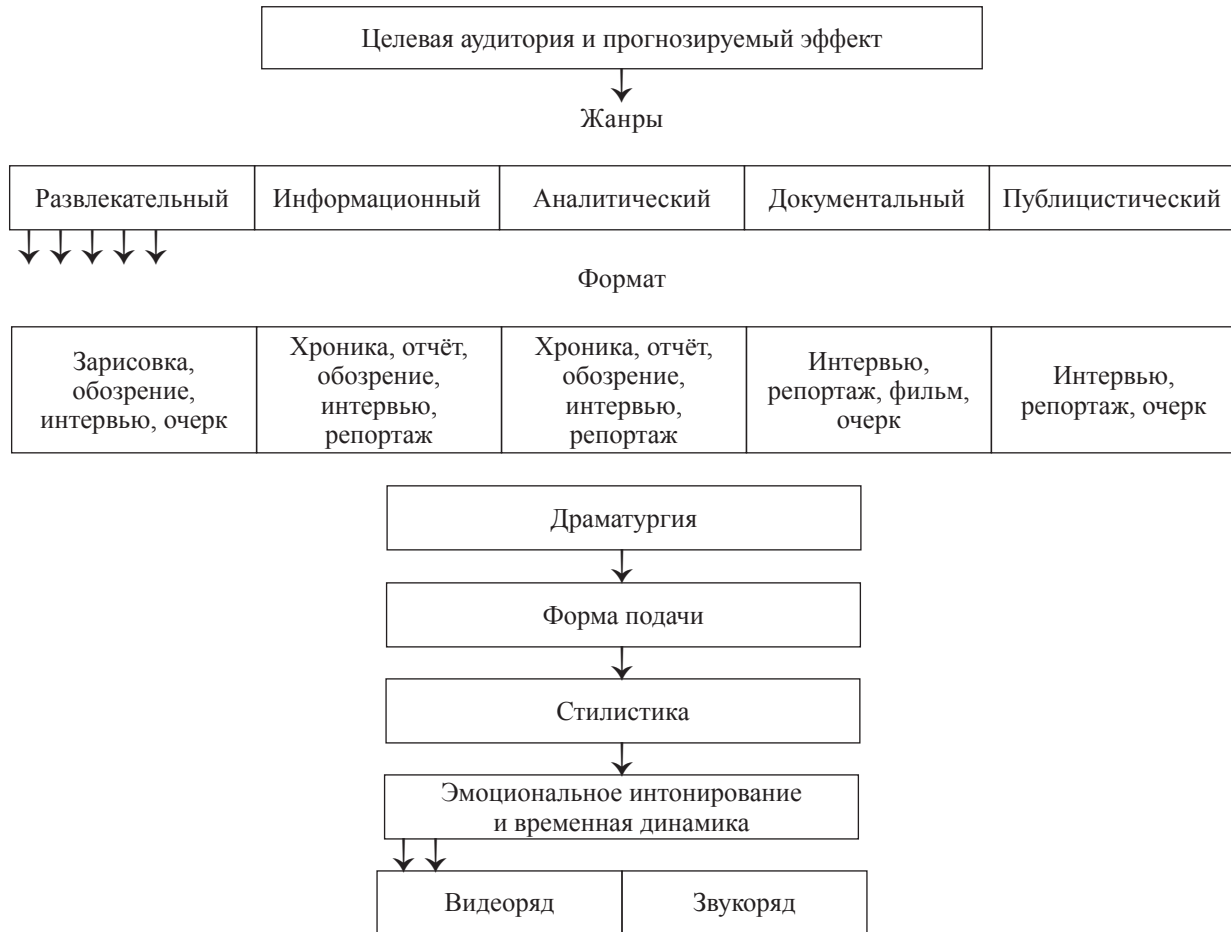
Ориентировочная карта-схема средств планирования телекоммуникации

кота». Она представляла собой специализированную информационно-развлекательную передачу для подростков. Она выходила в прямом эфире еженедельно, хронометраж программы — 40 минут. Программа была построена на репортажах подростков, интервью с интересными людьми, на общении с телезрителями в прямом эфире.