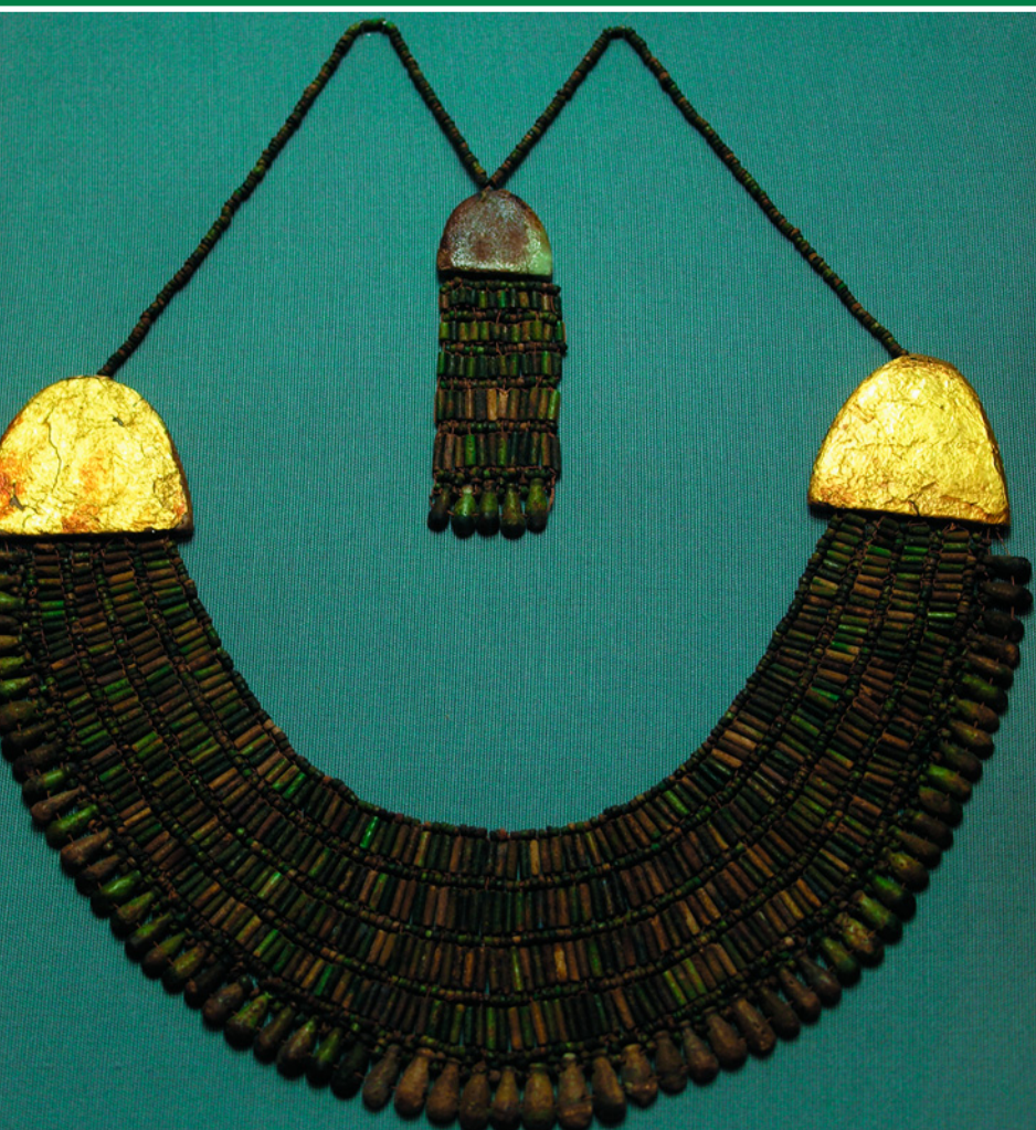
Медное ожерелье, украшенное золотой фольгой, сердоликами и фаянсом. Найдено в Гизе. Около 2347-2335 гг. до н. э. Музей истории искусств, Вена, Австрия.