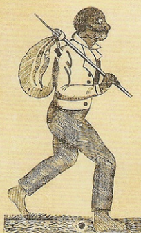
← Контракт о продаже раба. 1858 г. Музей Афро-Бразилии, Сан-Паулу, Бразилия.