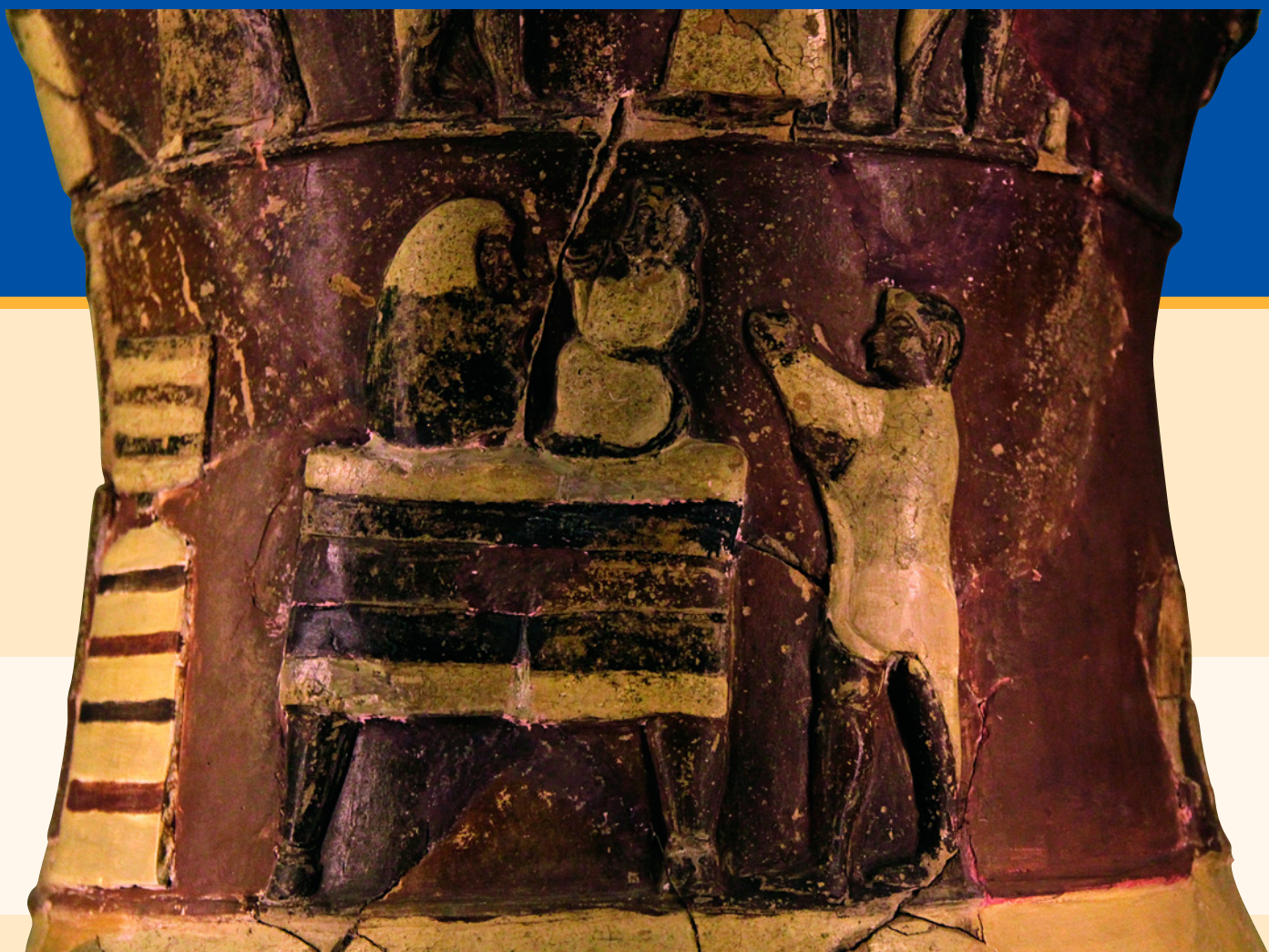
Повседневная жизнь хеттов. Фрагмент амфоры. XIII-XII вв. до н.э. Археологический музей, Чорум, Турция.

в победных анналах ассирийских царей». Побеждая врага, они не попирали его; покоряя, не истребляли; подчиняя, не уничтожали. Чаще всего хетты стремились присоединить соседние страны не военным путем, а дипломатическим, аннексируя территории путем заключения договоров с их элитой. Такая политика требовала минимальных затрат, а значит, была выгодна экономически. Так были поглощены, — как правило, мирным путем, — ряд мелких государств, лежавших на юге Малой Азии и в Северной Сирии: Каркемиш, Тархунтасса, Алалах, Угарит и Хальпа.