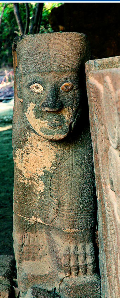
Хеттское божество. Рельеф из позднехеттской крепости Ацативадда в Таврских горах. Конец XII в. до н.э. Музей под открытым небом Каратепе, Турция.

Царь Суппилулиума II уже не мог остановить начавшийся распад империи и сопутствующие ей мятежи. Ему оставалось разве что рассылать в провинции письма, увещевая и обвиня мятежников. Однако в отпавших землях теперь хозяйничали пришлые племена.