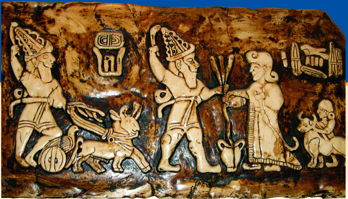
Глава хеттского пантеона, бог-громовержец Тешуб-Тарку узнаваем по изображениям с перунами в одной руке и с двойным топором – в другой.

Хетты стремились присоединить соседние страны не военным путем, а дипломатическим, аннексируя территории путем заключения договоров с их элитой. Такая политика требовала минимальных затрат, а значит, была выгодна экономически. Так были поглощены, – как правило, мирным путем, – ряд мелких государств на юге Малой Азии и в Северной Сирии: Каркемиш, Тархунтасса, Алалах, Угарит и Хальпа.