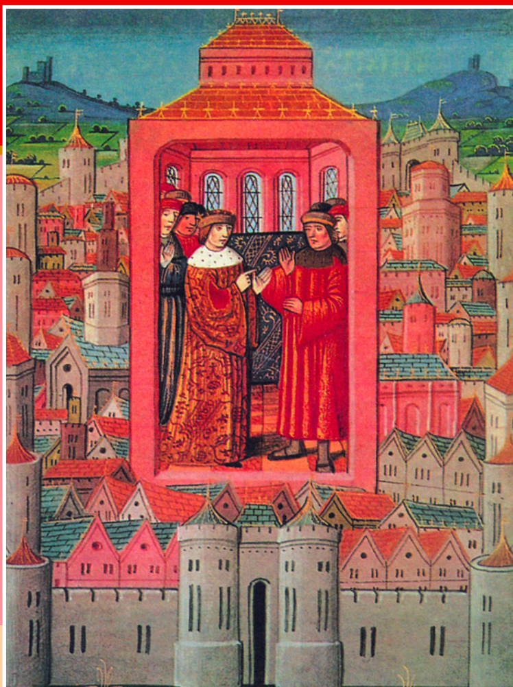
Договор в Конфлане, неблагоприятный для Людовика XI, последовавший за битвой при Монтери. Миниатюра 1465 г. Национальная библиотека, Париж, Франция.

тоже не смогли развернуться, тогда как к швейцарцам подходили все новые силы, которые теснили бургундцев. Не перестроившаяся полностью армия Карла стала отступать. Возникла паника, разгоравшаяся как пожар в лесу. Бургундские войска ринулись прочь от места сражения, оставляя богатую добычу в собственном лагере. Говорили потом, что за счет этой добычи несколько швейцарских кантонов безбедно жило не один год.