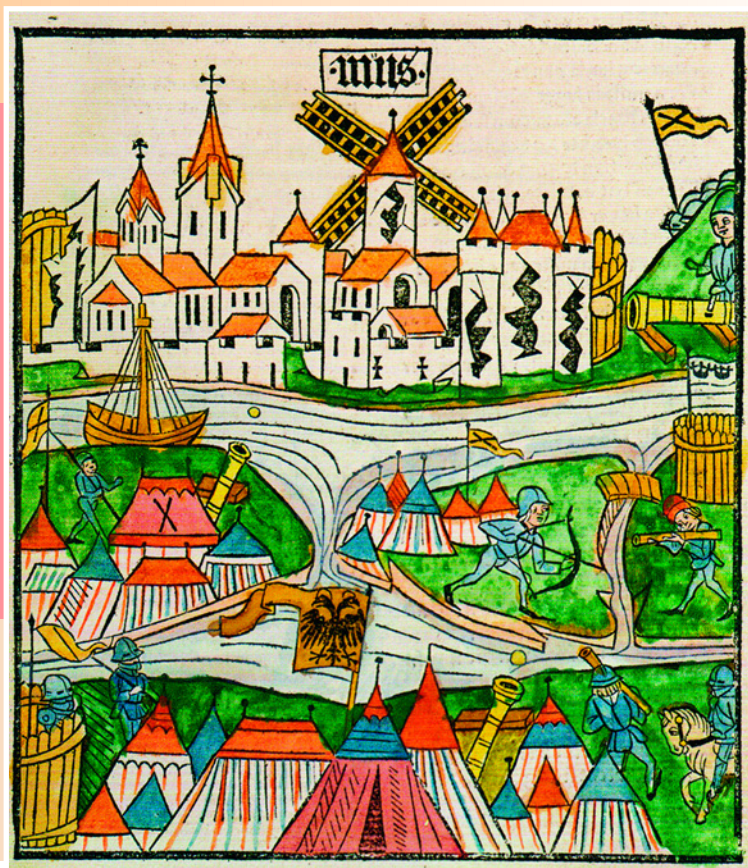
Осада Нойса Карлом Смелым в 1474-1475 гг. Рисунок из книги «Geschichte Peter Hagenbachs und der Burgunderkriege». Страсбургское издание 1477 г.

Главной ударной силой этой внушительной армии была швейцарская пехота с ее опытом построения в батальи (боевое построение XIII-XV веков в форме огромного каре, обычно шестью шеренгами) и тяжелыми алебардами, особенно эффективными